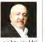
تعامل مدیریت شهری وزارت ارشاد برای امور فرهنگی