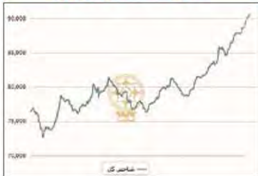
نمودار یکساله شاخص کل بورس

کارشناسان، تثبیت نرخ سود سپرده‌های بانکی، رشد قیمت جهانی کالاهای اساسی و ساماندهی بازار اوراق بدهی را از دلایل رشد تاریخی بورس ارزیابی کردند طبق آمار رسمی، ارزش کل معاملات در بورس کالای ایران نیز از ابتدای امسال تا سوم آذرماه جاری به بیش از ۵۹۵ هزار و ۲۰۰ میلیارد ریال رسید که نسبت به دوره مشابه سال قبل ۲۸ درصد رشد نشان می‌دهد