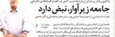
جامعه زیاوار، نبض دارد جمعه‌ای که در کربلا، نبض دارد

به دستور رئیس‌جمهوری، افزایش قیمت نان متوقف شد. رئیس‌جمهوری دستور داد تا افزایش قیمت نان متوقف شود. این دستور در حالی صادر شد که قیمت نان در سراسر کشور در حال افزایش بود.