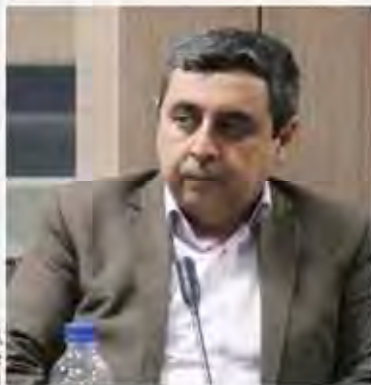
امیر امیرلو، مدیر اجرایی و معاون مدیرعامل شرکت پتروشیمی و پالایش نفت ایران