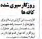
روزگار سپری شده کافه‌ها