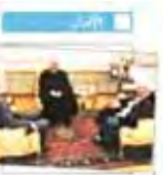
روز می بودجه‌ای ششمین سران مسافرت