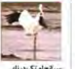
سرانجام تک‌دریای سیمبری هم آمد