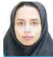
کتابون ملکی روزنامه‌نگار