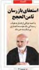
استغای باز رزان تا من الحجاج و امید توکل از فشار به هرات رسیدگی می کند توسعه اقتصادی و اجتماعی

گفت و گوی «شهرود» با میلاد منشی پور، مدیر عامل تپسی