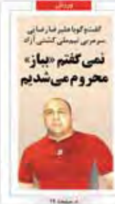
گفتگو با مدیر عامل سابق سر مری نیومتن کنش آژک نمی گفتیم «باز» محروم می شدیم

بندر میانی آمریکا که از لحاظ موقعیت هم تراز چاپار است، به اندازه تمام در آمد نفتی ایران تولید کربن می کند