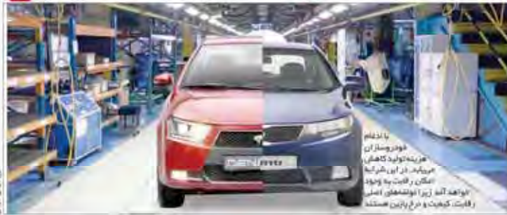
با اقدام خودروسازان، روند تولید کراس‌اوورهای جدید در ایران شتاب گرفته و مزایای اقدام ۲ قلب تولید خودرو را بررسی کرد.