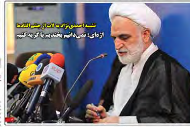
تشبه احمدی نژاد به لات از چشم افتاده از ه‌ای: نصی دانیم بخندیم یا گریه کنیم

پایمال شدن اخلاق تعمیمات لختی بازار را به حاشیه می‌برد تلفن‌های بی‌ساعت جامعه دولت