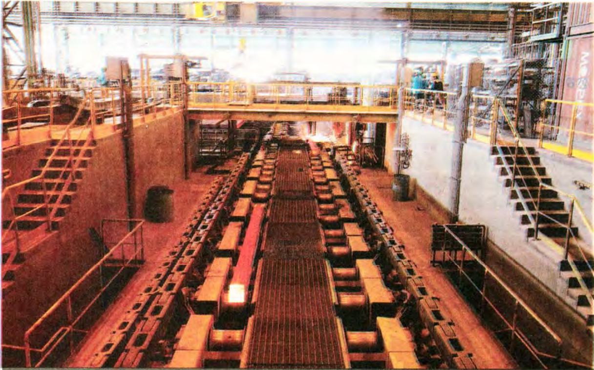
Billet and bloom made the bulk of semis exports during the period, reaching 2.32 million tons and marking a rise of 46% YOY.

665,000 tons and "other steel products" with 553,000 tons.