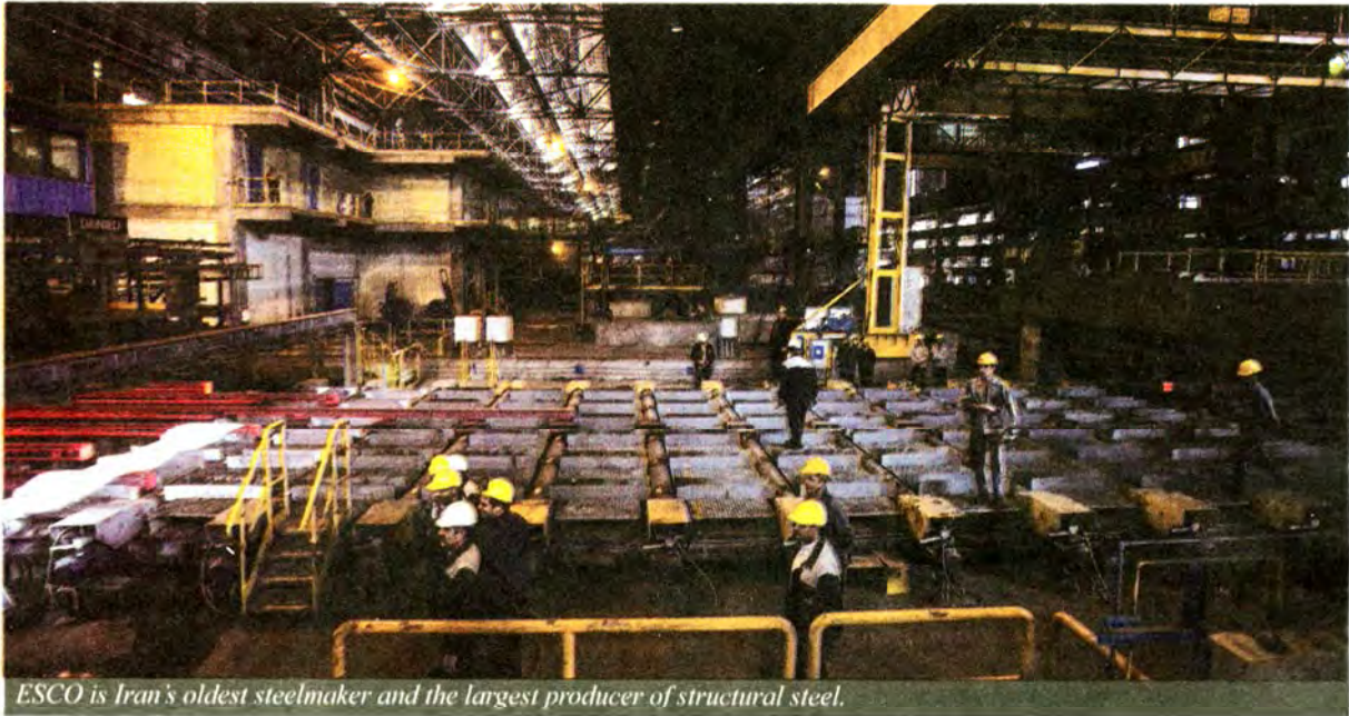
ESCO is Iran's oldest steelmaker and the largest producer of structural steel.

Iran Privatization Organization has struggled for the past two years to sell off steel pensioners fund's 16.75% stake in the steelmaker to no avail.