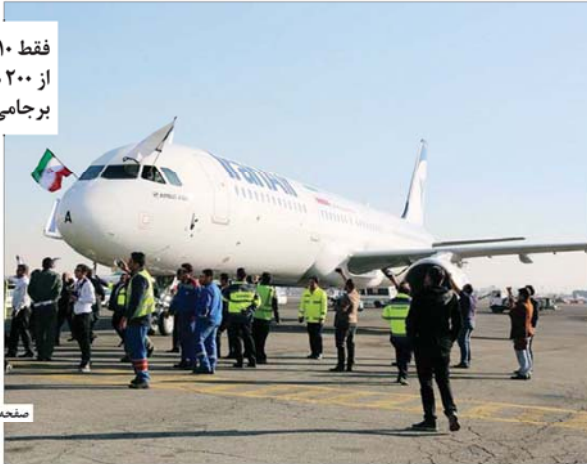
فقط ۱ صفحه