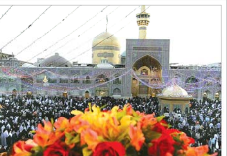
هزاران نفر برای جشن میلاد امام حسین (ع) جشن‌های اعیاد شعبانیه در سراسر کشور آغاز شد ۱۴

دکتر عرفاجی: تصور این که ایران در هر شرایطی به برجام متعهد می‌ماند، اشتباهی بزرگ است دکتر عرفاجی: تصور این که ایران در هر شرایطی به برجام متعهد می‌ماند، اشتباهی بزرگ است