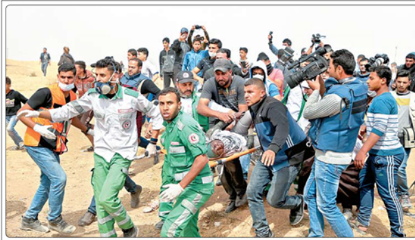
۲ شهید در چهارمین راهپیمایی «جمعه شهدا و اسرای فلسطین»

این نمایندگان از برنامه جامع اقدام مشترک به عنوان «کشایشی عمده» که پس از ۱۳ سال تلاش‌های دیپلماتیک مشترک به دست آمده است یاد کرد