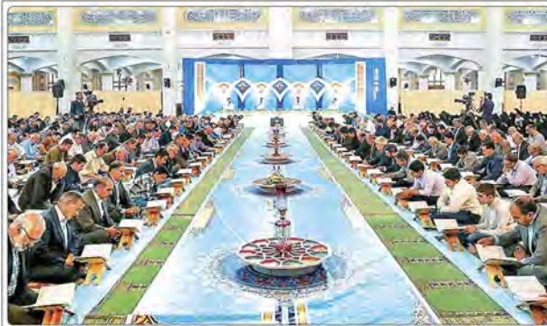
ترتیل خوانی قرآن در شب های آسمانی ماه مبارک رمضان

رئیس‌جمهور و اعضای هیئت‌مدیره و مدیران عامل شرکت‌های دولتی و خصوصی در جلسه‌ای با حضور وزیر امور خارجه و وزیر اقتصاد، در خصوص مذاکرات هسته‌ای گفت‌وگو کردند. شمخانی در این جلسه اعلام کرد که پرونده هسته‌ای هرگز گشوده نخواهد شد.