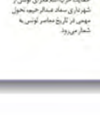
تونس در انتظار اولین شهردار زن