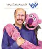
می خواهم با جناب خان به جام جهانی بروم