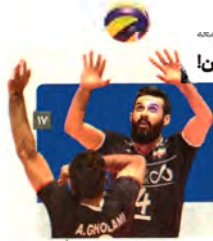
آغاز لیگ ملت‌های ویتنام از روز جمعه طلسم فرانسه را بشکن!