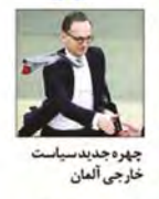
چهره جدید سیاست خارجی آلمان