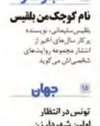
ادب و هنر