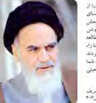
حضرت امام خمینی قدس سره الشریف صلی الله علیه و آله