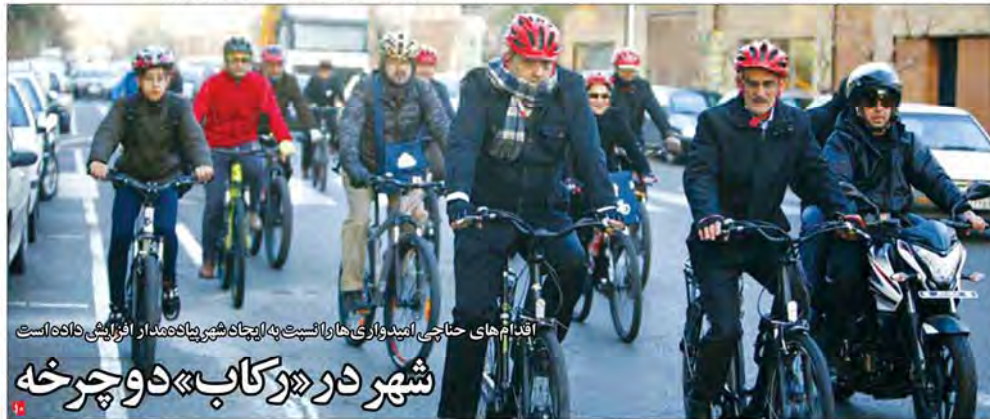
اقدام‌های حاجی امیدواری‌ها را نسبت به ارتقاء شهر پیاده‌مدار افزایش داده است شهر در «رکاب» دوچرخه

پنجشنبه جلسه شورای عالی روابط راهبردی ایران و ترکیه پنجشنبه در آنکارا به ریاست رئیس‌جمهوری دو کشور برگزار شد. در حاشیه سفر رئیس‌جمهوری جمهوری اسلامی ایران به ترکیه دو یادداشت تفاهم در حوزه بهداشت و درمان و امور ارتباطات و رسانه‌ای به امضا رسید. براساس این دو یادداشت تفاهم، دو کشور در