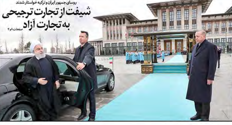
روسیات جمهوری ایران و ترکیه خواستار شدند شیفت از تجارت ترجیحی به تجارت آزاد