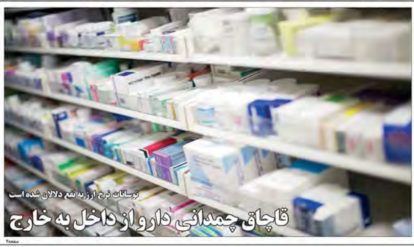
تسهیلات نرخ ارز به تبع دلالت شده است قاچاق چمدانی دارو از داخل به خارج