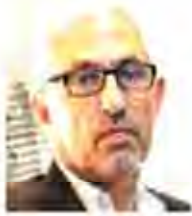
نظر افضلی نایب‌رئیس کمیسیون کشاورزی، آب و منابع طبیعی

آمارهای بسیاری درباره مصرف آب در ایران وجود دارد. سال‌هاست که بخش کشاورزی مصرف‌کننده بیش از ۹۰ درصد آب است. همچنین ایران در بین کشورهای جهان تنها کشوری است که مصرف آب بالاتر از ۵۰ درصد منابع تجدیدپذیر دارد. بر این اساس، مهم‌ترین اولویت ما استفاده بهینه از منابع آبی و افزایش