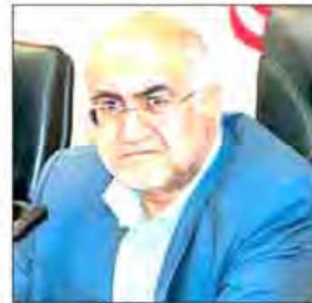
کرمان - خبرنگار اطلاعات: جلسه رفع موانع تولید و اقتصاد مقاومتی شهرستان بافت با حضور استاندار کرمان برگزار شد.

محمد جواد فدایی استاندار کرمان در این جلسه گفت: خوشبختانه پروژه های خوبی در شهرستان بافت در حال اجرا است و در این جلسه تلاش می کنیم موانع و مشکلات ایجاد شده در مسیر اجرای این طرح ها را با مصوباتی که داریم، رفع کنیم.