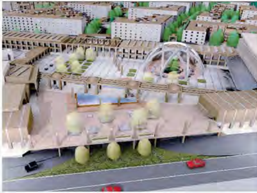
نمای هوایی از پروژه باز آفرینی شهری وزارت راه و شهر سازی

حبیب خرابانی در این نشست با تأکید بر اینکه خوشبختانه امروز ظرفیت جدیدی با هدف اجرای برنامه باز آفرینی شهری با نگاه ایران شهری در وزارت راه و شهر سازی ایجاد شده است، گفت: اگر تصمیم داریم ایران شهر را از حوزه توری به حوزه عملیاتی تغییر حالت دهیم قطعاً اعلام پایلوت سر جان، نهاوند و دامغان برای آغاز عملیات اجرایی شروع خوبی خواهد بود