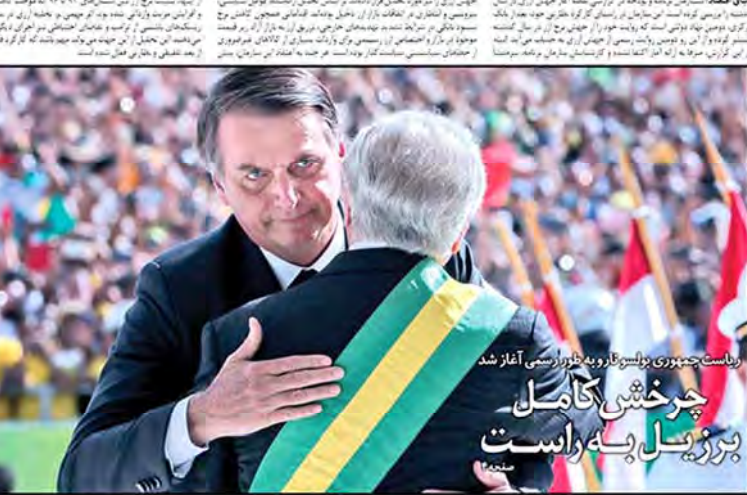
روایت جمهوری بولسوار و به طور رسمی آغاز شد چرخش کامل بزرگیل به راست