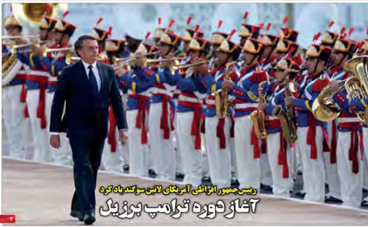
رئیس‌جمهور افزایش آمریکای لاتین سوکتد یاه کرد آغاز دوره ترامپ بوزریل