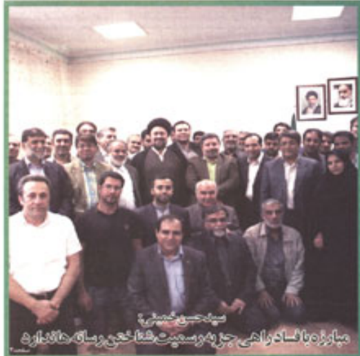
مبارزه با فساد واقعی چیست؟ بهر وسیله و روشی که باشد