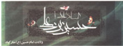
ولادت امام حسین (ع) مبارکباد

پشتیبانی ۱۱ خرداد ۱۳۹۳ شماره ۲ زبان ۱ ۲۰۱۵ سال سوم - دوره هفتم شماره ۲۸۹ صفحه ۲۲ ۱۰۰۰ تومان