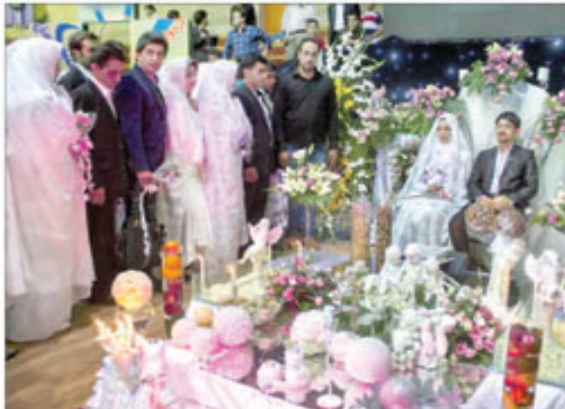
جشن آغاز زندگی مشترک ۱۰۰ زوج همزمان با میلاد حضرت علی (ع) و روز جوان

معاون اول رئیس جمهور، پرتماخت پارتیه به تمام خاندان‌های نیت نامی اعلامیه می‌یابد