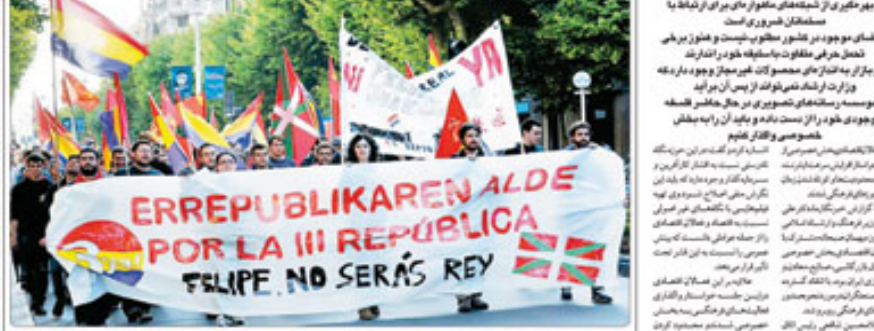
۴۰ شهر اسپانیا صحنه تظاهرات ضد سلطنت

برخی اصحاب فرهنگ و هنر به جای استفاده از تکنولوژی های نوین ارتباطی، به فکر مقابله با این فناوری ها هستند