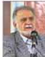
مهدی کرامیان رئیس هیات عامل ایمیرو

نخست معادن یعنی اکتشاف ورود پیدا کرده و با مشارکت به حلقه‌های صنعت پیوند بخورند. باید توجه داشت که در این بخش سرمایه‌گذاران با چالش‌هایی که در حوزه نفت دارند روبه‌رو نیستند زیرا در سرمایه‌گذاری نفتی مشارکت اصلا قابل قبول نیست. بخش معدن به دلیل پرباخت حقوق دولتی پس از فرایند اکتشاف و استخراج با حوزه نفتی متفاوت است و به نوعی تسهیل مشارکت با بخش خصوصی است. ایران می‌تواند با جذب سرمایه‌گذار خارجی در حوزه عناصر نادر زمینه صادرات محصولاتی همچون تیتانیوم، تنگستن و ولانیوم که با تقاضای بالای جهانی مواجه است را فراهم کند. محصولاتی که کشور ما از ذخایر بالای آن برخوردار بوده و با کشف و استخراج می‌توانیم سهم بخش معدن را از تولید ناخالص ملی افزایش دهیم. با توجه به اینکه معدن به عنوان یکی از پیشران‌های خروج از رکود مطرح شده است، تسهیل حضور سرمایه‌گذاران با حمایت‌های مالی می‌تواند روان بخش باشد به طوری که هم‌اکنون فولاد چابهار با ظرفیت ۳ هزار تن، ایمیرو با همکاری مناطق آزاد مقدمات آن را آماده کرده است که باید معدن غیرفعال را که چندین سال است به صورت سکوت مانده‌اند مجدداً تکمیل آنها از سر گرفته شود تا هدف گذاری انجام شده در اقتصاد کشور به‌دست آید.