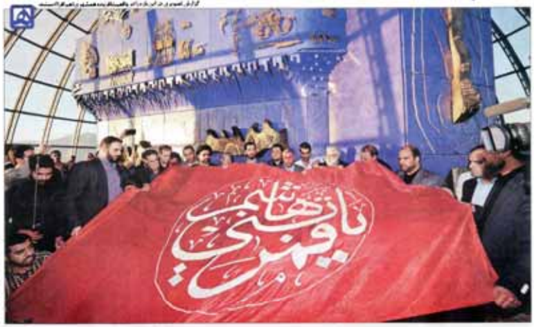
شهر، رنگ محرم گرفت | از پرچم حرم حضرت ابوالفضل علیه‌السلام در برج میلاد رونمایی شد