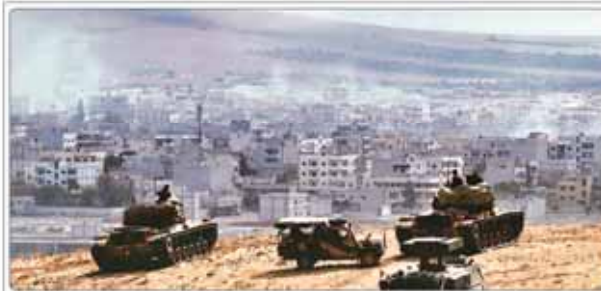
حمله تانک های ارتش ترکیه به کوبانی

«از موفقیت‌های افتخار آمیز شما عزیزان بسیار خوشمدم. هر دو خدمت جوانان در همه حرصها چنین دستاوردهای با ارزشی را به همراه دارید»