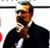
Hezbollah's war on terror more significant than many regional states' Larijani 111

12 Pages Price 5000 Rials No. 12117 Sunday OCTOBER 26, 2013 Aban 4 1393 Muharram 1 1416