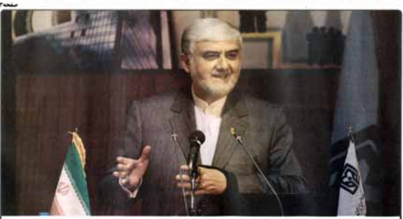
قاسمی به دولت یازدهم: دست‌مریزاد