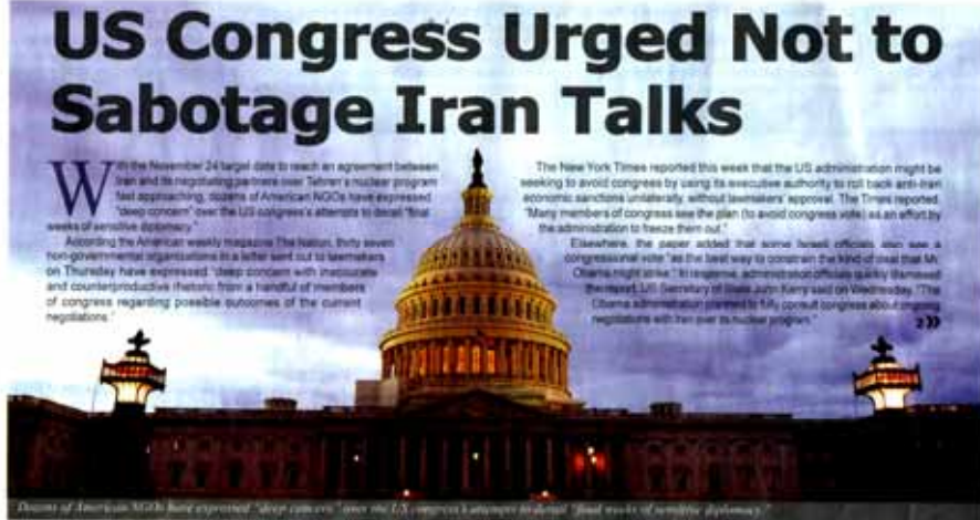
Dozens of American NGOs have expressed "deep concern" over the US congress's attempts to block "that weeks of sensitive diplomacy."

Elsewhere, the paper added that some lawmakers also saw a congressional veto "as the best way to constrain the kind of deal that Mr. Obama might strike." In response, administration officials quickly dismissed the report. US Secretary of State John Kerry said on Wednesday "The Obama administration planned to fully consult congress about ongoing negotiations with Iran over its nuclear program." 123