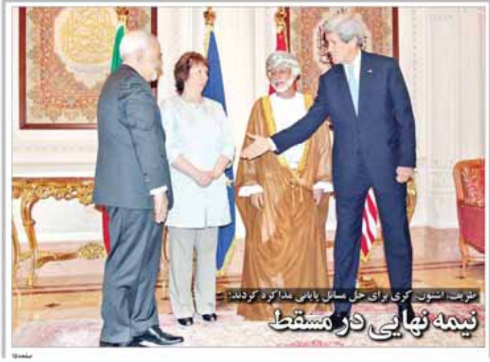
نیزت استون، کوزی برای حل مسائل یابانی مذاکره کردند / نیمه نهایی در مسقط

مجلس دولت و مجلس برای انتخاب وزیر علوم تا آخر آبان است