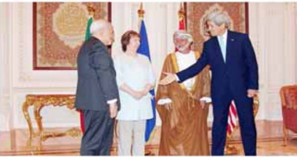
نشست سه جانبه ظرف، کری و اشتون در هتل پستان مسقط: عمان ایستگاه کاهش اختلافات برای رسیدن به توافق