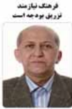
فرهنگ نیازمند ترویج بوده است

فرهنگ نیازمند ترویج بوده است. فرهنگ نیازمند ترویج بوده است. فرهنگ نیازمند ترویج بوده است. فرهنگ نیازمند ترویج بوده است.