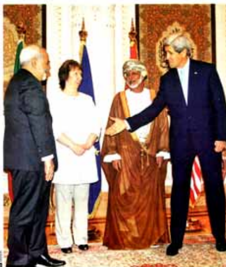
Iranian Foreign Minister Mohammad Javad Zarif (left), U.S. Secretary of State John Kerry (right) and EU Secretary of State Catherine Ashton (center) shake hands after the meeting in Muscat.

TEHRAN — Iranian Foreign Minister Mohammad Javad Zarif, U.S. Secretary of State John Kerry, and European Union envoy Catherine Ashton met at Muscat's Al Bustan Palace on Sunday to discuss the progress of the nuclear negotiations and to exchange views on the outstanding issues hindering a final deal on Iran's nuclear program.