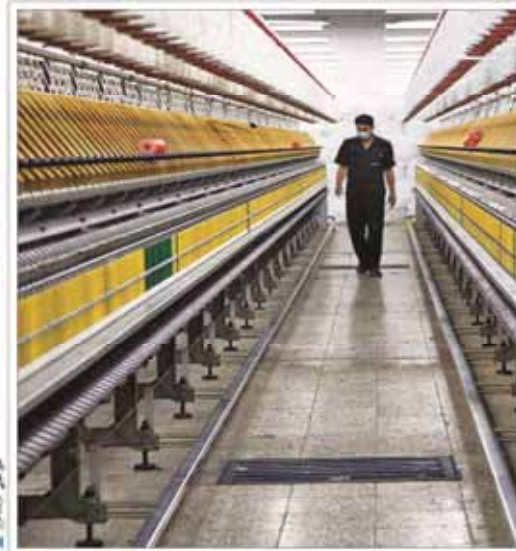
صنعت پوشاک زخم‌خورده از گذشته، امیدوار به آینده

کارشناسان اقتصادی در گفت‌وگو با فرصت امروز: شفاف‌سازی اطلاعات بانک‌ها جای خالی موسسات اعتبارسنجی را پر نمی‌کند.