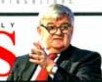
Iran is Middle East's new winner: Joschka Fischer

12 Pages Price 5000 Rials 36th year NO.12125 Monday, NOVEMBER 10, 2014 Aban 19, 1393 Baharan 16, 1436