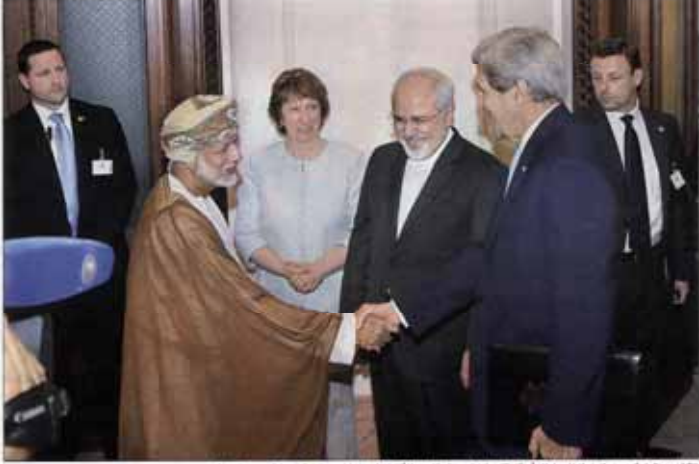
مذاکرات با مقامات جمهوری چین در مورد توافق همکاری اقتصادی در زمینه تجارت و سرمایه‌گذاری در استان گوانگ‌دونگ چین.

مبتدیان تدریس شده است در برخی مدارس کتاب‌های کمک آموزشی مبتدیان تدریس شده است... (Text continues with details about the distribution of textbooks to primary schools.)