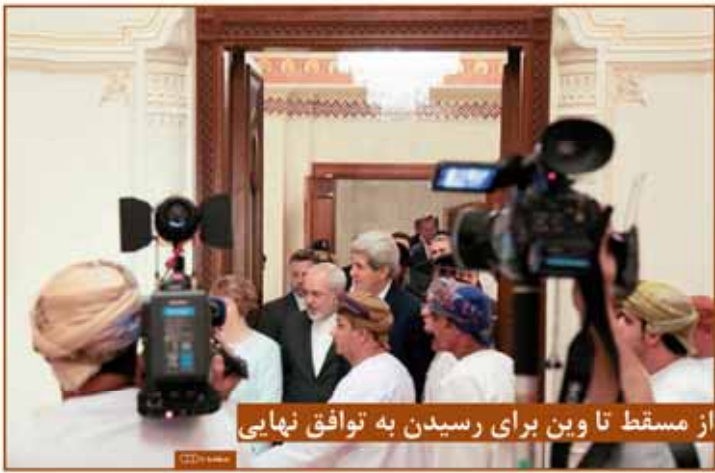
از مسقط تا وین برای رسیدن به توافق نهایی

نوبت: ۱۹ آبان ۱۳۹۳ شماره: ۱۳۳۳ شماره: ۱۳۳۳ قیمت: ۱۳۳۳ تومان - شماره: ۱۳۳۳