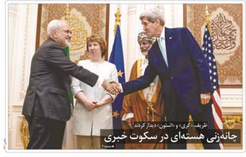
نظریه «گری» و «استون» دیدار کردند / چانه‌زنی هسته‌ای در سکوت خبری