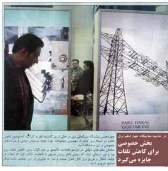
بخش خصوصی برای کاهش تلفات جایزه می‌گیرد

نماینده مجلس تأکید کرد: بیش از ۲۰۰ نماینده مجلس تأکید کردند بر لغو کامل تحریم‌ها و پافشاری بر حق غنی‌سازی نامحدود. مجلس شورای اسلامی در جلسه‌ای با حضور ۲۳۵ نماینده این موضوع را بررسی کرد.