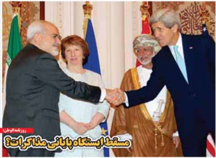
روزنامه‌آورین! مستط استغاه پایانی مذاکرات؟