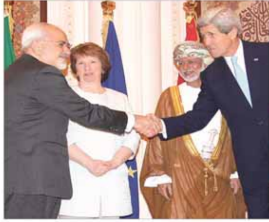
در این نشست خبری، وزیر امور خارجه گفت که ایران آمادگی دارد تا در صورت توافق مناسب، تحریم‌ها را بردارد.

آمادگی پسی در شهرهای غربی، روزهای انتخاباتی بوی انتفاضه سوم می‌آید