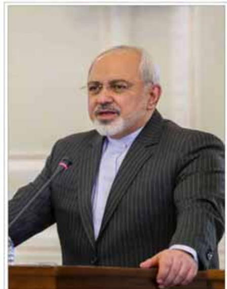
اگر ۱+۵ اغراض سیاسی نداشته باشد اکنون زمان خوبی برای توافق است

مراسم رونمایی از کتابت قیصر آیین بود. ۱۲ آبان در محل جشن آکر و عطار فرهنگی برگزار شد. آیین بر سرک‌سما حضور جمعی از معتمدان آیین آکر و عطار فرهنگی در حال انجام است.