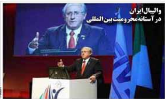
والبال ایران در آستانه محرومیت بین‌المللی