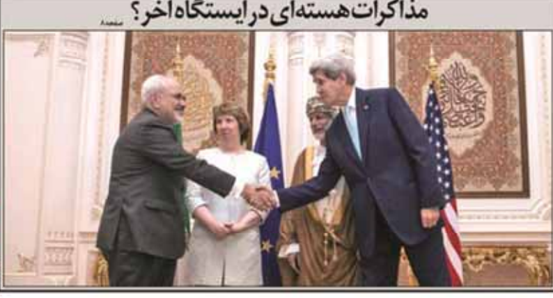
مذاکرات هسته‌ای در ایستگاه آخر؟

در حالی که مذاکرات هسته‌ای در مسقط در حال انجام است، منتظران سیگنال‌های مثبت از طرف ایران و ۱+۵ هستند. این مذاکرات در ۱۵ آبان ماه در مسقط عمان برگزار شد.