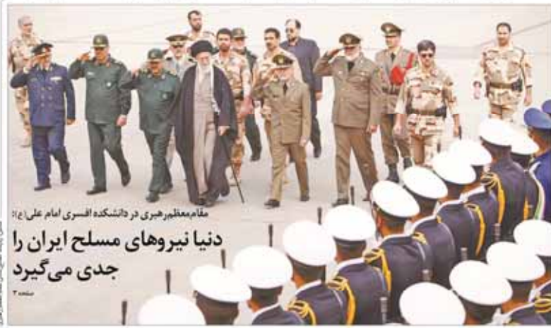
مقام معظم رهبری در دانشکده افسری امام علی (ع) دنیا نیروهای مسلح ایران را جدی می‌گیرد

مطهری: امیدوارم فیلمی که قرار است دوستان پخش کنند اکشن و جذاب باشد تا لذت ببریم