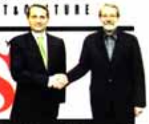
Duma chairman: Russia, Iran regard sanctions as 'political blackmail' 13

12 Pages • Price 5000 Rials • 36th year NO.12115 • Tuesday NOVEMBER 18, 2014 • Aban 27, 1393 • Muharram 24, 1436