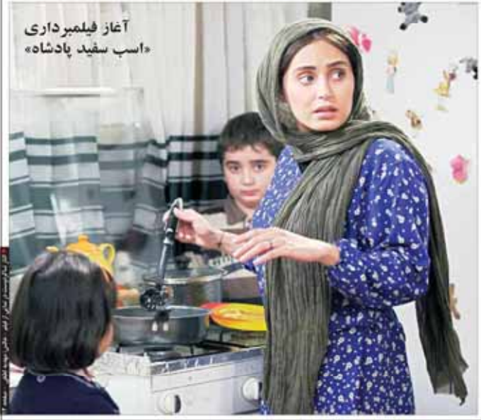
آغاز فیلمبرداری «اسب سفید پادشاه»