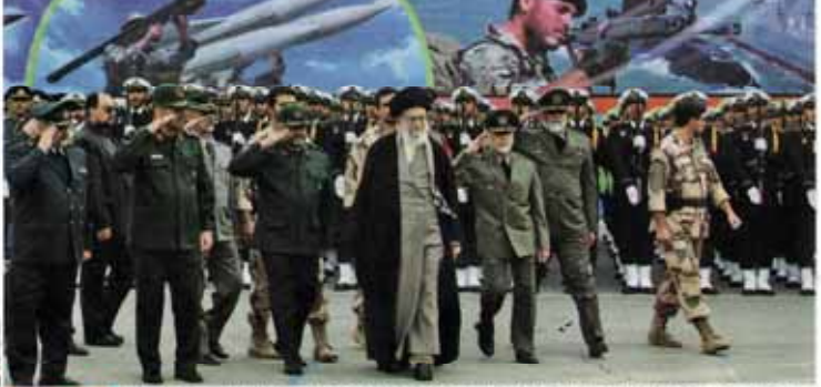
TEHRAN — Supreme Leader of the Islamic Revolution Ayatollah Seyyed Ali Khamenei has said that the dominating powers are using every method and tool to promote Islamophobia across the world. "Global Swifthes and the dominating powers are trying to use art, politics, militancy, and all [other] means to keep the voice of pure Islam from being heard." Continued on P. 11

Leader hails capacities of Iranian armed forces during Iran-Iraq war