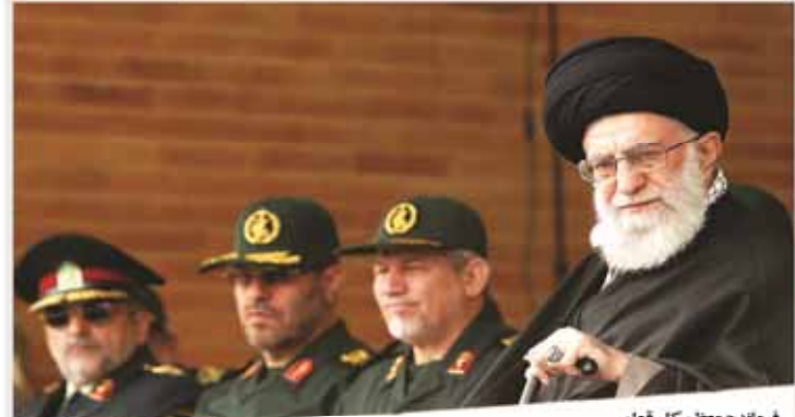
فرمانده معظم کل قوا، دشمنان با ساختن گروه های مسلح به نام اسلام، اسلام هراسی می کنند

باز شدن پای خاندان سعودی به پرونده اسپتامبر تمجید مامور وحدت اصولگرایان از محمدرضا رحیمی ایران - کره جنوبی بازگشت هیجان به آزادی با طعم دوستانه