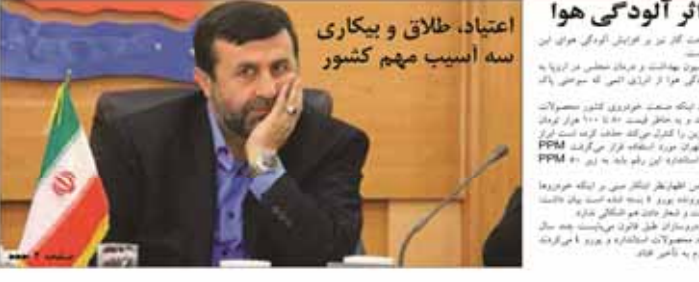
اعتیاد، طلاق و بیکاری سه آسیب مهم کشور