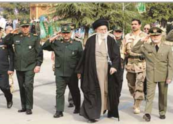
فرمانده کل قوا در دانشگاه افسری امام علی (ع)

جلسه فوق‌العاده سران «شورای همکاری خلیج فارس» در ریاض تشکیل شد