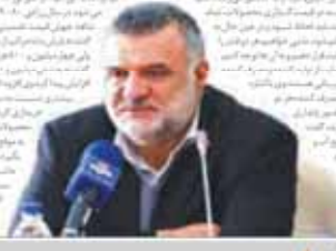
ولی‌الله سیف، رئیس کل بانک مرکزی

رئیس کل بانک مرکزی اعلام کرد که در پایان شهریور ماه، نقدینگی در کشور ۲۹٫۱ درصد رشد داشته است. وی افزود که این رشد در حالی است که بانک مرکزی در پی حذف عوارض صادراتی کالاهای کشاورزی است. سیف در این باره گفت: «در پایان شهریور ماه، نقدینگی در کشور ۲۹٫۱ درصد رشد داشته است. این رشد در حالی است که بانک مرکزی در پی حذف عوارض صادراتی کالاهای کشاورزی است. حذف عوارض صادراتی کالاهای کشاورزی، یکی از اقدامات بانک مرکزی برای کاهش بار مالیاتی بر بخش کشاورزی است. این اقدام به منظور افزایش رقابت پذیری کالاهای ایرانی در بازارهای جهانی و حمایت از تولید داخلی انجام می‌گیرد. سیف افزود که حذف عوارض صادراتی کالاهای کشاورزی، به منظور کاهش بار مالیاتی بر بخش کشاورزی و افزایش رقابت پذیری کالاهای ایرانی در بازارهای جهانی انجام می‌گیرد. این اقدام به منظور حمایت از تولید داخلی و افزایش رقابت پذیری کالاهای ایرانی در بازارهای جهانی انجام می‌گیرد.»