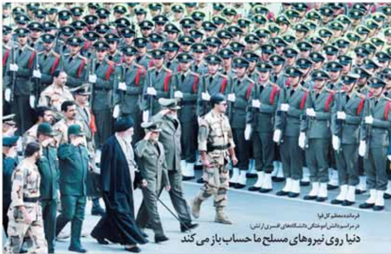
فرمانده معظم کل‌الیه در مراسم ارتقای آیینی ارتش دنیای روی نیروهای مسلح ما حساب باز می‌کند

حمایت نمایندگان و شخصیت‌های اصولگرا از ایستادگی تیم مذاکره کننده هسته‌ای