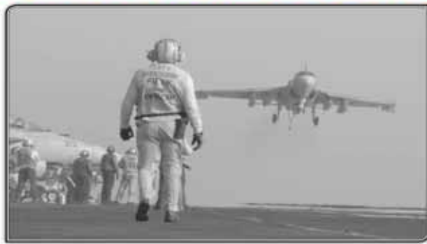
An EA-6B coming from Iraq lands on the flight deck of the U.S. Navy aircraft carrier USS George H.W. Bush in the Persian Gulf.

They're the ones that are still calling the shots" — when there were 104 ISIL attacks — operational tempo picked up, with 174 ISIL attacks in the month of August, according to DHS Jane's. Airstrikes were launched on August 9. After a small dip in the numbers in September, ISIL clocked up 141 attacks in October. Herman said September's reduction could be explained by a brief halt in order to build ground and consolidate ISIL territory. After that, he said, ISIL, just kept going. The group carried out several large-scale attacks on key Iraqi military installations and ramped up the number of attacks in areas like Anbar Province. "They have the ability to intensify and de-intensify their operational tempo at will," Herman said. "Instead of there being limitations forced on them by airstrikes, they're the ones that are still calling the shots. It's them that's dictating the pace, instead of vice versa."