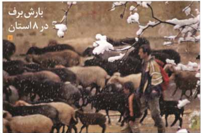
بارش برف در ۸ استان

سختگوی دستگاه قضا: اگر کسی با اسیدپاشی مردم را بترساند، محارب و حمله است