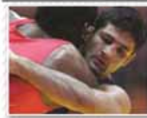
میزبانی بکت میبارد توانایی!