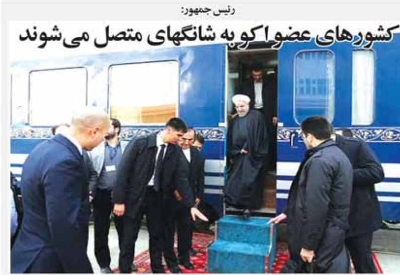
کشورهای عضو آکو به شانگهای متصل می شوند

تأمین مالی در صورتی که به کار می‌آید، باید دارای ضمانت باشد... (Text continues discussing insurance and financial support)