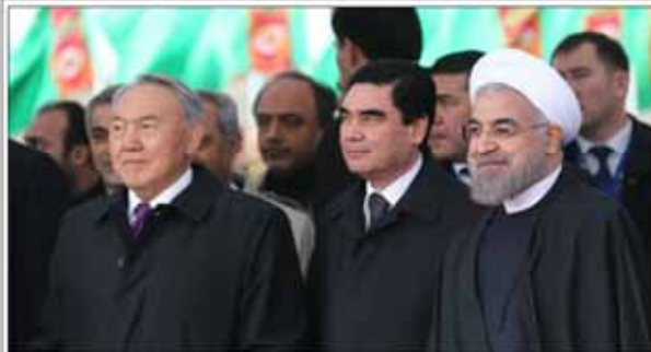
رئیس جمهوری در مراسم توزیع دفترچه بیمه درمانی پایه در تهران

مدیر عامل بانک مهر: سامانه جامع بانکداری دی طرح جدیدی در نظام بانکی است