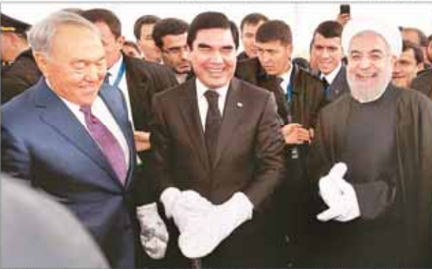
رئیس جمهور، وزیر امور خارجه و دیگر مقامات ایرانی در افتتاح خط آهن ایران - ترکمنستان - قزاقستان

استان جهانی که در این اجلاس اعلام شد... در دومین اجلاس وزرای اطلاع‌رسانی کشورهای اسلامی مطرح شد