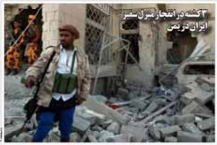
آتشه در انتحار شمال شیراز ایران در یمن

سیصد و پنجاه و یکمین شماره ۲۰۱۹۳ شماره ۱۹۳ سالروز بنیانگذاری ۱۳۵۷ هجری قمری - ۱۳۵۷