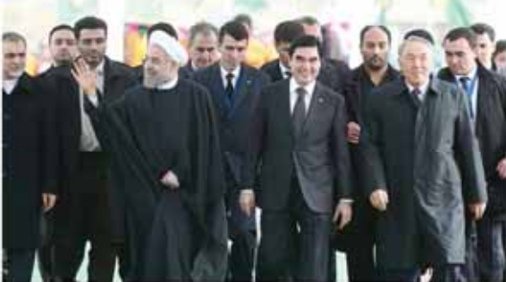
معاون وزیر کار تشریح کرد:

گروه ایران-ترکمنستان راه آهن بین المللی ایران-ترکمنستان افتتاح شد. خط آهن بین المللی ایران-ترکمنستان با طول ۱۰۰ کیلومتر در استان آذربایجان غربی و استان آذربایجان شرقی احداث شده است. این خط آهن با بهره‌گیری از فناوری‌های پیشرفته و با همکاری شرکت‌های ایرانی و ترکمنستانی احداث شده است. افتتاح این خط آهن به توسعه اقتصادی و ترافیکی منطقه و تقویت روابط بین المللی ایران و ترکمنستان کمک خواهد کرد.