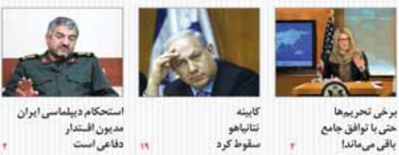
برخی تحریرها حتی با توافق جامع باقی می ماند! / کابینه نتایج سقوط کرد / استحکام دیپلماسی ایران مدیون اقتدار دفاعی است

پنجشنبه ۱۳ آذر ۱۳۹۳ شماره ۲۰۱۹ قیمت ۲۰۰۰ تومان