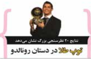
ننایج ۲۰ نفرستی بزرگ نشان می‌دهد گوب طلا در دستان رونالدو

پنجشنبه ۱۳ آذر ۱۳۹۳ / ۱۱ مهر ۱۳۹۳ / ۲۰ آبان ۱۳۹۳ / چاپ روزانه در مشهد و تهران WWW.KHORASANNEWS.COM • KHORASAN-E VARZESHI