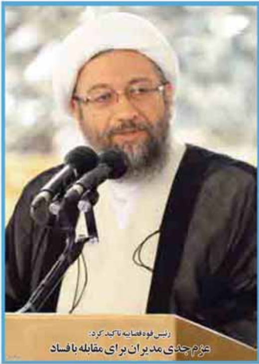
رئیس فوه فتنایه تاکید کرد: عزم جدی مدیران برای مقابله با فساد

پنجشنبه ۱۳ آذر ۱۳۹۳ ۱۱ مهر ۱۳۹۳ ۶ دیماه ۲۰۱۴ سال چهارم شماره ۲۰۲۸ ۱۶ صفحه ۱۰۰۰ تومان