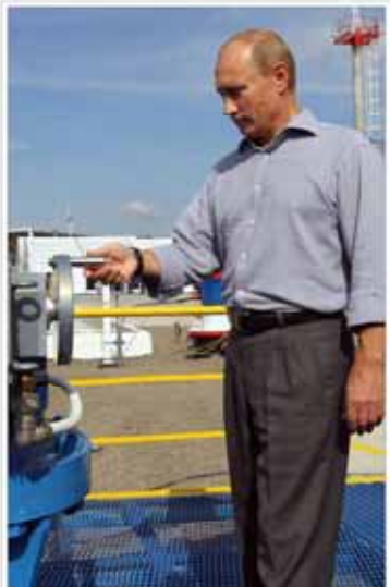
یوتین قدرت مقاومت در برابر بحران را دارد؟

معاون توسعه منابع و سرمایه‌گذاری وزارت جهاد کشاورزی اعلام کرد که در کشور یک میلیون سلاح شکاری در دست مردم وجود دارد.