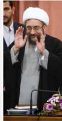
آیت الله اعلیٰ لاریجانی:

گروه جهان: انفجار نزدیک خانه سفیر ایران در یمن. این انفجار در نزدیکی خانه سفیر ایران در یمن رخ داد. مقامات ایرانی اعلام کردند که این انفجار به احتمال زیاد با تروریست‌ها مرتبط است. سفیر ایران در یمن اعلام کرد که او و خانواده‌اش در حال حاضر بی‌خطر هستند. این انفجار باعث خسارت‌هایی به خانه سفیر شد. مقامات ایرانی در پی شناسایی عاملان این انفجار هستند.