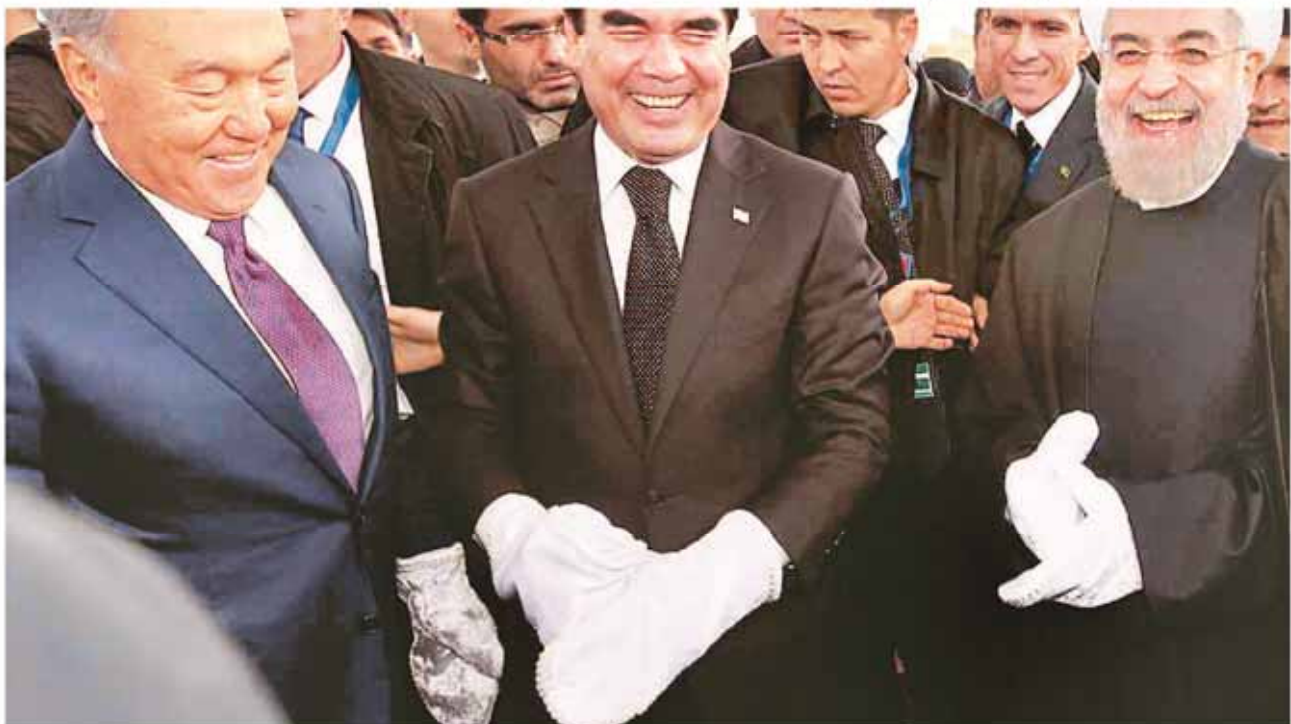
۳ رئیس جمهوری به نشانه تقویت پیوند و استحکام بیش از پیش همکاری ها و روابط مشترک و در حرکتی نمادین، بیچ یکی از ریل های خطوط آهنی را سلت کردند که سه کشور را به هم متصل می کند

* دکتر حسن روحانی: توسعه، امنیت و ثبات هر یک از کشورهای ما توسعه، ثبات و امنیت یکدیگر است * در سال های آینده این راه آهن را به دریای عمان متصل خواهیم کرد * رئیس جمهوری قزاقستان: سه کشور در مبارزه با تروریسم و ایجاد امنیت و توسعه اقتصادی دارای اهداف مشترک هستند * رئیس جمهوری ترکمنستان: این راه آهن شاهراهی بین المللی است و کمک بزرگی به شکوفایی اقتصادی و حسن همجواری کشورها خواهد کرد * سران ۳ کشور سوار بر قطار تشریفاتی، حدفاصل ایستگاه