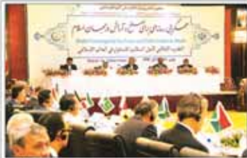
در دومین اجلاس وزرای اطلاع‌رسانی کشورهای اسلامی مطرح شد

این خط آهن ۹۲۰ کیلومتری به عنوان کریدور ریلی شمال به جنوب از شهر اوزن در قزاقستان تا شهر گرگان در استان گلستان امتداد دارد