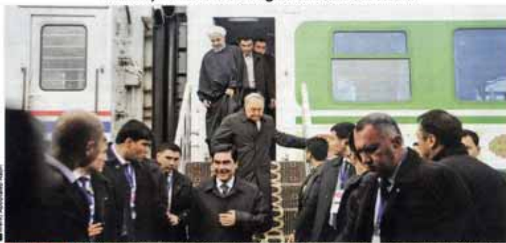
TEHRAN — Iran, Turkmenistan, and Kazakhstan inaugurated the final 33-kilometer section of a railway, linking the three countries east of the Caspian Sea, with the goal of boosting and facilitating regional trade and transit. The inauguration ceremony took place on Wednesday in Turkmenistan, where Iranian President Hassan Rouhani joined Kazakh President Nursultan Nazarbaev and Turkmen President Gurbanguly Berdimuhamedov. [Cont'd. on P. 4]

Railway will facilitate regional trade: Rouhani