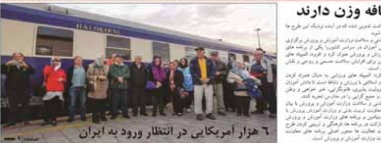
۶ هزار آمریکایی در انتظار ورود به ایران