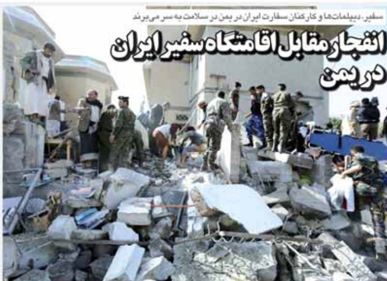
سفیر، دیپلمات‌ها و کارکنان سفارت ایران در یمن در سلامت به سر می‌برند