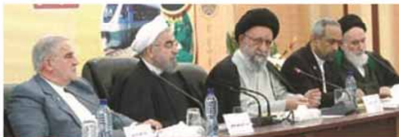
حضور رئیس جمهوری در جمع مردم روستای دوگنچی

آخرین بخش برنامه سفر رئیس جمهوری به استان گلستان، حضور در شورای اداری این استان بود. رئیس جمهوری در این جلسه از استقبال گرم و صمیمی مردم استان از کاروان تدبیر و امید قدرانی کرد و گفت: استان گلستان همواره نماد وحدت اقوام و مذاهب است و می‌تواند الگوی بسیار خوبی برای همه مسلمانان باشد. حجت‌الاسلام حسن روحانی با اشاره به اینکه حضور مردم گره گشای مشکلات اقتصادی کشور است، افزود: اگر مردم را در صحنه فعال کرده و فناوری‌های نوین را مورد توجه و استفاده قرار دهیم، می‌توان تحولات بزرگی را در زمینه پیشرفت و آبادانی کشور ایجاد کرد.