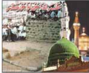
التفاصيل على الصفحة ٧

في تكون استشهاده نبي الرحمة (ص) والامام الحسن الرضا (ع) - الانتفاضة.. سلاح فخر ومكر يهودي - أموي لتكتمان الحقيقة الالهية