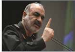
وهدد سلامي بالقول: لنا رقم تصنيف لمعالي المحترفين والخصار العلمي من قبل الاعداء.. حقلنا هذه التجارب - ولأن يمكننا ان

يمكننا ان ندعي ان ان بلد لم يتوصل الى تقنية صواريخنا ونحن نعد من الأفضل حاليا في هذا المجال