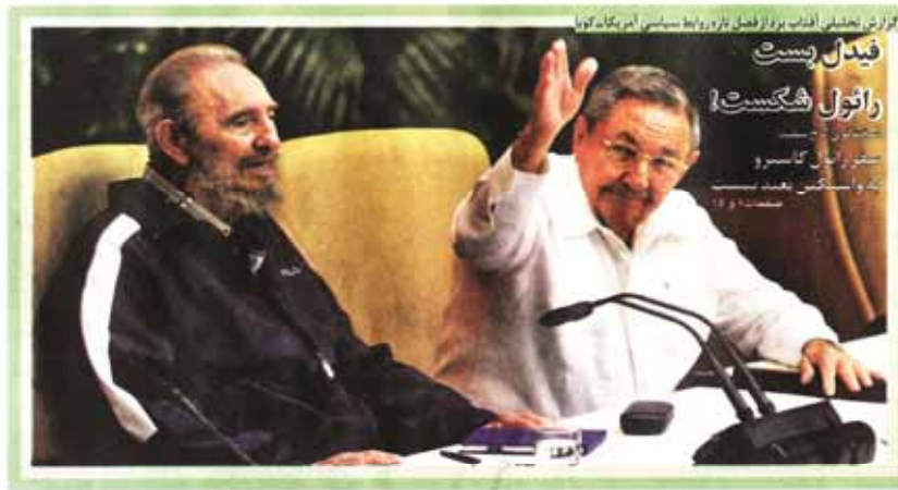
گزارش تلویزیونی آفتاب پرواز فضل از روابط سیاسی آبر و بنگاه آذربایجان