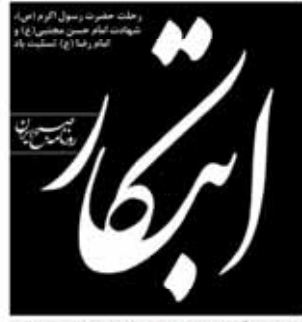
شنبه ۲۹ آذرماه ۱۳۹۳ - سال نهم - شماره ۲۵۸ - ۳۰ صفحه - ۱۳۰۰ تومان

پوتین: من برای حل مسأله هسته ای خود را مسکوت نگذاشته ام پوتین در کنفرانس مطبوعاتی مسأله خود را مسکوت نگذاشته و سعی کرده است که با اشاره به مسأله هسته ای ایران، به دنبال راه های عملی برای حل این موضوع باشد. پوتین گفت: من به این باورم که دستیابی به یک توافق پایانی در مسأله هسته ای ایران نزدیک است. ولادیمیر پوتین، رئیس جمهور روسیه در آخرین کنفرانس خبری خود، بر صلح جاری میلادی با استیضاح و استعاضای ایران در مذاکرات هسته ای، گفت: دستیابی به یک توافق پایانی بر سر برنامه هسته ای ایران نزدیک است چون من مطمئنم این کشور استقلال کامل بومی را خود نشان داده است.