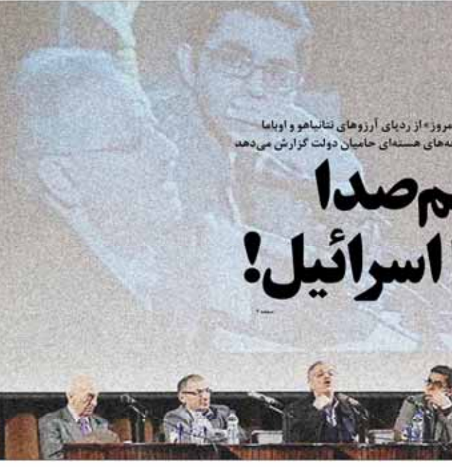
نخستین جلسه هیئت‌های حامیان دولت گزاش می‌دهد