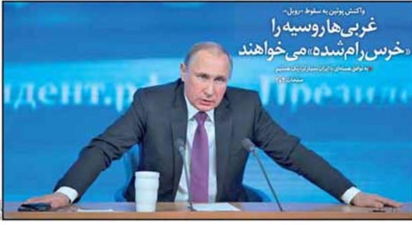
ولادیمیر پوتین ره سوط «رویل» «خرس رام شده» می خواهند

بانک مرکزی با انتشار بیانیهای رومانی کرد دولت اقتصاد به شما قدرت پیش بینی می دهد