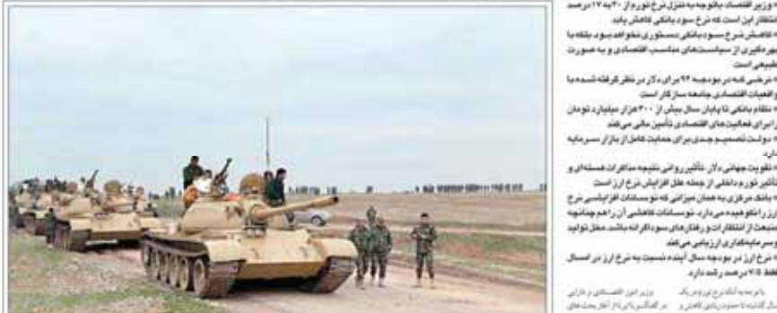
نیروهای پیشمرگه محاصره کوههای «سنجار» عراق را شکستند