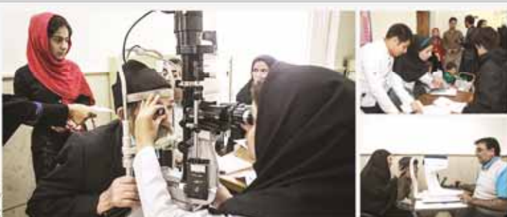
شرح جهادی وزیرت و ریگان بهمان با عنوان دستهای جهردن در ستاقی محروم شهر تهران برگزار شد.

مخالفت سوریه با اجرای طرح نماینده سازمان ملل