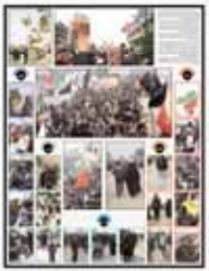
تصاویر گوناگون از راهپیمایی اربعین