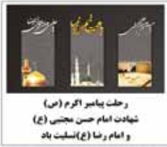
رحلت پیامبر اکرم (ص) و شهادت امام حسن مجتبی (ع) و امام رضا (ع) تسلیت باد