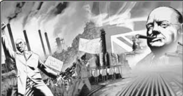
The CIA has admitted role in the 1953 ouster of Iran's popularly elected prime minister, Mohammad Mossadegh.

Iran announced it is once again delaying the release of its study on the coup. The coup was carried out primarily for the benefit of British oil interests, as Mossadegh was planning nationalization. Legally speaking, the State Department was only supposed to keep the history secret for 30 years.