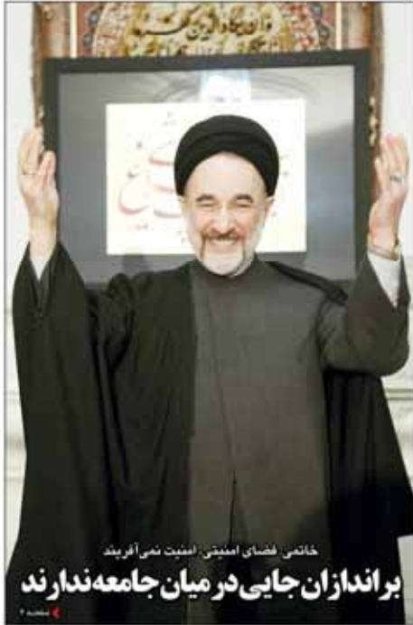
خاتمی فضای امیدبخش، امنیت نسبی آفریدند بر اندازان جایی در میان جامعه ندارند

برنامه ریزی رئیس جمهور روسیه برای سفر به تهران؛