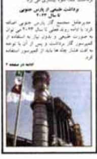
توسعه زیرساخت‌ها در راستای تقویت بازار سرمایه

دولت با اتخاذ رویکرد حمایتی، به تقویت بازار سرمایه و جذب سرمایه‌گذاری‌ها اقدام کرده است. این رویکرد شامل تسهیل فرآیندهای ادغام و ترازوهای مالی شرکت‌ها می‌گردد.