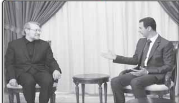
Syrian President Bashar al-Assad, right, holds talks with Iran's parliament speaker Ali Larijani in Damascus.

tion... all over Syrian territory". The two sides also discussed ways to improve mutual relations in all fields and the latest developments in Syria and across the Middle East. Larijani's visit comes less than a fortnight after Assad met a top Russian envoy who said Moscow is hoping to relaunch peace talks and that it could host a Syria-U.S. meeting. Syria has been grappling with a deadly crisis since March 2011. More than 200,000 people have been killed so far in the conflict in Syria, according to the United Nations. Earlier on Sunday, Larijani said the U.S.-led coalition against ISIL, militants is nothing more than a charade. Speaking to reporters at Damascus International Airport upon his arrival, Larijani said the fight against terrorist groups would bear fruits only through the "effort and resistance" of the regional nations. "The Islamic Republic of Iran supports a political solution that will