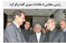
رئیس مجلس با مقامات سوریه گفت و گو کرد

با افزایش نرخ سود بانکی، تورم از تورم پیشی گرفت و سود بانکی از تورم پیشی گرفت. بانک مرکزی نرخ سود سپرده‌ها را از امروز افزایش داد. نرخ سود سپرده‌های بلندمدت ۱۰ درصد و نرخ سود سپرده‌های کوتاه‌مدت ۸ درصد تعیین شد.