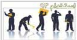
شرکت آروند پلاستیک نیروی هوایی ارتش ج.ا.ای ترک تولیدی صنعت برقی