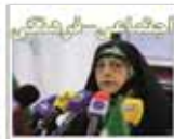
پارازیت منوی مشخص ندارد