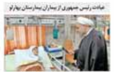
روحانی: طرح تحول سلامت کامل ترمیمی شود