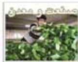
پشتیاد نرخ خرید لبنی جای به دولت