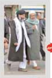
همه نمایندگان کشور از بودجه سازمان حاشیه شهر مشهد حمایت می کنند

بانک مرکزی با افزایش نرخ سود سپرده های کوتاه مدت از ۱۰ تا ۲۲ درصد اعلام کرد.