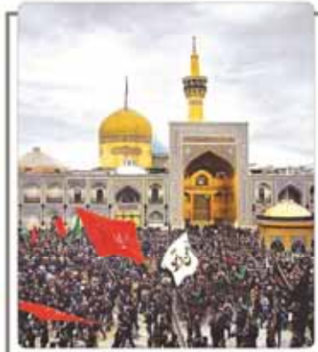
بناظرین شهادت هشتاد و هفتاد و پنج هزار تن در میدان امام رضا (ع) و امامت، امام رافع عالم آل محمد (ص) حضرت علی بن موسی الرضا علیه السلام تشییع پاد

تولیدۀ امیر ۱۳۹۳ - ۲۳ شهریور ۱۳۹۳ - شماره ۱۶۰ - سال پنجم - ۲۰ صفحه - ۵۰۰ تومان مجله خبری، ادبی و فرهنگی - ۲۱-۲۰، خیابان صحرای ۳۵ - خروجی کتاب ۹٪