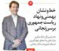
خط و نشان ریاست جمهوری بر سر زنجاری

روحانی در دیدار با وزیر خارجه عربستان گفت که ایران در پی احقاق حقوق خود است و محکم و پابرجا ایستاده‌ایم.