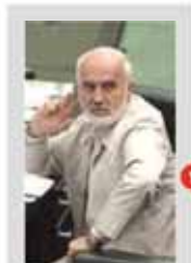
احمدی نژاد از ایدئولوژیست‌های جمهوری اسلامی است. او در جریان انتخابات ریاست جمهوری ۱۳۸۸، به عنوان یکی از نامزدها شرکت کرد.

وزیر امور خارجه گفت که عربستان باید واقع بین باشد و با طرفین گفتگو کند. ظریف در دیدار با وزیر امور خارجه عربستان گفت که ایران در پی صلح است و هیچ هدفی ندارد.