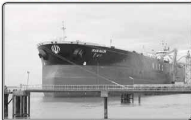
An Iranian oil tanker.

that the firm is privately owned by Iranian pension funds. It has denied any links with the Iranian government or with the Islamic Revolution Guards Corps. A copy of an EU letter to the NITC's lawyers said the EU disagreed with their arguments that the NITC did not provide financial support to the government of Iran and therefore should not be sanctioned. "You acknowledge that NITC's shareholders are entities providing pensions and other social benefits, and social security is a responsibility of the Iranian government," the letter said. The EU had therefore decided to include the NITC again on "the list of persons and entities subject to restrictive measures", or sanctions, it said. The sanctions — originally imposed in 2012 over Tehran's nuclear program — prohibited any trade between the EU, its companies and citizens, and the NITC, including the provision of services such as insurance or banking.