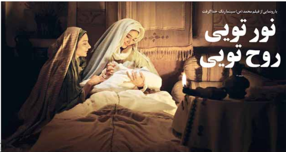
با رونمایی از فیلم محمد (ص) سینما رنگ خدا گرفت

YATAN-8-EMROOZ • Vol. 07 • No. 1316 • Sat. Feb. 14, 2015 • ISSN 2009-2086