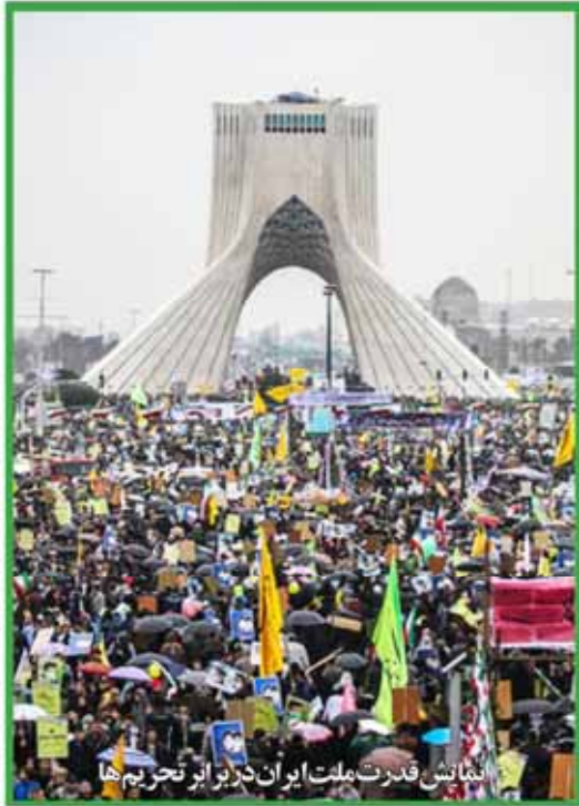
نمایش قدرت ملت ایران در برابر تحریم‌ها