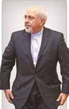
حاضر دکومی تریون در جمع دانش آموزان اشدگان حمایت و هبری از دیپلماسی لیختند

ساعت صف مرشح دراوکران قیمت مسکن رو به افزایش است