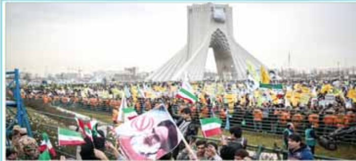
ملت ایران با حضور باشکوه خود بار دیگر پیوندشان با انقلاب عظیم شکوهمند اسلامی و حمایت همیشگی خود از ایران اسلامی را به جهانیان نشان دادند

قطعنامه شورای امنیت برای «خشکاندن منابع مالی» داعش