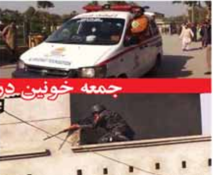
گروه جوانان افغان در مسجد شهبان پشاور پاکستان ۱۹ آذرماه ۱۳۹۳