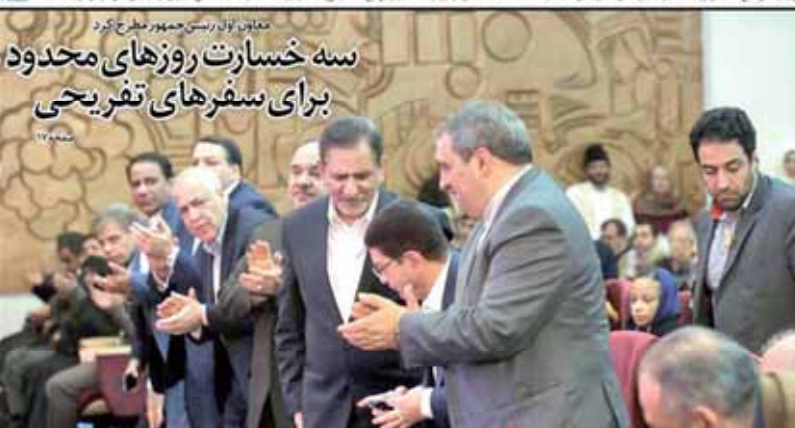
سه خسارت روزهای محدود برای سفرهای تفریحی

به دنبال آشفته‌گی شدید اوضاع اقتصادی در دستور کار قرار گرفت