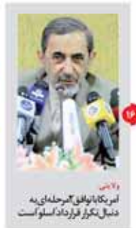
آقای... ذلیل نکور فرزاد اسلو است

رئیس سازمان هدفمندسازی زینین مخالفت با مصوبه تلفیق اطلاعات کرد.