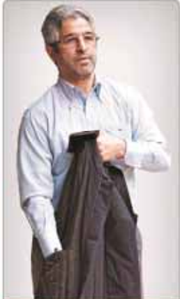
گشت و گونا غلامرضا ظفر بلند چین جای آمریکا را نمی گیرد