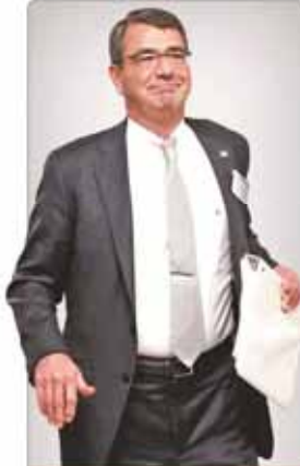
مواضع هشدار وزیر دفاع آمریکا عزت سروسخت در پنتاگون