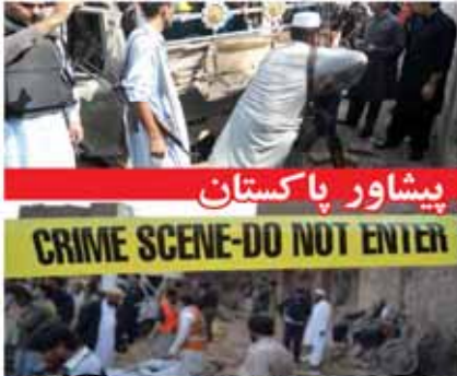
جمعه خونین در پشاور پاکستان

گروه اجنابوی ریزگردها که در روزهای اخیر شاهد آلودگی هوا در بوشهر بوده‌اند، اعلام کردند که این ریزگردها در استان بوشهر رخ داده است. این ریزگردها در استان بوشهر رخ داده است و در روزهای اخیر شاهد آلودگی هوا در بوشهر بوده‌اند. این ریزگردها در استان بوشهر رخ داده است و در روزهای اخیر شاهد آلودگی هوا در بوشهر بوده‌اند. این ریزگردها در استان بوشهر رخ داده است و در روزهای اخیر شاهد آلودگی هوا در بوشهر بوده‌اند.