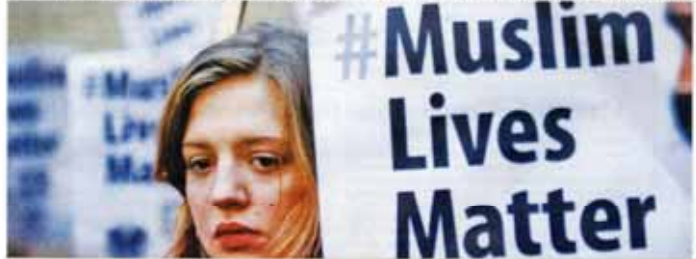
Thousands of mourners attended