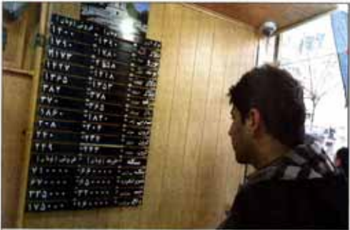
باید ابلخ محدودیت‌های جدید اوزی: صرافي‌های مجاز اعلام شدند