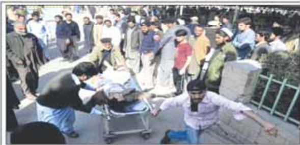
ده‌ها کشته و زخمی در حمله تروریستی به مسجد شیعیان پشاور

وال استریت ژورنال اعلام کرد که ائتلافی از شرکت‌های اروپایی برای بازگشت به بازار ایران تشکیل داده‌اند. این ائتلاف شامل شرکت‌های اروپایی و آمریکایی می‌شود که قصد دارند با سرمایه‌گذاری در بازار ایران، سودهای کلانی را کسب کنند.