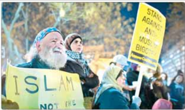
محکومیت گسترده قتل ۳ دانشجوی مسلمان در کارولینای آمریکا