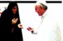
Iranian vice president meets Pope 111

12 Pages Price 5000 Rials 36th year NO.12285 Saturday FEBRUARY 14 2015 Bahman 25 1393 Rabi' al-Thani 24 1436