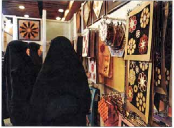
شهر دار تهران در حوزه اقتصاد مقاومتی پیش از اینکه حرف از تولید ملی

پرداخت یارانه نقدی و رقم پرداختی بار دیگر به کمیسیون تلفیق ارجاع شد