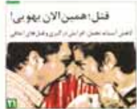
پروژه فرهنگی اجتماعی سازمان آریانا - ۱۳۹۳ - ۱۳۹۲ - ۱۳۷۲