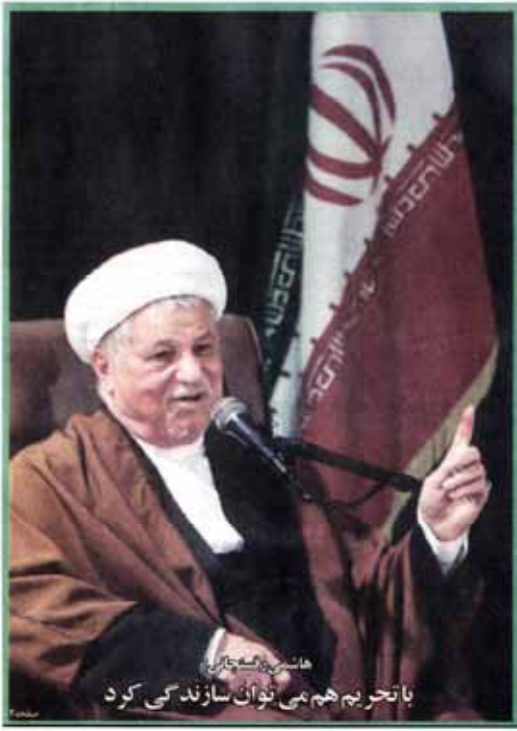
هانسین سکاچانی با تحریم هم نمی توان سازندگی کرد

چهارشنبه ۱۳ اسفند ۱۳۹۳ ۹ ماهی اول ۱۳۹۳ ۲۱۵ مارس ۲۰۱۵ سال سیزدهم شماره ۲۱۰ صفحه ۱۲ تولمان ۱۰۰۰