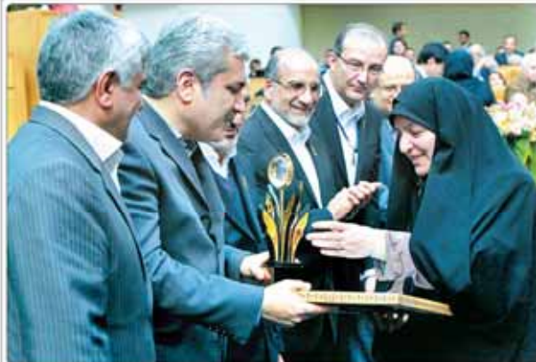
معرفی برگزیدگان بیست و هشتمین جشنواره بین‌المللی خوارزمی

ایران با صداقت وارد مذاکره شده است و تا دستیابی به حقوق هسته‌ای خود به این مذاکرات ادامه خواهد داد