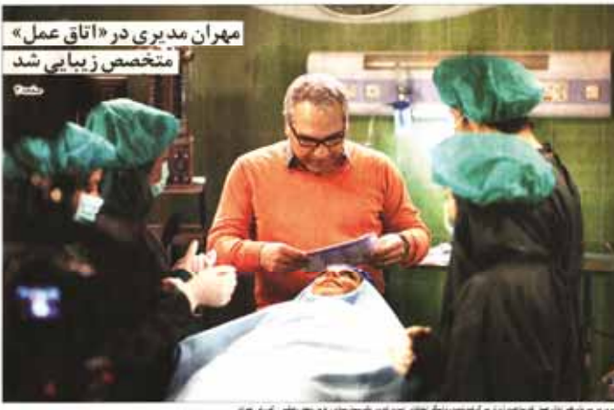
پروژه فرهنگی اجتماعی سازمان آریانا - ۱۳۹۳ - ۱۳۹۲ - ۱۳۷۲