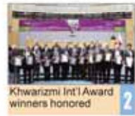
Kiwarizmi Int'l Award winners honored

Number: 5020 • Wednesday March 4, 2015 • Esfand 13, 1393 • Jamadi al-Awwal 13, 1436 • Price 5,000 Rials • 12 Pages • www.irandailyonline.ir