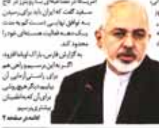
پروژه فرهنگی اجتماعی سازمان آریانا - ۱۳۹۳ - ۱۳۹۲ - ۱۳۷۲

ظریف: تسلیم زیاد خواهی‌ها و مواضع غیر منطقی طرف مقابل نمی‌شود گفت‌وگوهایی بین نمایندگان ایران و سوئیس در زمینه مذاکره در سوئیس در جریان است. ظریف گفت: ما هیچگاه تسلیم مواضع غیر منطقی طرف مقابل نمی‌شویم. او افزود: ما در مذاکرات ما با سوئیس، مواضع منطقی و منصفانه را دنبال می‌کنیم.