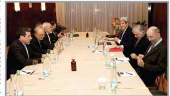
وعلى الصعيد النووي الإيراني الفخري... وزير الخارجية الإيراني محمد ظريف...

المفاوضات تهدف حل النقاط الخلافية في وجهات النظر حول النووي الإيراني