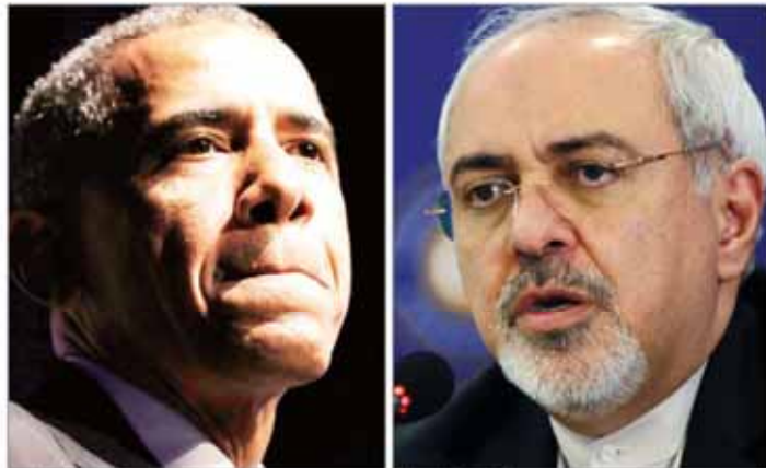
Barack Obama Mohammad Javad Zarif