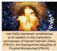
Iran Daily expresses condolences to its readers on the martyrdom anniversary of Hazrat Fatemeh Zahra (PELH), the distinguished daughter of Prophet Muhammad (PEHU)

The Zionist leader addressed U.S. Congress on Tuesday as part of his bid to torpedo the nuclear talks. "He's trying to, and I don't think trying to create tension and conflict helps anyone," Zarif told CNN outside talks. In his remarks in Montreal, carried by the official IRNA news agency, he added that Iran "will not yield in the face of excessive demands and the illogical posture of the other party". On Tuesday, Zarif and Kerry returned to the negotiating table for a second day of talks which are due to continue until Wednesday afternoon, when the top U.S. diplomat will be