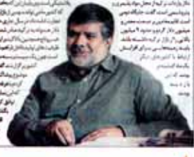
کارگروه مدیریت واردات در وزارت صنعت تشکیل شد

صادرات ۱,۲ میلیارد دلاری ایران به ترکیه رئیس سازمان مدیریت و برنامه ریزی ایران، هانسین سکاچانی، در جلسه هیئت مدیره و کمیته اقتصادی و بازرگانی سازمان، با اشاره به افزایش صادرات غیر نفتی ایران به ترکیه، اظهار داشت: «صادرات ایران به ترکیه در سال ۱۳۹۳ به میزان ۱,۲ میلیارد دلار افزایش یافته است. این امر نشان دهنده روند رو به رشد تجارت دوجانبه است. همچنین، او به موضوع تحریمات بین المللی و تأثیر آن بر اقتصاد ایران اشاره کرد و تأکید کرد که با تحریمات سازندگی امکان ندارد.