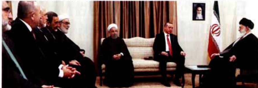
Turkish President Recep Tayyip Erdogan meets Leader of the Islamic Revolution Ayatollah Seyyed Ali Khamenei in Tehran on Tuesday.

Leader of the Islamic Revolution Ayatollah Seyyed Ali Khamenei on Tuesday said the major developments emanating from the general Islamic awakening "is the real cause of anxiety of hostile powers." In a meeting with the visiting Turkish President Recep Tayyip Erdogan in Tehran, the Leader said: "Today the Americans and Zionists are happy about the internal discord in some Islamic states. A practical solution to these problems depends on cooperation among Muslim to the crisis is that foreign attacks and interference against the people of Yemen must stop." He stressed that it is up to the Yemense to decide their own future. Details of the meeting between the Leader and Erdogan will be published in Financial Tribune of Thursday. Erdogan Visit Focuses on Trade, Regional Developments Turkish President Recep Tayyip Erdogan arrived in Tehran on Tuesday at the head of a delegation comprising of high