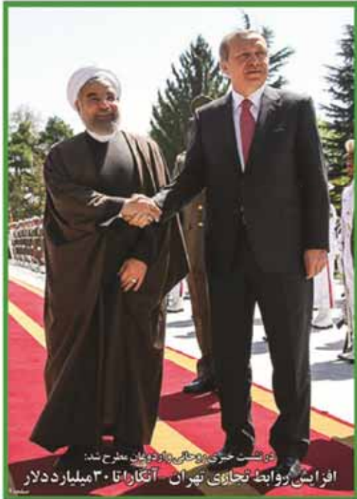
در نشست خبری روحانی با وزیر امور خارجه، روحانی از توافق ۲۸۰ هزار میلیارد دلاری با آمریکا خبر داد.

چهارشنبه ۱۹ فروردین ۱۳۹۴ ۱۸ شماره پستی ۱۳۳۴ A ۲۰۱۵ سال سردار هوشتار و ۲۲۸ صفحه ۱۲ ۱۰۰۰ تومان