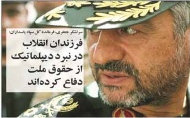
فرزندان انقلاب در نبرد دیپلماتیک از حقوق ملت دفاع کرده اند

بازی شطرنج لوزان، بازی بین المللی است که در سال ۱۹۹۳ در لوزان سوئیس برگزار شد. این بازی به عنوان یکی از مهم ترین رویدادها در دنیای شطرنج شناخته می شود. در این بازی، بازیکنان از سراسر جهان شرکت می کنند و با استفاده از استراتژی های مختلف، سعی می کنند برنده شوند.