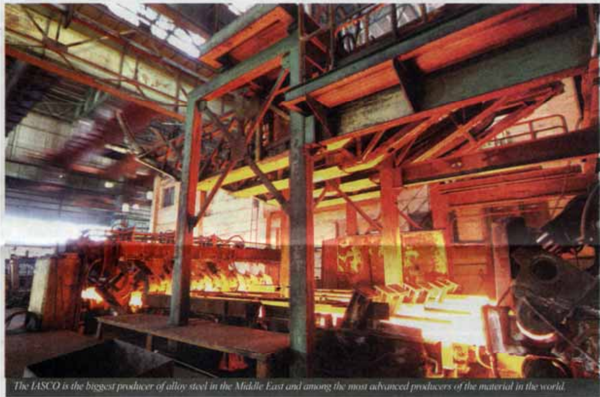
The IASCO is the biggest producer of alloy steel in the Middle East and among the most advanced producers of the material in the world.

The IASCO exported more than 17,000 tons of its products including heat treatable steel, surface-hardened steel, micro alloyed steel, ball bearing, and stainless steel