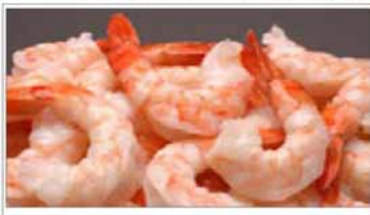
وزیر جهاد کشاورزی خبر داد: صادرات میگوی ایران به اروپا، چین و روسیه