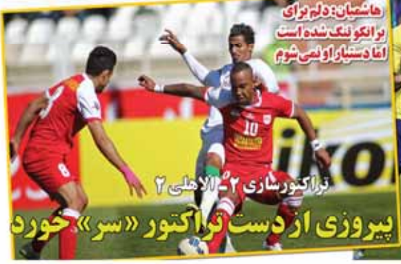
هاشمیان: دلم برای برانکو تنگ شده است اما دستیار او نمی شوم

افشارزاده: به درخواستهای غیر منطقی کرار پاسخ نمی دهیم