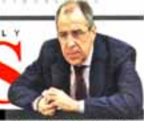
Iran nuclear deal will not create arms race: Russia

12 Pages Price 10000 Rials 36th year NO.12239 Wednesday APRIL 6, 2015 Fardvardin 19 1394 Amada Al Thant 1h 143h