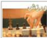
رئیس که فدا سوار را ایستنی اداره می کند؟