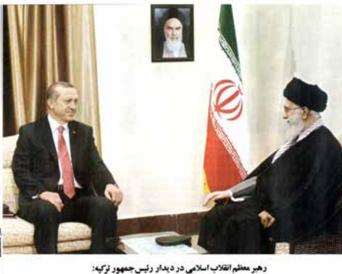
رهبر معظم انقلاب اسلامی در دیدار با رئیس جمهور ترکیه: کشورهای اسلامی از اعتماد به غرب بهره ای نمی برند

کارتخاستن، ترویج ابزارهای کاهش مصرف آب و کاهش قیمت آن بهترین جایگزین برای الگوهای کمترین مصرف است. در این راستا، دولت برنامه جدیدی برای کاهش مصرف آب تدوین کرده است. این برنامه شامل ترویج ابزارهای کاهش مصرف آب و کاهش قیمت آن است.