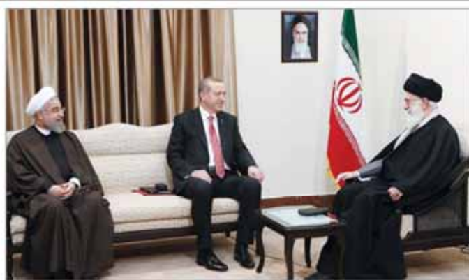
Visiting Turkish President Recep Tayyip Erdogan (C) meets Leader of Islamic Revolution Ayatollah Seyyed Ali Khamenei (R) and President Hassan Rouhani in Tehran on April 7, 2015.