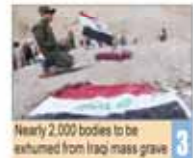
Nearly 2,000 bodies to be exhumed from Iraq mass grave

Number 5032 • Wednesday April 8, 2015 • Farvardin 19, 1394 • Jamadi al-Thani 18, 1436 • Price 5,000 Rials • 12 Pages • www.irandailyonline.ir