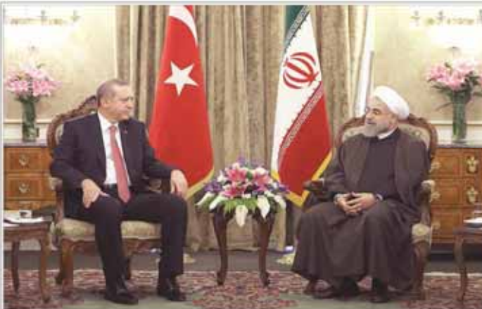
در نشست خبری روحانی و اردوغان مطرح شد: همکاری ایران و ترکیه برای ثبات یمن