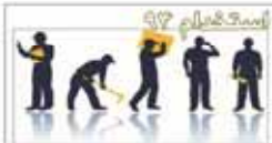
شرکت فولاد سرجان ایرانیان مطراحان ایرانیان پشرو صنعت روانکاری