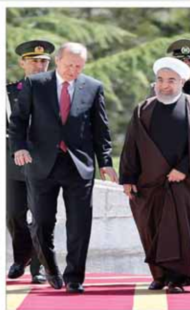
اسلام‌آباد منتظر آغاز مذاکرات پاکستان گاز ایران را دور زد

دیدار اردوغان با رهبر معظم انقلاب عربستان سعودی از تحولات منطقه و وضعیت امنیتی یمن در جریان دیدار با رهبر معظم انقلاب اسلامی در تهران، گفت: این دیدار در راستای تقویت همکاری‌های دو کشور در زمینه‌های مختلف است. وی افزود: این دیدار در راستای تقویت همکاری‌های دو کشور در زمینه‌های مختلف است.