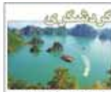
محرمانی روحی از جاذبه های طبیعت و شگفتی های جهان