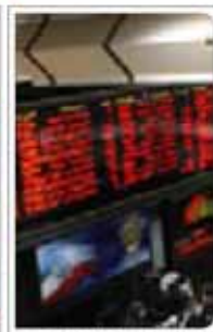
ثبت رکوردهای تاریخی در بورس تهران