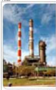
محیط زیست خراسان جنوبی با همکاری شرکت پتروشیمی خراسان

رئیس جمهور از دولت ترکیه برای حمایت‌هایی که همیشه از ایران در موضوع هسته‌ای داشته اند تشکر کرد