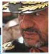
سربلشکر جعفری، مقاومت، ملت‌گزین‌های آمریکا را ناکارآمد ساخت