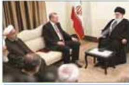
رئیس جمهوری ترکیه با رهبر معظم انقلاب دیدار کرد