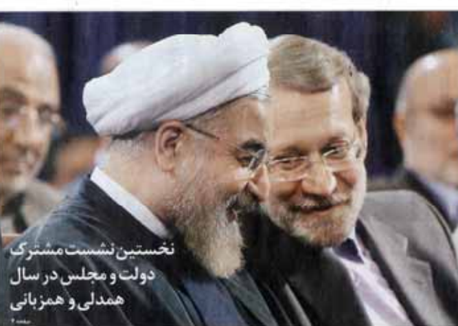
در روز ولیده امروز جام جم می‌خوانیم

رتبه‌بندی استان‌ها از نظر امنیت غذایی بر اساس سه معیار اصلی انجام شد: توان اقتصادی، سلامت غذا و دسترسی به غذای کافی. استان تهران در رتبه اول قرار گرفت.