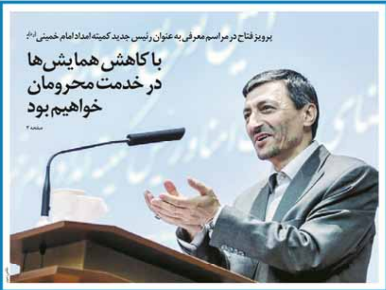
پرویز فتح در مراسم معرفی به عنوان رئیس جدید کمیته امداد امام خمینی (ره)

با کاهش همایش‌ها در خدمت محرومان خواهیم بود