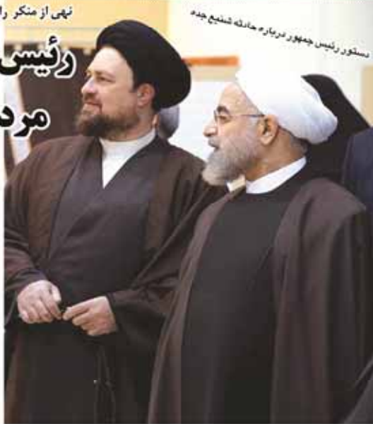
رئیس‌جمهور دربار به حاکمیت شایع جده

هاشمی: حجاب اهمیت دارد اما نباید حقوق ضایع شده مردم را فراموش کنیم فرمانده کل سپاه: باید ابهامات در مورد رفع تحریم‌ها شفاف شود معاون رئیس‌جمهور برای جلوگیری از رانت اطلاعاتی، اطلاعات مذاکرات مطرح نمی‌شود قاپیوس: تحریم‌ها به شرط اجرای تعهدات از سوی ایران، لغو خواهد شد