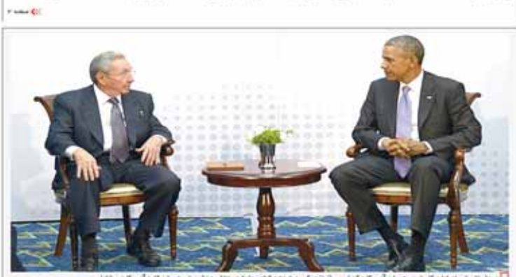
دیدار تریپن، اوباما و کسترو رهبران آمریکا و کوبا پس از نزدیک به ۶ دهه قطع روابط در منطقه نشست رهبران قاره آمریکا در واکها

سعود الفیصل: در پهن در جنگ با ایران ایستیم