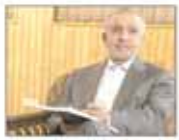
سی سال با دانشگاه آزاد اسلامی این نشست انجمنیه دانشکده های جهان اسلام شورای امرای اعلامی شرکتها شعبه ۲ است علمی

انتشار کلید استعداد تحصیلی و زبان عمومی آزمون دکتری ۹۴