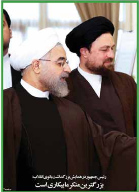
رئیس جمهور در همایش بزرگداشت بانوی انقلاب بزرگترین هنرمند ماینگاری است