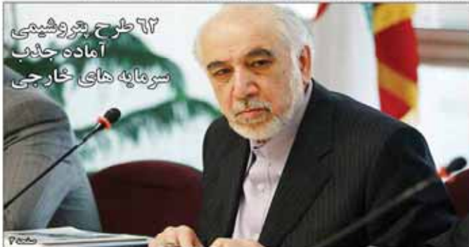
مدیرعامل بانک ملی اعلام کرد

وصول و تعیین تکلیف ۶۰ هزار میلیارد ریال از معوقات بانک ملی