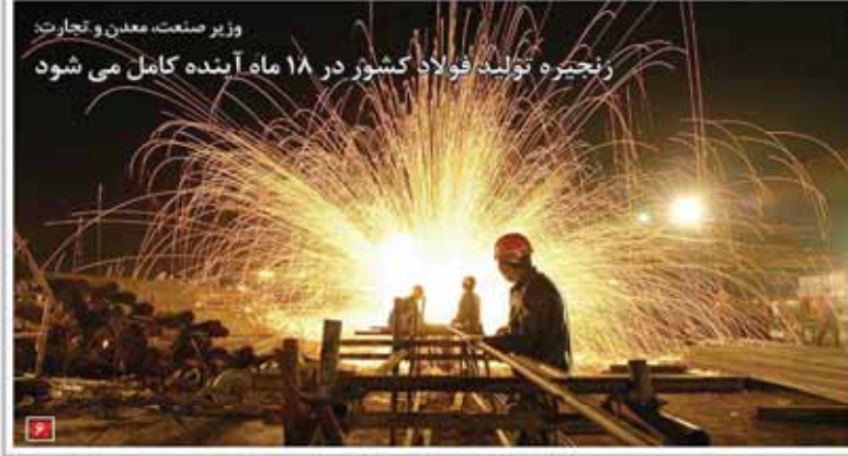
وزیر صنعت، معدن و تجارت: زنجیره تولید فولاد کشور در ۱۸ ماه آینده کامل می‌شود

معاون وزیر صنعت، معدن و تجارت گفت: «کتابت ۷ میلیارد دلاری برای واحدهای تولیدی و صنعتی» و «این کتابت به منظور حمایت از تولید داخلی است» و «این کتابت به منظور حمایت از تولید داخلی است».