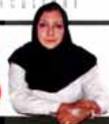
UNESCO awards Iranian female scientist

12 Pages Price 10000 Rials 38th year NO.12243 Monday APRIL 13 2015 Farvardin 24 1394 Jamadi M Thani 23 1436