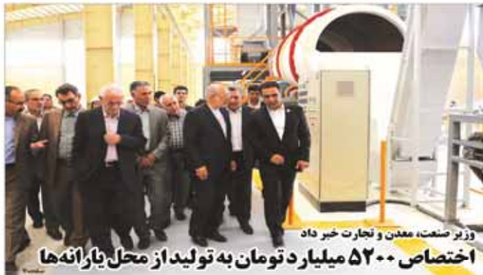
وزیر صنعت، معدن و تجارت خبر داد اختصاص ۵۲۰۰ میلیارد تومان به تولید از محل یارانه‌ها