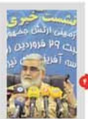
نخستین خبری از رهبر انقلاب چشمه لبثت ۲۹ فروردین از لاله آفرینش لایزال

رئیس‌جمهور آمریکا اعلام کرد که تحریم‌های اقتصادی علیه ایران را به تدریج برداشته می‌شود. او گفت که این اقدام به بهبود روابط بین‌المللی و کاهش تنش‌ها در منطقه خواهد کمک کرد.