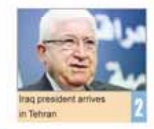
Iraq president arrives in Tehran

The IRCS is a non-political organization and never pays attention to political issues, he said, stressing that the mission of the Iranian aid ship, which is loaded with relief supplies, is purely humanitarian. The Nejat (Rescue) cargo ship, containing 2,500 tons of much-needed aid, including food, medical supplies and tents, left the southern Iranian port city of Bandar Abbas for Yemen on Monday. Last month, Saudi jets bombed the runway at Sanaa airport to prevent an Iranian cargo plane from landing. "The 34th fleet, which is currently in the Gulf of Aden, has special responsibility to protect the Iranian