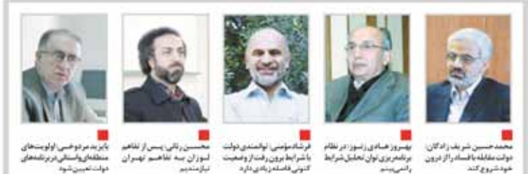
محمدحسین شریفاتادگان، وزیر امور خارجه، امیر امیرلو، وزیر امور خارجه، امیر امیرلو، وزیر امور خارجه...