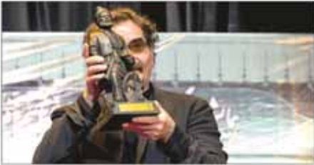
شهرام ناظری در مراسم بزرگداشت فردوسی تا پنج سال پیش مجوز کار بر روی شاهنامه را نداشتیم

تیمبر گل حزب مردم سالاری متعجبم چرا دولت با طرح استانی شدن انتخابات مخالف است برخی مسئولان در هم‌را با عوامل دولت قبل هفتکاری دارند با انتقاد شدید نمایندگان مجلس شورای اسلامی از کربلای معلی طرح سه فوریتی توقف مذاکرات هسته‌ای جعلی از آب درآمد روسیه و چین مانور مشترک در برابر می‌کنند بازگشت همگرایی نظامی بلوک شرق معاون اول رئیس‌جمهور برای رسیدن به دموکراسی؛ احزاب رسمی کشور باید مسئولیت بپذیرند