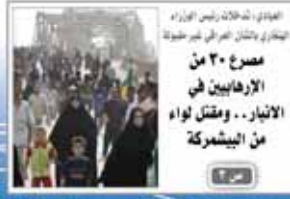
الوفاء: ثلاثة آلاف الفدائي الوفاء: يتظاهر العراقي في طهران مصراع ٣٠ من الإرهابيين في الانبار.. ومقتل لواء من البيشمركة