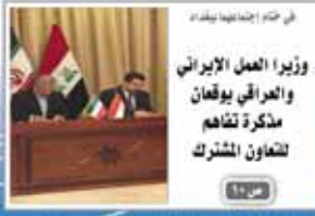
في اجتماع بغداد وزير العمل الإيراني والعراقي يوقعان مذكرة تفاهم لتعاون مشترك