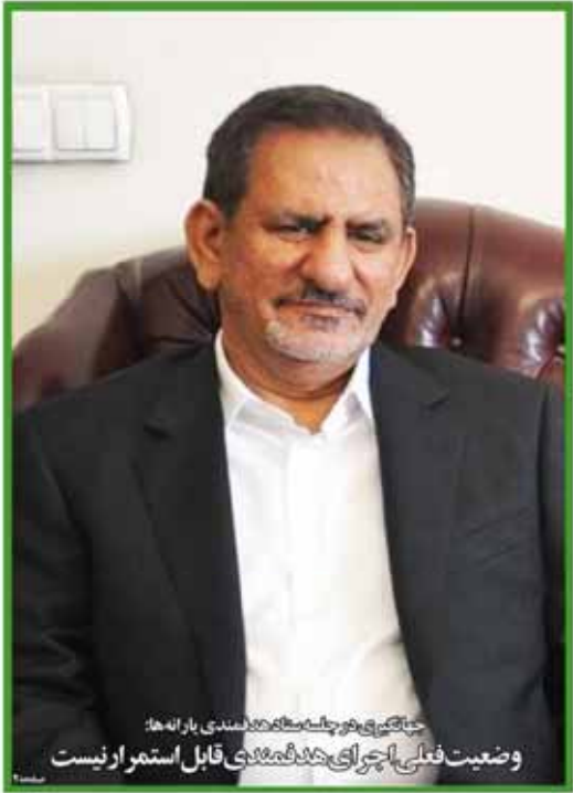
جنگگیری در چانه‌ها و چانه‌های پاره‌ها: وضعیت فعلی اجرای خدمت‌های قابل استمراری نیست

چهارشنبه ۲۳ اردیبهشت ۱۳۹۴ ۲۴ رجب ۱۴۱۵ ۱۲ ص ۱۳۱۵ سال سی و نهم شماره ۳۱۵۲ ۱۲ صفحه ۱۰۰۰ تومان