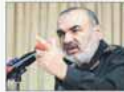
ایران بهشت امن منطقه است