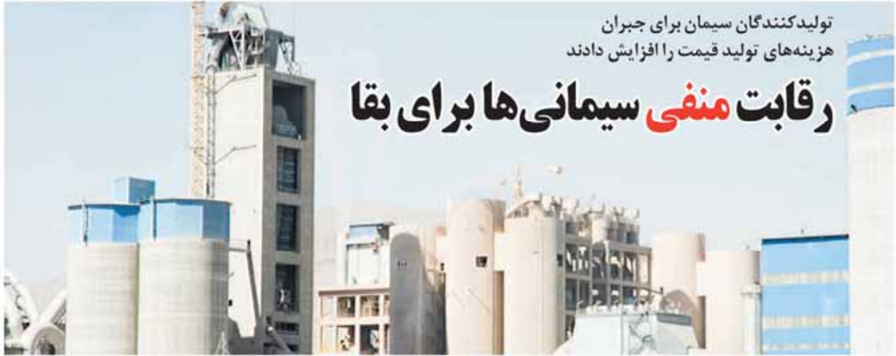
تولیدکنندگان سیمان برای جبران هزینه‌های تولید قیمت را افزایش دادند