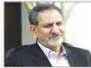
وضعیت فعلی اجرای هدفمندی قابل استمرار نیست

عبدالباری عطوان در آستانه نشست امروز اوپاما و رهبران عرب نوشت