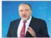
ناتیا هو دروغ می گوید