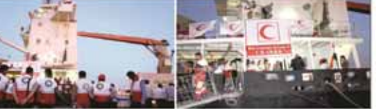
حرکت کشتی نجات ایران در آب‌های آزاد به سمت یمن

تهران در سوگ شاعرش محمدعلی سپانلو درگذشت محمدعلی سپانلو که به‌عنوان یکی از بزرگان ادبیات معاصر ایران شناخته می‌شد، در روز شنبه ۲۳ اردیبهشت ۱۳۹۴ در سن ۸۰ سالگی درگذشت.