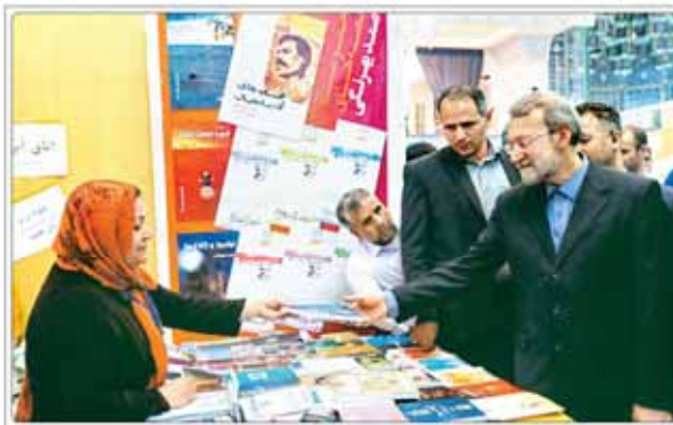
رئیس مجلس شورای اسلامی در بازدید از نمایشگاه کتاب

اوباما با درخواست رهبران شورای همکاری خلیج فارس برای امضای پیمان دفاعی با آمریکا مخالفت کرد