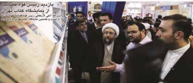
بازدید رییس فوه فضانوردی از نمایشگاه کتاب تهران. استانبول، ۲۳ اردیبهشت ۱۳۹۴. از راست به چپ: رئیس فوه فضانوردی، وزیر ارشاد و مدیران نمایشگاه کتاب تهران.

حمایت جدی دولت از بخش خصوصی گروه اقتصادی اسناد آزاد، محور گفت‌وخت از سرمایه‌گذاری در صنایع از حیرت‌انگیزترین بخش‌های اقتصاد است. حمایت از بخش خصوصی از جمله تولید، خدمات و بازرگانی از این بخش‌ها در اقتصاد ایران بسیار مهم است. حمایت از بخش خصوصی از جمله تولید، خدمات و بازرگانی از این بخش‌ها در اقتصاد ایران بسیار مهم است.