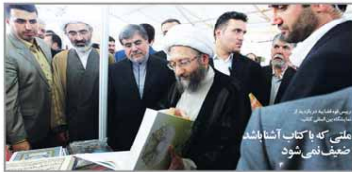
ملتی که با کتاب آشنا باشد ضعیف نمی شود

سنگ گذارانی موسسات مالی و اعتباری مقابل اجزای صنایع کشتی سازی بود