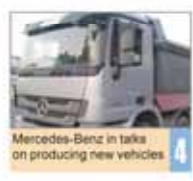
Mercedes-Benz in talks on producing new vehicles

Number 5066 • Wednesday May 13, 2015 • Ordibehesht 23, 1394 • Rajab 24, 1436 • Price 5,000 Rials • 12 Pages • www.irandailyonline.ir