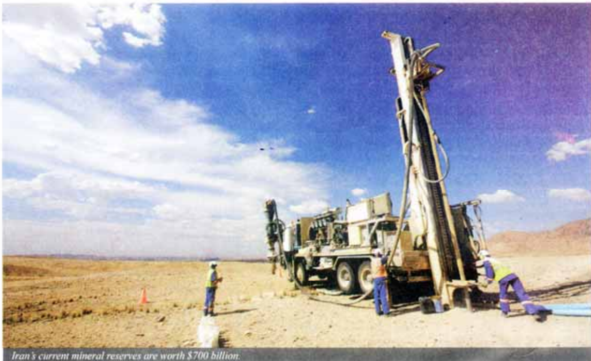
Iran's current mineral reserves are worth $700 billion.