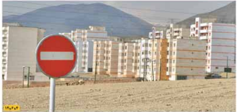
تحلیل‌ها و گزارش‌های متنوع «فرصت امروز» درباره

جایگاه استانداردسازی بررسی می‌شود نقش حیاتی کیفیت در رشد اقتصاد