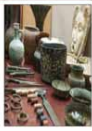
کشف ۲۰۰۰ تاشیء تاریخی در ۲ ماه ابتدایی سال