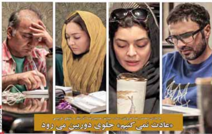
«عادت نمی کنیم» جلوی دوربین می رود

داوران فیلمهای کوتاه اعلام شد سه فیلم ایرانی در بخش بین الملل جشنواره شهر ری ادای احترام سازندگان سریال «معمای شاه» به زنده یاد عبداللہی