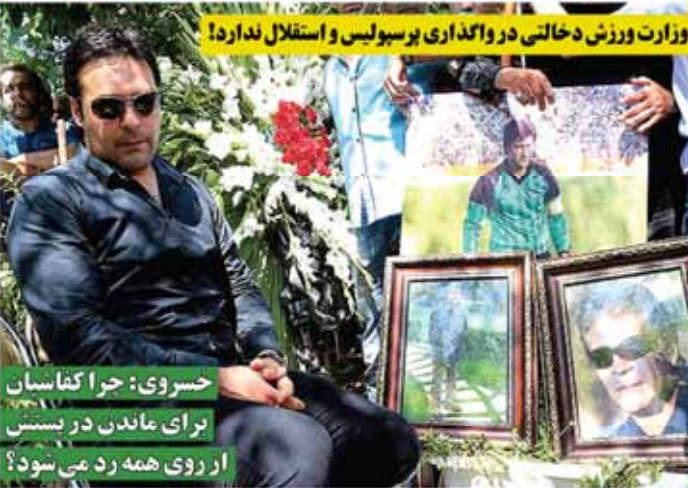
حسروی: چرا کفاشیان برای ماندن در بستن از روی همه رد می شود؟

حسن زاده: رأی پرونده دربی و اتفاقات تبریز امروز با فردا اعلام می شود