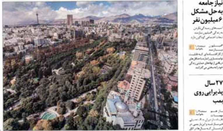
تهران: قطب نوظهور شهرهای جهانی | شهرداران بوسان، تلیس و سوچی هم‌مکان تهران، شهرداران لاهه و استرنا در راه ایران

هزاران آپاره مسلمان روهینگیزی در آسایش خیابان لندن می‌مانند و تا اینکه سرگردانند.