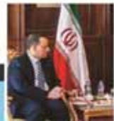
جز گروه‌های یعنی هیچ کشوری نباید در گفت‌وگوهای صلح حاضر باشد.