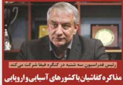
رئیس فدراسیون سه شنبه در کنفره فیفا شرکت می کند مذاکره کفایشان با کشورهای آسیایی و اروپایی

اولین سالگرد درگذشت پهلوان سلیمانی برگزار شد