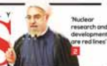
Nuclear research and development are red lines

12 Pages Price 10000 Rials 37th year No.12275 Saturday MAY 23, 2015 Khordad 2, 1394 She'aban 4, 1436