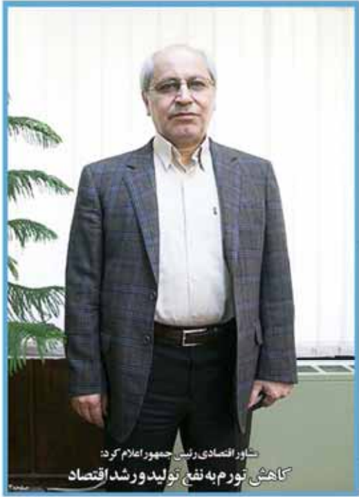
شاگرد اقتصادی و رئیس جمهور اعلام کرد: کاهش تورم به نفع تولید و رشد اقتصاد

شماره ۲ خرداد ۱۳۹۴ ۲۲ تیرماه ۱۳۹۴ سال سی و نهم شماره ۲۱۴۴ ۱۲ صفحه ۱۰۰۰ تومان