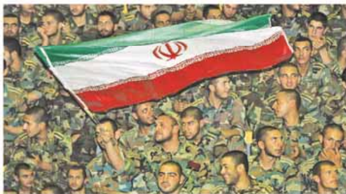
The NAAJ awarded silver soldiers on Saturday in the Serevakh Muzeh Ali Akbar (Young Soldier) Festival held in the weight-lifting stadium of the Azadi sports complex.