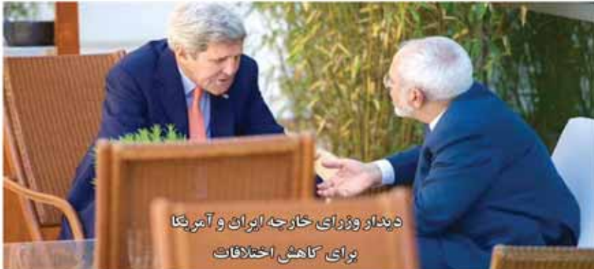
دیدار و وزیر خارجه ایران و آمریکا برای کاهش اختلافات

مذاکره ایران و آمریکا برای بررسی روند نگارش متن توافق جامع