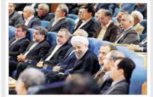
اعضای شورای عالی انقلاب فرهنگی از کمیته انتخاب روسای دانشگاه‌ها می‌گویند