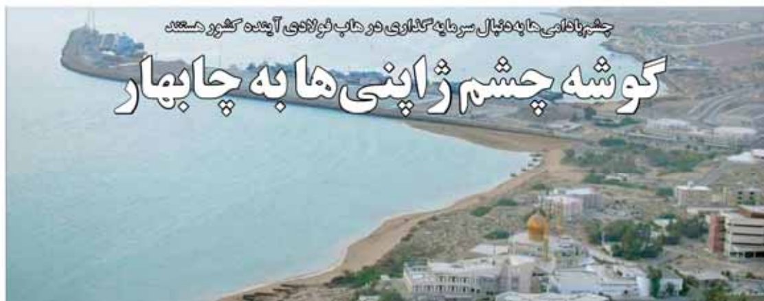
چشم‌اندازی دایره‌فعال سرمایه‌گذاری در هاب فولادی آینده کشور