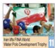
Iran Wins FINA World Water Polo Development Trophy 11

Number 5080 • Sunday May 31, 2015 • Khordad 10, 1394 • Sha'ban 12, 1436 • Price 5,000 Rials • 12 Pages • www.irandailyonline.ir