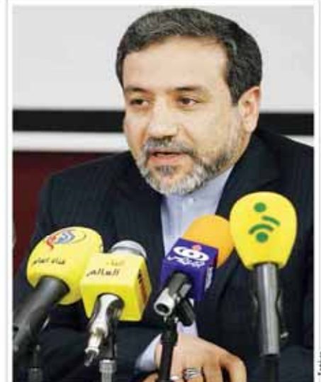
مصاحبه با دانشمندان و بازرسی از مراکز نظامی کاملاً منتفی است

رئیس کمیته آلودگی هوا و تغییرات اقلیم وزارت بهداشت، افزایش آمار زنان باردار و کودکان در میان کارکن خوابگاهها را نگران کننده دانست. وی افزود که این موضوع نیازمند بررسی دقیق تر و اتخاذ تدابیر مناسب است.