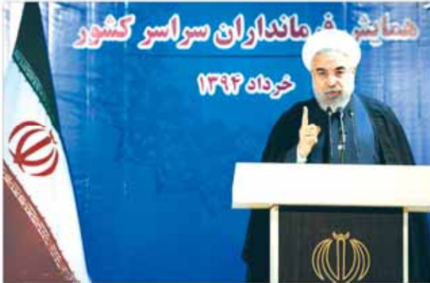
رئیس جمهور از مسئولان استانها، استانداران و فرمانداران سراسر کشور دیدار کرد...