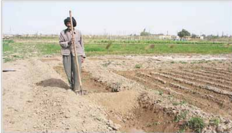
کوک بیکاری از شهرها به روستاها