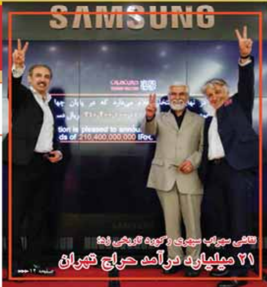
تلفی سرباپ سیری و گروه تاریخی زد؛ ۲۱ میلیارد درآمد حراج تهران

سبب این پدیده، کاهش فرصت های شغلی در بخش های تولیدی و خدماتی است. همچنین، افزایش قیمت های کالاهای اساسی و کاهش قدرت خرید مردم در شهرها، باعث شده است که بسیاری از افراد به روستاها کوچ کنند. این پدیده نیازمند توجه جدی دولت و اتخاذ تدابیر مناسب است.