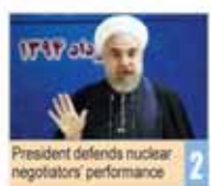
President defends nuclear negotiators' performance 2

8 SPORTS Federer to Face Monfils In Next Round See Page 8