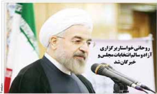
روحانی خواستار برگزاری آزاد و سالم انتخابات مجلس و خبرگان شد