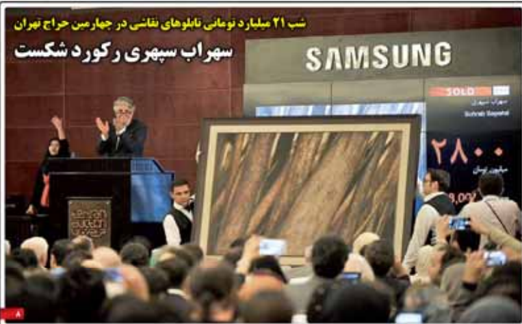
شب ۲۱ میلیارد تومان تابلوهای نقاشی در چهارمین حراج تهران سهراب سپهری رکورد شکست