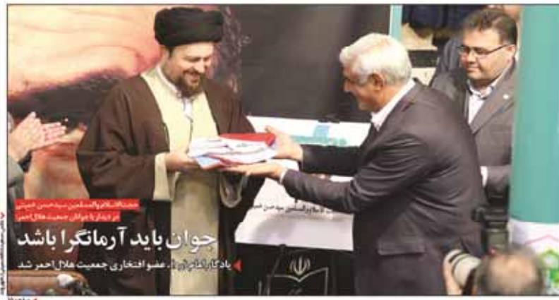
روحانی به سردار مقدم کتاب «سوره الفجر» را تقدیم کرد. در این مراسم، روحانی با لحن بی ادبانه نسبت به سردار مقدم جبهه دیپلماتیک حرف زد.

چه کسی حق دارد با لحن بی ادبانه نسبت به سردار مقدم جبهه دیپلماتیک حرف بزند؟ از کجا این بی ادبی نازل شده؟