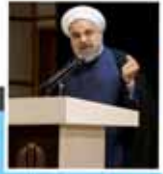
دولت و شهرداریها اجازه رقابت سیاسی انتخاباتی ندارند