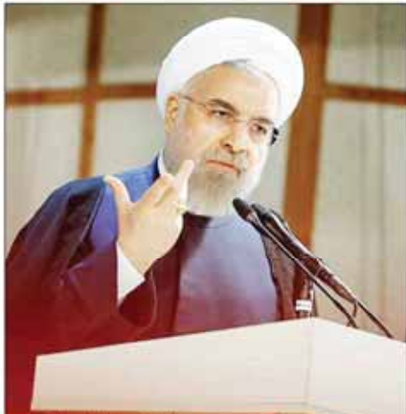
رئیس‌جمهور در حمایت از ماندن سراسر کشور

کسی حق ندارد به سردار دیپلماسی بی ادبی کند همه متخصص مسائل هسته‌ای شده‌اند این چه سزای است که از لبخند مردم می‌تربسند؟ به سردم دروغ نگویید، روزی دروغ‌ها بر ملا می‌نویسند