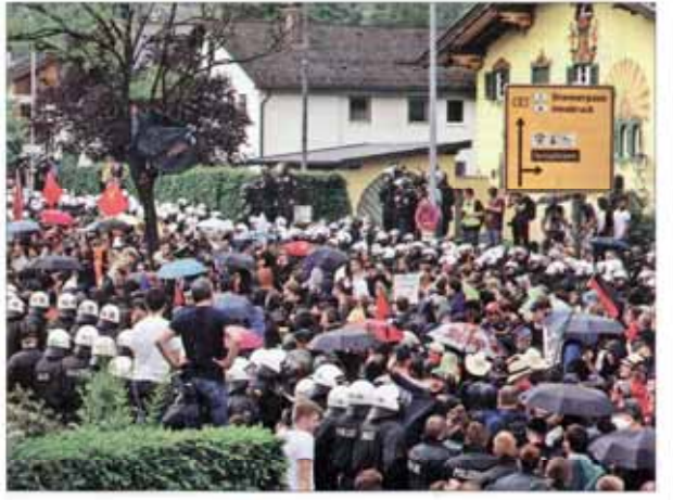
نخست گروه ۷ زیر سایه روسیه | هزاران نفر در اعتراض به نشست گروه ۷ در جنوب آلمان تظاهرات کردند

روحانی: حفظ محیط زیست امر به معروف است رئیس جمهور باید نسبت به طبیعت احساس و طبقه بندی شریعی، اجتماعی، ملی و انسانی داشته باشد باز گشت ضرباهنگ منظم زندگی به قلب پیر شهر برای تعطیلات به منطقه ۱۲ از طرفت‌های فرحان، ترانگی و انتظامی شهر استفاده می‌شود مسکن محرومان، نقطه ضعف طرح جامع دولت