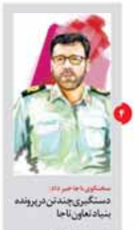
ساعتی با ما خبر داد دستگیری چند تن در پرونده بنیاد لاهان

رئیس‌جمهور در مراسم جایزه ملی محیط‌باز بست، تحریم‌های پایدار از بین ببرد تا مشکل آب خوردن مردم حل شود.