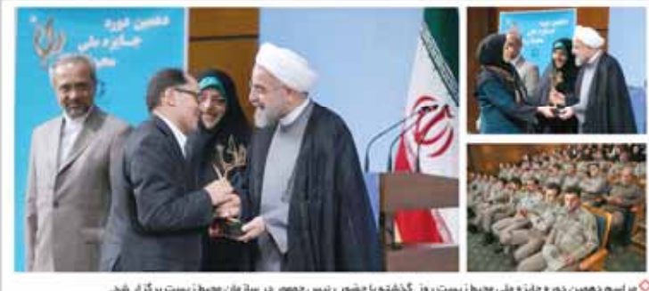
مراسم دهمین دوره جایزه ملی محیط زیست روز گذشته با حضور رئیس جمهور در سازهان محیط زیست برگزار شد.

بیماری های «کلیه» عوارض ناشی از بیماری های