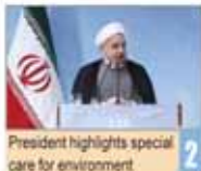
President highlights special care for environment

Rouhani said. On Saturday, Iran's senior nuclear negotiator Abbas Araqchi said the ongoing talks were very difficult and complicated. "It is advancing very slowly." Negotiators in early April agreed on a framework of understanding and set June 30 as a self-imposed deadline for reaching a final deal after missing the previous two deadlines in June and November last year. Meanwhile, Araqchi said Iran will accept a nuclear deal under which United Nations sanctions could be reimposed in the event of non-compliance, so long as Tehran enjoys similar protections. Last week, Western officials were