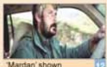
'Mardani' shown in Seattle