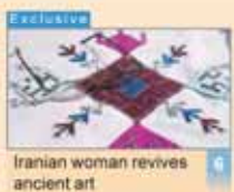
Iranian woman revives ancient art