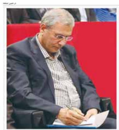
مجلس بیکاری با رشد اقتصادی ۶ درصدی هم درمان نمی شود شکل گیری ۷ میلیون شغل غیر رسمی زیر سایه نرخ بالای بیکاری