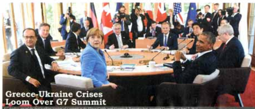
Greece-Ukraine Crises Loom Over G7 Summit

A Credit Line is a promise to provide loans at subsidized rates