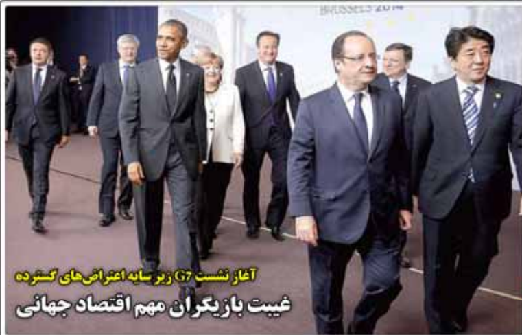
آغاز نشست G7 زیر سایه اعتراض‌های گسترده غیبت باز یکران مهم اقتصاد جهانی