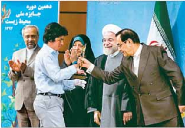
رئیس جمهوری در آیین گرامیداشت هفته محیط زیست در تهران. در این مراسم، رئیس‌جمهور با مسئولان دستگاه‌های اجرایی و فعالان محیط زیست گفت‌وگو کرد.

کناز فقط غیبت یا رعایت نکردن برخی از احکام نیست، یکی از وجوه کناز ظلم در حق طبیعت است