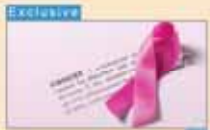
Cancer helpline launched