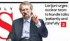
Larjani urges nuclear team to handle talks patiently and carefully

12 Pages Price 10000 Rials 37th year No. 12287 Monday JUNE 8, 2015 Khordad 18, 1394 Sha'aban 20, 1436