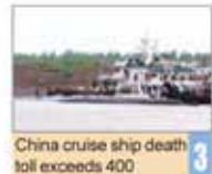
China cruise ship death toll exceeds 400

Number 5085 • Monday June 8, 2015 • Khordad 18, 1394 • Sha'ban 20, 1436 • Price 5,000 Rials • 12 Pages • www.irandailyonline.ir