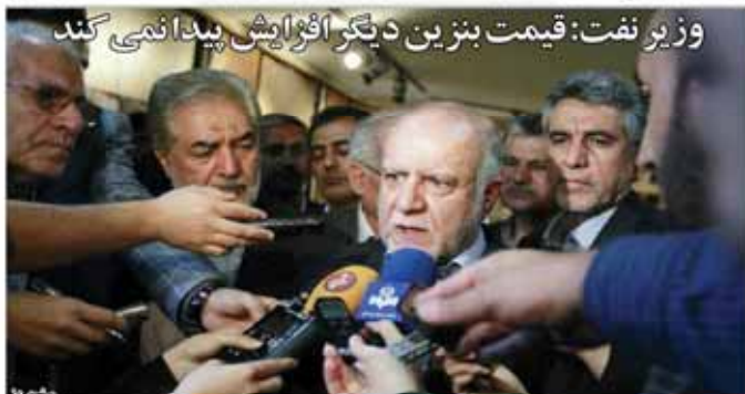
وزیر نفت: قیمت بنزین دیگر افزایش پیدا نمی‌کند