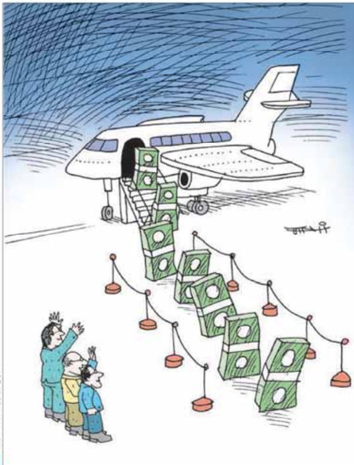
کیوان ذکری - فرصت امروز