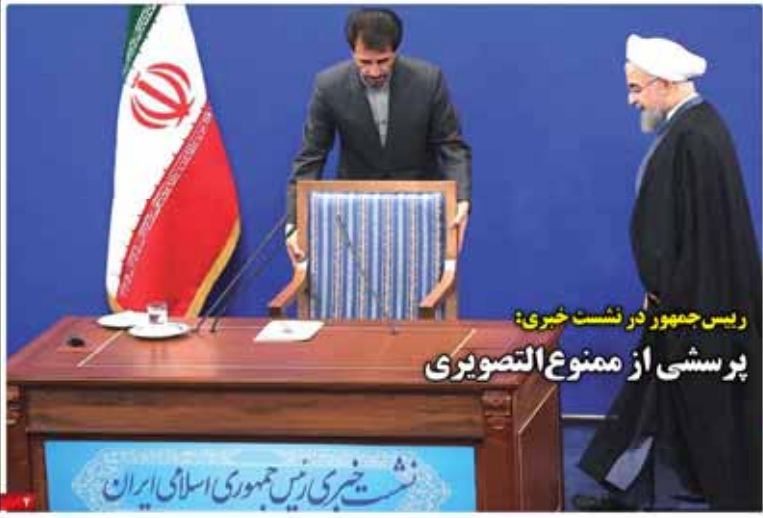
رئیس جمهور در نشست خبری: پرسشی از ممنوع‌التصویری

دو هفته پیش در حالی که رهبر انقلاب از تهران خارج شده بود، رئیس‌جمهور در نشست خبری در تهران اعلام کرد که دولت در حال شناسایی اقشار کم‌درآمد و حذف اقشار ثروتمند است. این اقدام در راستای اجرای سیاست‌های عدالت‌محور دولت است. در این نشست خبری، رئیس‌جمهور به سوالات خبرنگاران در خصوص حذف ثروتمندان و شناسایی اقشار کم‌درآمد پاسخ داد. او تأکید کرد که این اقدام به معنای حذف ثروتمندان نیست، بلکه به معنای شناسایی اقشار کم‌درآمد و کمک به آنهاست. همچنین، او به سوالاتی در خصوص ممنوع‌التصویری پاسخ داد و گفت که این اقدام به معنای حذف تصویر نیست، بلکه به معنای حذف اقشار کم‌درآمد است.