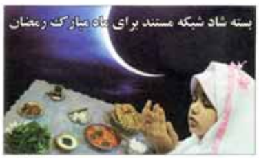
بسته شاد شبکه مستند برای یاد مبارک رمضان