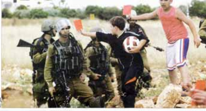
کارت قرمز به رژیم جعلی