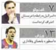
۷... ۱۳۳... دانشگاه امام خمینی انقلاب کرده است با ستاره و پامانی و فانی دانش