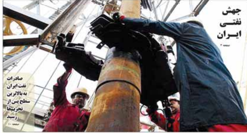
جهش نفتی ایران

وزیر امور خارجه گفت: جامعه بین الملل نباید تنها ناظر این گفتگوهای جمهوری اسلامی ایران و ۵+۱ باشد و لازم است در آن نقش ایفا کند تا به نتیجه برسد. محمد جواد ظریف، در دیدار با جای شان کار قائم مقام وزارت خارجه بعد از سخن تشریح گفتگوهای میان جمهوری اسلامی ایران با گروه ۵+۱ گفت: جامعه بین الملل نباید تنها ناظر این گفتگوها باشد و لازم است در آن نقش ایفا کند تا به نتیجه برسد. ظریف در این دیدار با قائم مقام وزارت خارجه گفت: جمهوری اسلامی ایران و ۵+۱ در حال حاضر در مرحله اول گفتگوها قرار دارند و در این مرحله باید به توافق برسند. رئیس هیئت تحریر و امید عصر نشسته در نشست خبری خود که به مناسبت مذاکره جنابانه سید علی خامنه‌ای در روز ۲۴ خرداد برگزار شد، از آغاز مذاکره و پیروزی ملت ایران در مذاکرات هسته ای مدتی است که خبر می‌دهد.