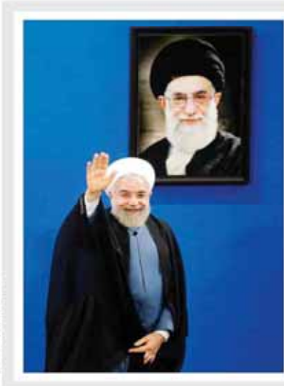
رئیس دانشگاه آزاد اسلامی در سفر به استان خراسان جنوبی تاکید کرد

دوستان! ما در این روزها به این فکر می‌کنیم که دولت یازدهم چه کارنامه‌ای داشته است. در واقع باید بگوییم که این دولت در زمینه‌های مختلف، از جمله اقتصاد، سیاست خارجی، و اصلاحات اجتماعی، اقدامات قابل توجهی انجام داده است. اما آنچه که به نظر من برگ برنده این دولت است، خودجوشی آن است. مردم در این دولت نقش پررنگ‌تری ایفا کرده‌اند و این امر به نفع کشور است.