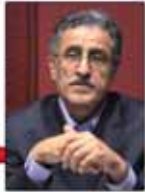
رئیس اتاق بازرگانی تهران در مورد ادعای جهانگردی منشی بر افزایش قدرت خرید: از تورم خیر ندارید!