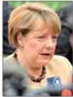
مرکل: یورو قوی به ضرر اقتصاد اروپاست