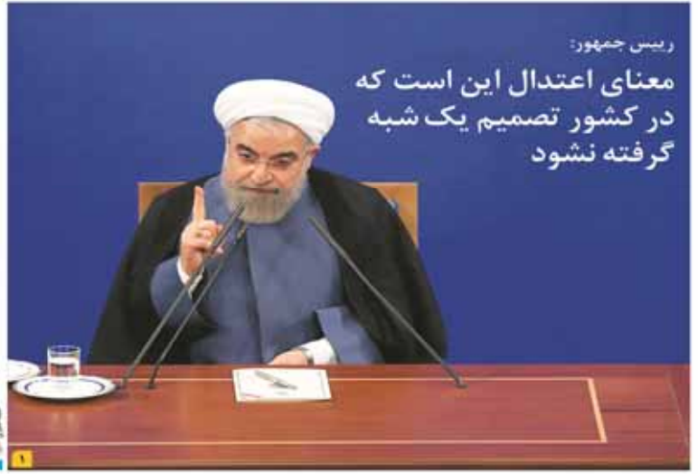
رئیس جمهور: معنای اعتدال این است که در کشور تصمیم یک شبه گرفته نشود

مرگ انرژی در خانه‌های نوساز مسوومای که هیچ‌کس اجراش نمی‌کند در پیوند از تولیدات گسترده مسکن‌ها در طول سال‌های گذشته برای شناخت و اجرای مسکن ۱۹ پروژه ایجابی و تولید مسکن‌ها در کنار آن آنچه در نظر از فضای ناعادلانه بازار رقابت می‌گویند تولید کنندگان لوازم جانبی را بانه‌ای از فضای ناعادلانه بازار رقابت می‌گویند قاجاق؛ آفت تولیدات ایرانی وانت ۲۰۰ میلیارد تومانی ۴ شرکت گلوی فشرده شده صادرات پرافین ایرانی در دستان بخش خصولتی حلقه‌ها تماشاچی بودند شاخص کل روی دوش حقیقی‌ها بالا رفت