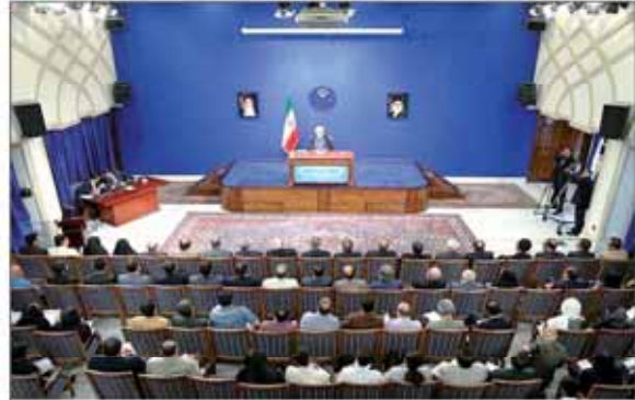
رئیس‌جمهور در کنفرانس خبری

سیاست‌های کلی انتخابات جهت تأیید نهایی تقدیم رهبر انقلاب شد