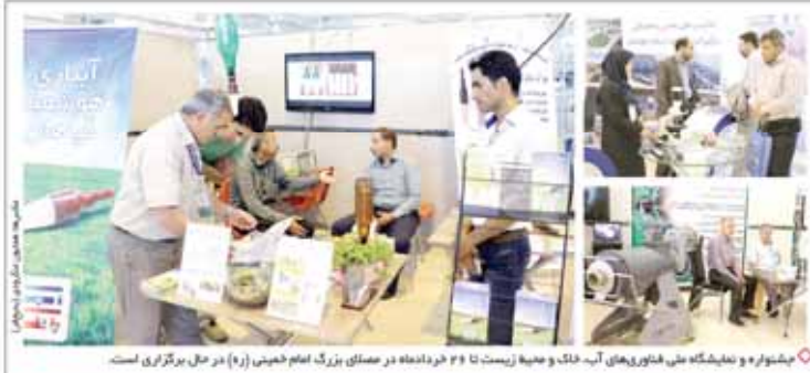
مشاوره و نمایشگاه ملی فناوری‌های آب، خاک و محیط زیست تا ۲۹ خردادماه در صحنای بزرگ امام خمینی (ره) در محل برگزاری است.

ایران‌خانه فرهنگی قانون جدید انتخابات، منشاء آثار مناسی در کشور خواهد بود جزئیات برگزاری ترم تابستانی دانشگاه آزاد اعلام شد رئیس‌مدیر دانشگاه تهران سال ۲۰۱۵ دانشگاه ایرانی در بین دانشگاه‌های برتر آسیا از سوی دولت ابلاغ شد بخشنامه قطع آب مشترکان پرمصرف استان از سوی وزارت نفت ۲۳ میلیون لیتر بنزین یورو ۴ و ۳۵ میلیون لیتر گازوییل یورو ۴ توزیع می‌شود