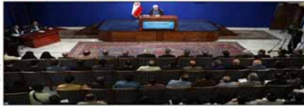
القائد على الصفحة ۷

تنفيذ الاتفاق سيتزامن مع رفع العقوبات الاقتصادية والمالية الضالمة التي فرضت على الشعب الإيراني الدولية والاحادية