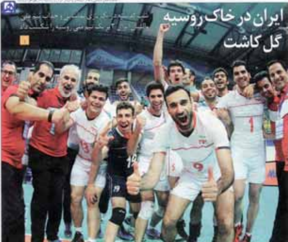
ایران در خاک روسیه گل کاشت

رئیس جمهور در نشست خبری در پاسخ به همشهری اظهار امیدواری کرد قوانین معطل مانده‌ای که به تحریم ارتباط ندارد، به زودی اجرا شود