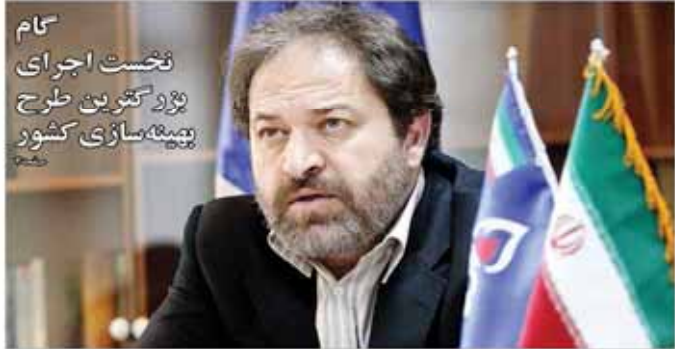
ایوانوویچ از مؤسسان شرکت نفتی اکتا و استانبول خبر داد