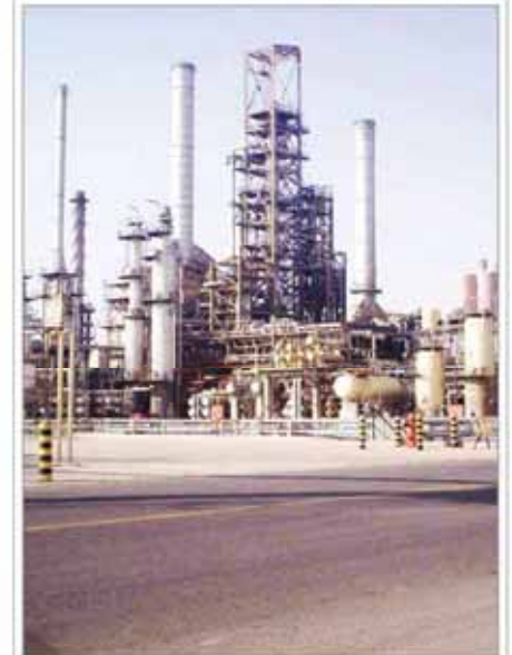
بزرگترین شرکت آمریکایی در راه تهران

رئیس هیئت مدیره شرکت ملی پخش فرآورده‌های نفتی ایران، احداث کارخانه هزار بشکته‌ای تولید سوخت مایع از گاز طبیعی را تأیید کرد. این کارخانه به تولید سوخت مایع برای استفاده در صنایع و حمل‌ونقل می‌پردازد.