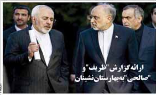
ارائه گزارش "ظریف" و "صالحی" به هیات استان نشینان

دوشنبه ۲۹ تیر ۱۳۹۴ • شماره ۱۱۳۵ • صفحه ۲۰ • تهران • ۱۳۹۴ • شماره ۱۱۳۵ • صفحه ۲۰ • تهران