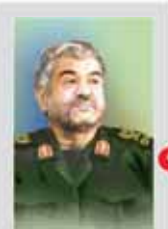
رئیس دفتر سیاسی حماس در دیدار با پادشاه سعودی

امروز رئیس دفتر سیاسی حماس در دیدار با پادشاه سعودی، حماس را به عنوان یک گروه مبارز اسلامی معرفی کرد و گفت که این گروه در برابر دشمنان خارجی و داخلی ایستادگی خواهد کرد.