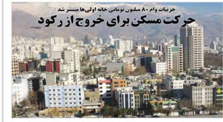
حزبیت وام ۸۰ میلیون تومانی خانه اولی‌ها منتشر شد

صنایع کشور در پساتحریم با چالش‌های متعددی مواجه خواهد بود. کاهش قیمت نفت منجر به کاهش درآمدهای دولت و کاهش بودجه‌های دولتی می‌شود. همچنین، کاهش ارزش ریال منجر به افزایش هزینه‌های واردات مواد اولیه و ماشین‌آلات می‌شود. با این حال، صنایع داخلی می‌توانند با سرمایه‌گذاری و نوآوری در بخش‌های مختلف، توانایی رقابت در بازارهای جهانی را داشته باشند.