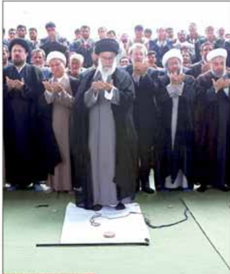
رهبر معظم انقلاب در دیدار با مسئولان