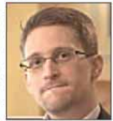
خود را از دست خواهند داد.

ایستا: یک سناتور جمهوریخواه آمریکا از آژانس امنیت ملی این کشور خواست ادوارد اسنودن، افشاگر اطلاعات این سازمان را در ملاعام به دار بیاویزد! «ساکسی چمبلیس» طی سخنانی در دانشگاه جورجیا در پاسخ به سوالی درباره حک شدن دفتر منابع انسانی دولت گفت: در نتیجه حک شدن دفتر منابع انسانی دولت که مرتبط با اقدامات اسنودن است آمریکایی‌ها جان