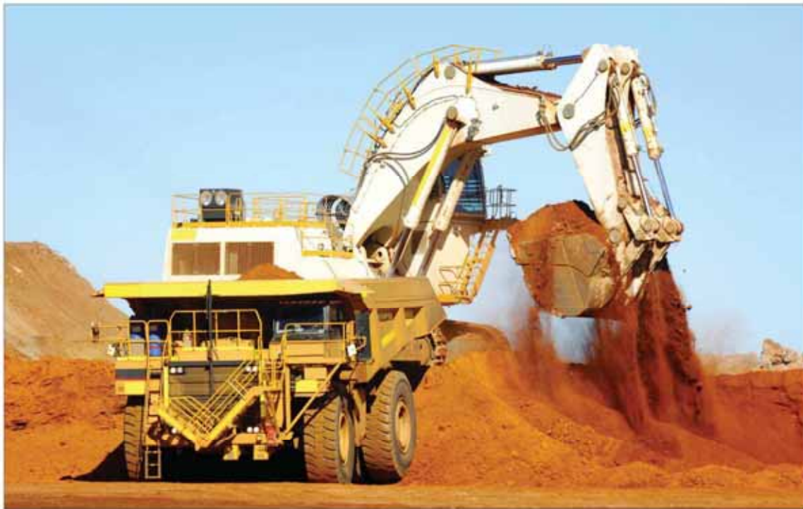
نگاره: نازگه قبل

یکی دیگر از پرونده‌های جنجالی حوزه معدن به موضوع رانت خواری در واگذاری معادن سنگ آهن در استان مرکزی و شهر محلات باز می‌گشت که از سوی حجت الاسلام علیرضا سلیمی، نماینده مردم محلات و دلبران برای اولین بار اواخر سال ۹۲ مطرح شد