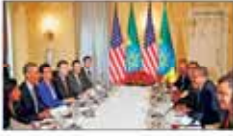
مقابله با الشباب و حقوق بشر محور دیدار اوپاما و نخست وزیر ایوبی