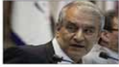
جزئیات تفاهم نامه فدراسیون فوتبال و صداوسیما از زبان کفایشان