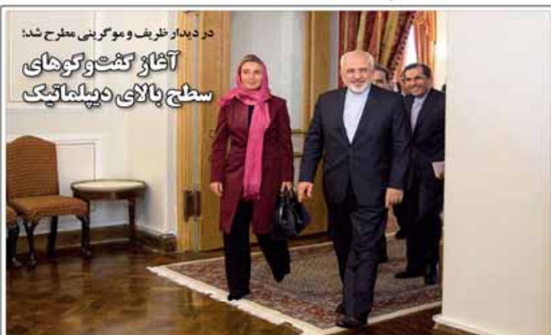
در دیدار ظریف و موگرینی مطرح شد: