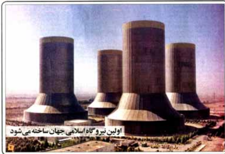
اولین نیروگاه اسلامی جهان ساخته می‌شود