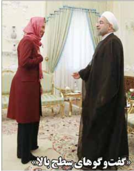
«گفت و گوهای سطح بالا»

سال پست‌نویس دوره جدید شماره ۲۶۶ • پای ۱۵۱۸ • صفحه ۲۲ • قیمت ۱۰۰۰ تومان • www.snnnews.ir • www.amionline.ir