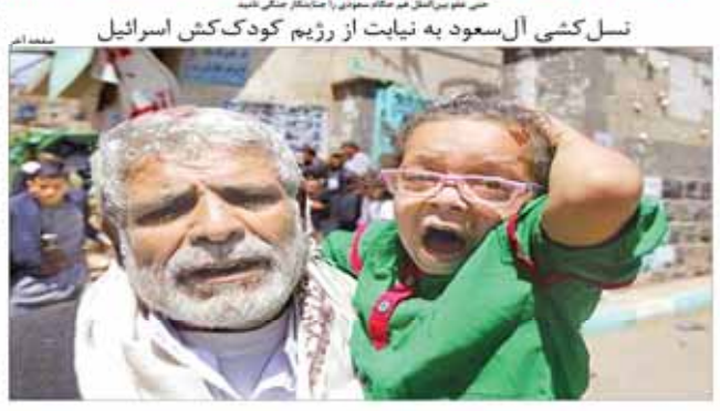
نسل کشی آل سعود به نیابت از رژیم کودک کش اسرائیل

کری: محدودیت های موشکی در حالی وارد قطعنامه شورای امنیت شد که قرار بود این قطعنامه فقط هسته ای باشد