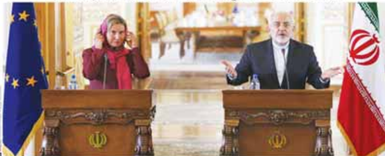
Bill Marjan Colgate

TEHRAN — The European Union foreign policy chief said on Tuesday that the landmark agreement over Iran's nuclear program will have great benefits for the world which goes much beyond a mere resolution of the nuclear dispute between Iran and the West.