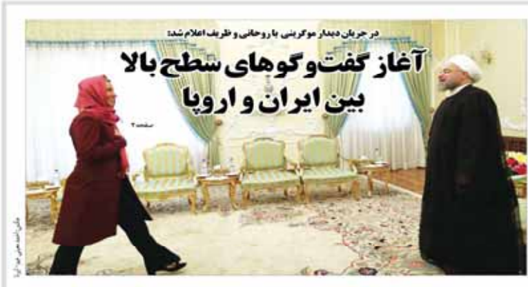
در جریان دیدار توکرینی با روحانی و ظریف اعلام شد: آغاز گفت‌وگوهای سطح بالا بین ایران و اروپا