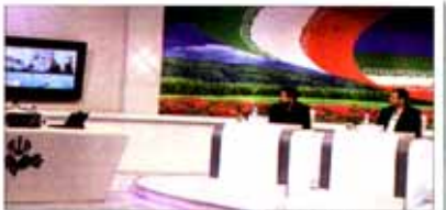
مناظره‌های تلویزیونی در انتظار مسئولان پاسخگو