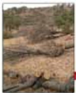
رئیس انجمن جنگلیانی از بیابان شدن جنگل‌ها می‌گوید مرگ حجم سبز