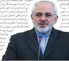
آناه پاش سیف به بانک‌های بی حضور در اقتصاد ایران اخطار

دور جدید مذاکرات ایران و اروپا در حالی که «گروه‌های سه‌جانبه» توافق نهایی بر سر بندهای اصلی مذاکرات را به دست آورده‌اند، با چالش‌های متعددی روبرو شده است. در حالی که مذاکرات در سطح دولتی در حال پیشرفت است، اما در سطح اقتصادی و اجتماعی، چالش‌های جدی وجود دارد. به نظر می‌رسد که امسال سال سختی برای اقتصاد ایران خواهد بود. با آغاز دور جدید مذاکرات، ایران و اروپا در حال مذاکره بر سر بندهای اصلی توافق هستند. این مذاکرات شامل مواردی مانند رفع تحریمات، دسترسی به منابع مالی بین‌المللی و همکاری در زمینه انرژی و صنعت است. با این حال، چالش‌های متعددی در راه است. از جمله، نگرانی‌ها در مورد تأثیر مذاکرات بر اقتصاد ایران، نگرانی‌ها در مورد تأثیر مذاکرات بر روابط ایران با سایر کشورها و نگرانی‌ها در مورد تأثیر مذاکرات بر امنیت ملی ایران. با این حال، با وجود این چالش‌ها، مذاکرات در حال پیشرفت است و امید است که در آینده نزدیک، توافق نهایی بر سر بندهای اصلی مذاکرات به دست آید.