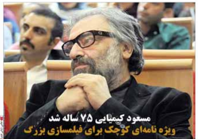
مسعود کیمیایی ۷۵ ساله شد ویژه نامه‌ای کوچک برای فیلمسازی بزرگ

سوپر استارهای پولی! گروه سینمایی ایران با بودجه‌های بسیار بالا برای فیلم‌های خود سرمایه‌گذاری کرده است. این فیلم‌ها با بودجه‌های میلیاردی در بازار بین‌المللی عرضه خواهند شد.