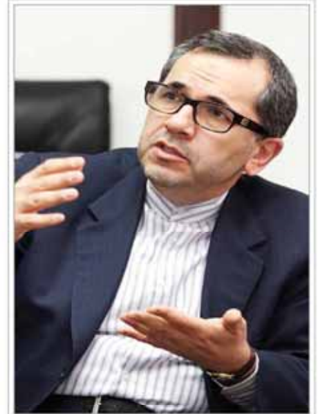
بازگشایی سفارت‌های ایران و انگلیس

پهناشبهه: ۱۳۹۴ خرداد ۲۲ - شماره ۱۱۳۲ - خرداد ۲۲ - ۱۳۹۴ - شماره ۱۱۳۲ - خرداد ۲۲ - ۱۳۹۴