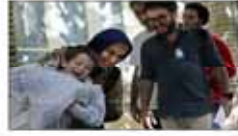
چندین بار برای ساخت فیلم بلند دورخیز کردم