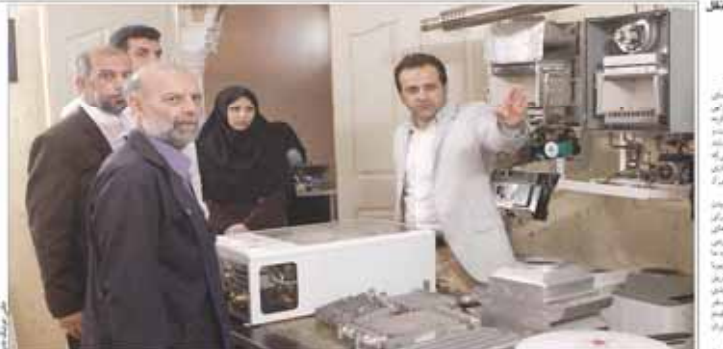
دبیرکل خانه کارگر در بازدید از آزمایشگاه‌های فنی و حرفه‌ای؛ مهارت نقش مهمی در رونق تولید و رفاه خانوار کارگری برعهده دارد

تاریف گفت‌وگوهای ایران و اروپا درباره انرژی، حمل و نقل محیط زیست و حقوق بشر خواهد بود غرب بزرگتر از ایران به سیاست‌هایش را رفع کند موزیکوی توافق خوبی خوش برای کل جهان است بدون حمایت و همکاری و رئیس جمهوری ایران توافق ممکن نبود سید علی قزوینی در نشست خبری مشترک با موزیکوی اعلام کرد: مذاکرات سطح بالا بین ایران و اتحادیه اروپا آغاز شده است. این مذاکرات در زمینه‌های مختلف از جمله انرژی، حمل و نقل، محیط زیست و حقوق بشر خواهد بود. قزوینی افزود: ایران به سیاست‌های خود ادامه می‌دهد و غرب باید این سیاست‌ها را بپذیرد. او همچنین گفت: توافق خوبی خوش برای کل جهان است و بدون حمایت و همکاری از سوی رئیس‌جمهوری ایران، این توافق ممکن نبود.