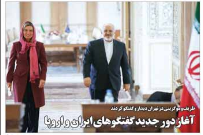
ظریف و توکرینی در تهران دیدار و گفتگو کردند. آغاز دور جدید گفتگوهای ایرانی و اروپایی