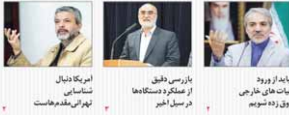
امریکا دنبال شناسایی تهرانی مقدم هاست

مهرماه ۲۰۱۴ ۱۲ شهریور ۱۳۹۳ ۱۹ شهریور ۱۳۹۳ شماره ۲۲۱۳ - ۲۰۰۰ شماره ۰۰۰۰۰۰۰۰۰۰۰۰۰۰