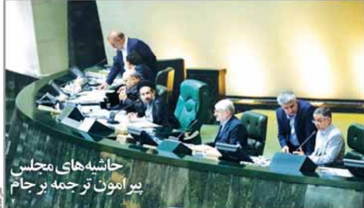
حاشیه های مجلس پیرامون ترجمه بر جام

منتظر ارزانی خودرو نباشید مدیر عامل ایران خودرو و مدیر عامل سایپا در دیدار با هیات مدیران و مدیران عامل شرکت های تابعه خود در تهران. در این دیدار، مدیر عامل ایران خودرو و مدیر عامل سایپا به مدیران عامل شرکت های تابعه خود در مورد وضعیت تولید و فروش خودروها در ماه های اخیر و همچنین برنامه های تولیدی و فروش برای ماه های آینده گفتگو کردند.