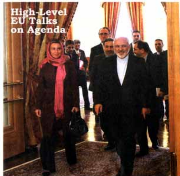
High-Level EU Talks on Agenda

Global energy subsidies are projected at $5.3 billion