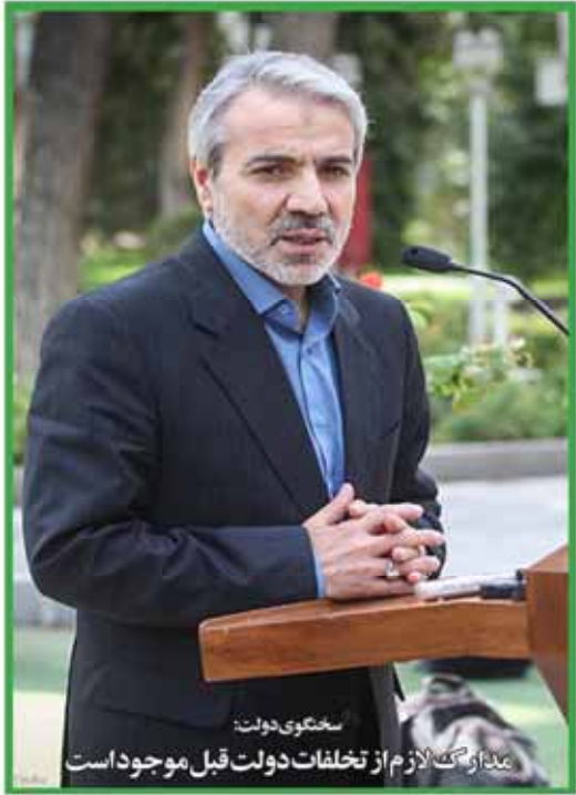
سخنگوی دولت: مذاکره لازم از تخلفات دولت قبل موجود است

چهارشنبه ۷ مرداد ۱۳۹۴ ۱۹ تیرماه ۱۳۹۴ سال سیزدهم شماره ۲۲۶ ۱۰۰۰ تومان