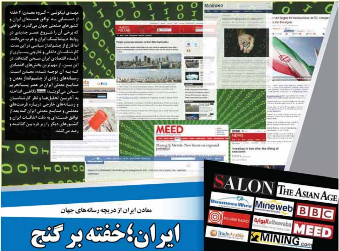
معدن ایران از دریچه رسانه‌های جهان