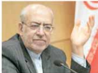
محمدرضا نعمت‌زاده وزیر صنعت، معدن و تجارت: یکی از بحث‌های مهم در حوزه معدن، تکمیل طرح‌های نیمه‌تمام معدنی است

گروه صنعت و معدن | اسمیه سایش - الهام آبابی | تشکیل کنفدراسیون معدن ایده تازه‌ای نیست. پیش‌تر نیز پیشنهاد تشکیل این کنفدراسیون در اتاق بازرگانی مطرح شده بود. این بار انگار فعالان معدنی عزم خود را جزم کرده‌اند تا به زودی با اعلام رسمیت فعالیت کنفدراسیون معدن، تصمیم‌گیری‌های این بخش را در چارچوب‌های متمرکزتری دنبال کنند. همواره انتقادات متعددی در خصوص فعالیت‌های جزیره‌ای در حوزه معدن مطرح می‌شود. در یک‌سو معاونت معدنی وزارت صنعت و در سوی دیگر سازمان توسعه و نوسازی معادن و صنایع معدنی ایران قرار دارد. در همین حال برخی تصمیمات عجولانه کمیسیون صنایع و معادن مجلس حاکی از آن است که در بین نهادهای دولتی ذی‌ربط اتحاد و اتفاق‌نظر کافی وجود ندارد؛ مقوله‌یی که بارها انتقاد اهالی معدن را در پی داشته است. در همین حال، گلابه‌هایی در میان معدنکاران وجود دارد که در تصمیم‌گیری‌های بخش معدن، نظرات بخش خصوصی اعمال نمی‌شود. از این رو می‌توان گفت ایده اصلی تشکیل کنفدراسیون معدن، ایجاد پایگاهی واحد برای اتفاق آرا در این بخش است. چراکه این کنفدراسیون می‌تواند با حضور نمایندگان از دولت، نمایندگان تشکلهای معدنی و فعالان بخش خصوصی، تربیون خوبی برای انتقال مسائل و مشکلات بخش معدن را در اختیار معدنکاران قرار دهد. در همین حال با رفع تحریم‌های بین‌المللی، فضا برای مشارکت‌های خارجی و توسعه تولیدات معدنی مساعدتر خواهد شد. در این رابطه اتاق بازرگانی می‌تواند بازاری قدرتمندی برای شناسایی بازارها، جذب سرمایه‌گذاری و مشارکت خارجی در بخش معدن و صنایع معدنی باشد. خبرها حاکی از آن است که تشکیل کنفدراسیون معدن طی دو هفته آینده به صورت رسمی اعلام خواهد شد.