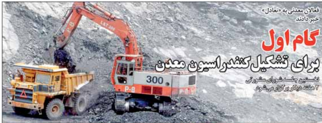
فصل پنجم جلسه شورای معنوی ۱۷ شهریور روز گزین می‌شود