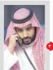
فرمانده نظامی فرمانده نظامی پادشاه عربستان به سوئیس گزاره گیری می کند

دادستان کل کشور در خصوص پرونده پدیده اعلام کرد که این پرونده در صلاحیت قوه قضاییه است و این قوه باید در خصوص این پرونده تصمیم بگیرد. دادستان کل کشور همچنین اعلام کرد که این پرونده در صلاحیت قوه قضاییه است و این قوه باید در خصوص این پرونده تصمیم بگیرد.