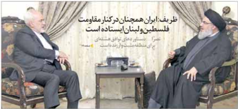
ظریف: ایران همچنان در کنار مقاومت فلسطین ولبنان ایستاده است نصرا... دستاوردهای توافق هسته‌ای برای منطقه مثبت و اثرگذار است