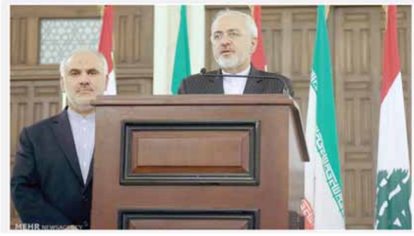
پرسی جهان اقتصاد از طرح جامع مسکن