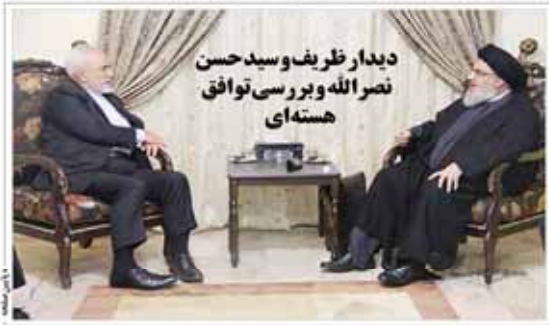
دیدار ظریف و سید حسن نصرالله و بررسی توافق هسته‌ای

شماره ۱۲ - شماره ۲۷ - شماره ۱۳۹۴ - ۱۲ آگوست ۱۳۹۴ - شماره ۱۲۷ - شماره ۱۳۹۴ - شماره ۱۲۷