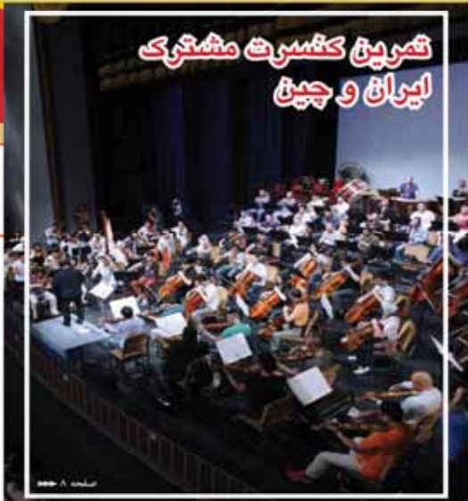
تشریح کثرت مشترک ایران و چین

۱۰ میلیون کالا به جای ۳ میلیون نقد: اعلام شرایط دریافت جایگزین وام ازدواج. در حالی که افزایش وام سه میلیاردی دولتی ازدواج طلا به نظر می‌رسد که از این پس زوج‌های جوان می‌توانند به جای دریافت آن وام نقدی تا سقف ۱۰ میلیون تومان وام از بانک مرکزی دریافت کنند.