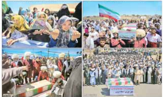
آئین استقبال از پیکر مطهر شهید غواص در مرز اینچبهرن