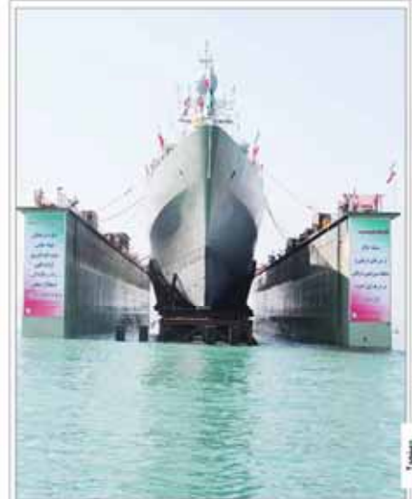
نیروی دریایی ایران به نام موشک‌انداز تجهیز می‌شود

وزیر بهداشت ضمن تأکید بر لزوم اصلاح تعرفه‌های خدمات پزشکی، گفت: دولت باید در تخصیص بودجه برای بخش بهداشت و درمان، اولویت بیشتری داشته باشد.