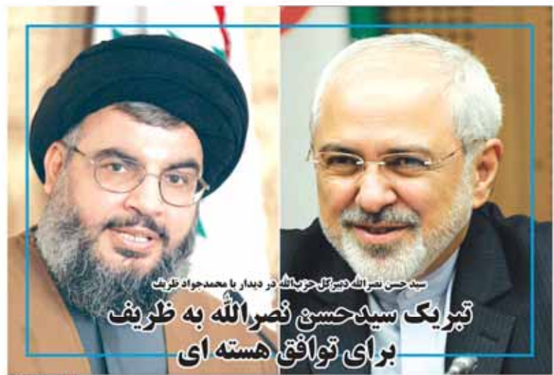
سید حسن نصرالله دبیرکل حزب الله در دیدار با محمدجواد ظریف تبریک سید حسن نصرالله به ظریف برای توافق هسته‌ای

افیونی جدید به نام لاغری. افیونی جدید به نام لاغری. افیونی جدید به نام لاغری.