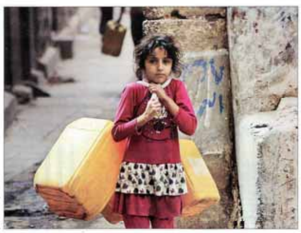
سازمان ملل آمیبیون لغز مردم بین در شرایط... همسایه‌های ۹۰ قرار دارند