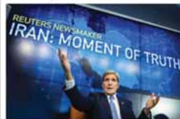
US Secretary of State John Kerry speaks during a Reuters NewsMaker event on the nuclear agreement with Iran in New York on August 11, 2015.

US Secretary of State John Kerry warned that the dollar's status as the global reserve currency could be threatened if Congress rejects the nuclear accord with Iran.