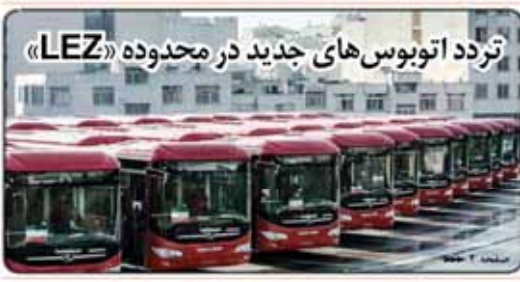
تردد اتوبوس‌های جدید در محدوده «LEZ»