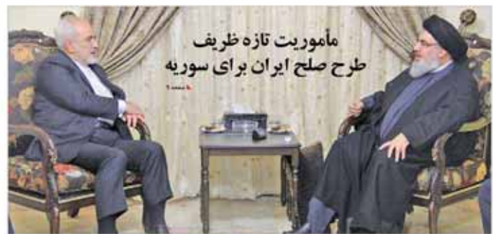
مأموریت تازه ظریف طرح صلح ایران برای سوریه

با دیدن تونی استارک، باشگاه ملانچه جدید می‌داند جایگزینی بهتر از وزیر فعلی بود. مشکل اقتصادی کشور را بر عهده بگیرد با تلاش مجلس استارک، باشگاه ملانچه ملانچه را بر عهده بگیرد. مشکل اقتصادی کشور را بر عهده بگیرد با تلاش مجلس استارک، باشگاه ملانچه ملانچه را بر عهده بگیرد. مشکل اقتصادی کشور را بر عهده بگیرد