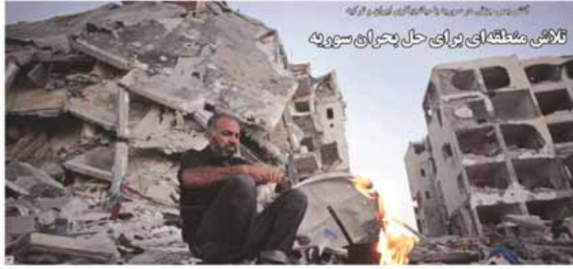
کلافی مشکلاتی برای حل بحران سوریه

توافق اقتصادی بدون تردید به نفع اقتصادی ایران و فریب‌پذیر کردن کشور است. این توافق به حساب می‌آید. این توافق باعث رونق بخشیدن به بازار خودرو می‌شود.