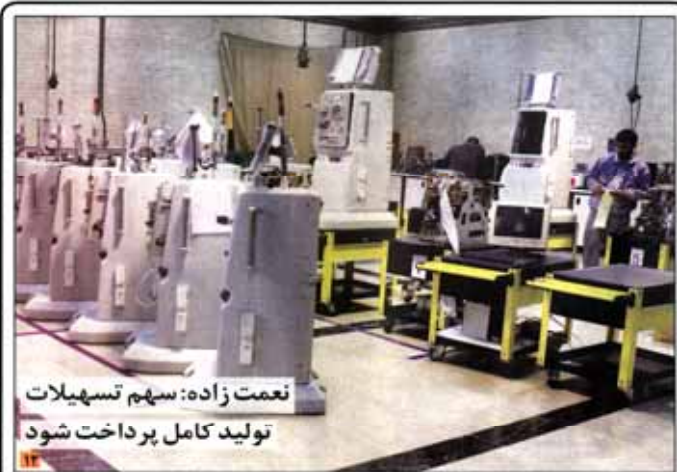
نعمت زاده: سهم تسهیلات تولید کامل پرداخت شود