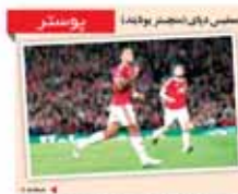
مجلس دین منجستر بودندا

برانکو: خط دفاعیمان خوب کار می کند به استقلال و سپاهان نمی باخسیم