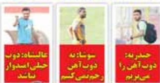
عالمشاه: دوب حسن اسدوار نمانند سوسا: نه دوب آهن رحیم حسن گنیم حسین: نه دوب آهن را هن بر نم

چه کسی گفته نمی خواهم از بنگر استفاده کنم؟ برانکو: دفاع پرسپولیس خیلی کار دارد آزمون و خطای برانکو تا کجا ادامه دارد? هر بازی حداقل ۴ تغییر خط و نشان پرسپولیس هاترک پچی