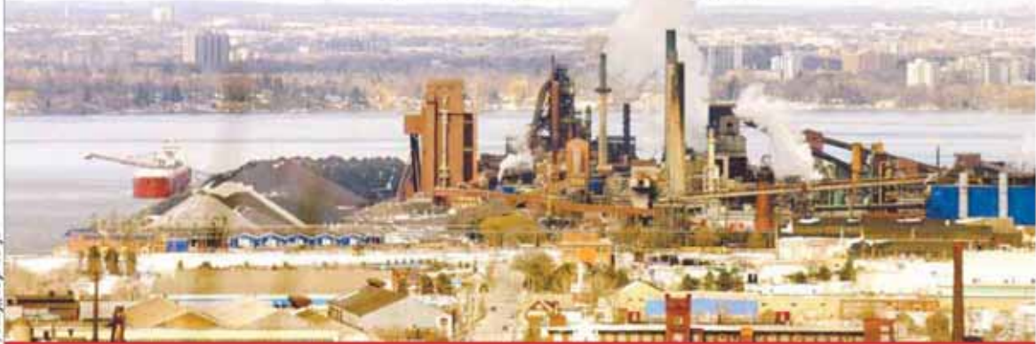
کارخانه فولاد بیرمنگام

جعفری طهرانی در هر صورت، تولید فولاد در امریکا جوابگوی نیازهای آنها نبوده است. در سال ۲۰۱۴م، میزان تولید فولاد امریکا ۸۸ میلیون تن بوده است. این میزان تولید باعث شد که این کشور در فهرست برترین تولیدکنندگان فولاد جهان پس از کشور ژاپن و قبل از هندوستان قرار بگیرد؛ ۲ کشوری که به ترتیب ۱۱۰ میلیون تن و ۸۶/۵ میلیون تن تولید داشته‌اند. در هر صورت، کسری عرضه ۴۳ میلیون تنی امریکا در سال ۲۰۱۴م باعث شد که این کشور مجبور به تامین نیاز خود از طریق واردات شود. در هر صورت، بررسی روند تقاضای فولاد امریکا نشان می‌دهد که مصرف این کشور تا سال ۲۰۱۹م کاهش پیدا نمی‌کند و در هر سال شاهد افزایش تقاضای یک تا ۱/۵ میلیون تنی خواهیم بود. پس از این سال، روند کاهشی تقاضای امریکا شروع خواهد شد. در هر صورت، تا آن زمان هم میزان رشد کم سرعت تقاضای امریکا نشان‌دهنده واقعیتی است. با آنکه در این کشور شاهد رشد جمعیت و افزایش پروژه‌های ساختمانی و همچنین توسعه صنعت خودروسازی هستیم، فولاد در حال جایگزین شدن با دیگر محصولات است.