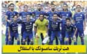
هت تریک ساموئلگ با استقلال