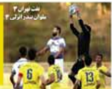
بخت تهران موانع در بازی

عمران زاده: نابراهن استقلال از فونال حد حافظی می کم