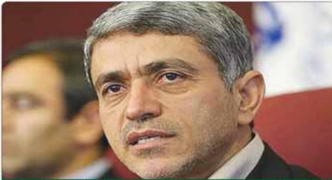
یک نماینده: عملکرد طیب نیا بسیار مثبت بوده است

رئیس جمهور: مجلس آینده متعلق به یک حزب و جناح نخواهد بود