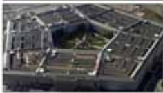
آمریکا ۲۰ میلیون دلار دیگر کمک نظامی به گرجستان اختصاص می دهد

وکيل مذاکره سازمان تامین اجتماعی خبر داد تعیین یک سال حبس برای مرتضوی و تعلیق ۶ ماه آن