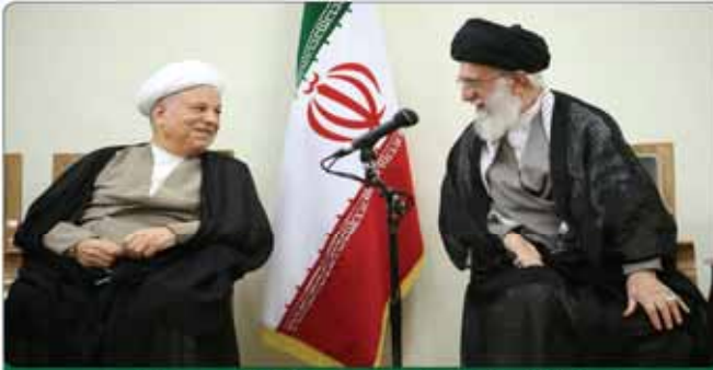
رهبرانقلاب: نباید فریب لیخند دشمن را خورد

جنایت! جنایتکاری که پسر بچه ۱۰ ساله‌ای را سر برید حکم بازداشت رئیس جمهوری گواتمالا صادر شد