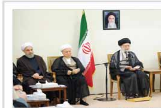
مقام معظم رهبری در دیدار اعضای مجلس خبرگان: مجلس از بررسی برجام کنار گذاشته نشود

رئیس‌جمهور در دیدار با اعضای مجلس خبرگان، مقام معظم رهبری در دیدار اعضای مجلس خبرگان، مجلس از بررسی برجام کنار گذاشته نشود.