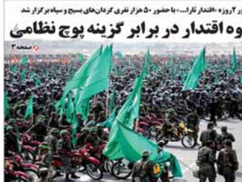
شکوه اقتدار در برابر گزینه پوچ نظامی مانور آرزو ه - اقتدار نار... با حضور ۵۰ هزار نفری گردان‌های سیخ و سپاه بر گزار شد

دولت کنترل تورم را فدای رکود کرد «محمد رسول...» ۲ میلیاردی شد، «تهنگ عزیز» ۷ میلیاردی هشدار بولانووی به پادشاهی تصحیر می‌کند آمار کودک - بیوه‌ها در حال افزایش است