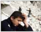
بونیف گرایش داد: جنگ در خاورمیانه ۱۳ میلیون کودک را از تحصیل محروم کرده است

سرتیپ سلاخی: توافق شود یا نشود، آمریکا دشمن درجه یک ایران است