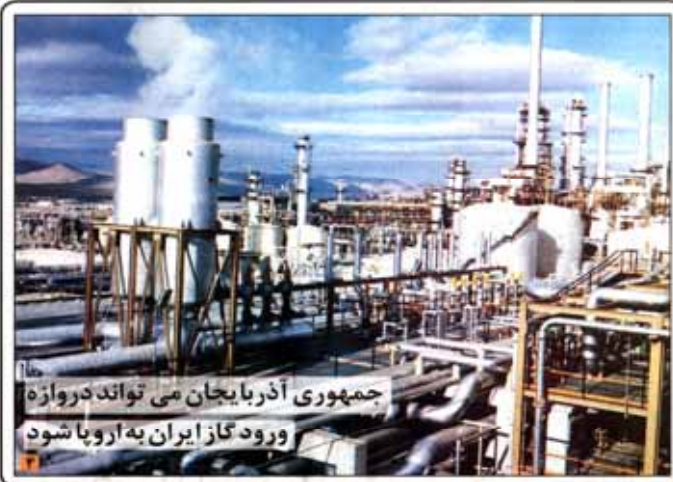
جمهوری آذربایجان می‌تواند دروازه ورود گاز ایران به اروپا شود

مصرف سوخت پلاستیک تهران بیش از ۱۰ درصد کاهش پیدا می‌کند