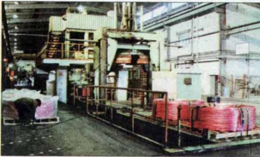
روند قیمت فلزات پایه در بازارهای داخلی (کیلو / تومان)