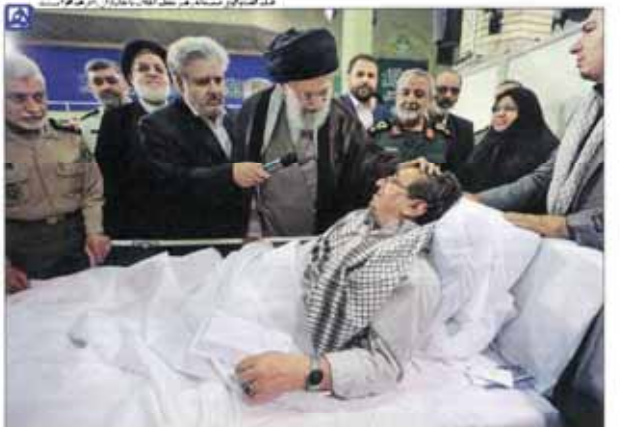
صبر همسران جانبازان، ایثارگری واقعی و یک جهاد و حماسه است رهبان معظم انقلاب روز گذشته به مدت دو و نیم ساعت با جمعی از جانبازان و خانواده آنان از نزدیک دیدار کردند.

پرسش‌های نمایندگان و پاسخ‌های آمانود در بهارستان گفتگو بین نمایندگان مجلس و مسئولان دولت در بهارستان. پرسش‌ها در مورد وضعیت اقتصادی و اجتماعی کشور بود. نمایندگان خواستار پاسخ‌های شفاف و عملیاتی شدند.