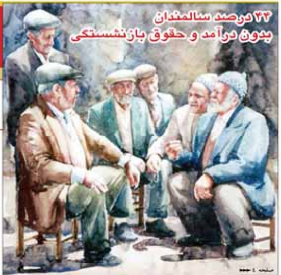
۳۳ درصد سالمندان بدون درآمد و حقوق بازنشستگی