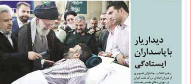
دیدار یار ایستادگی وهر انقلاب: جانسازان تصویر از دوران انقلاب بزرگ ملت ایران در دوران دفاع مقدس هستند

قول‌های آمانو به تهران مدیرکل آژانس بین‌المللی انرژی اتمی بر احترام به مسائل محرمانه و اجرای بدون تبعیض پروتکل الحاقی تأکید کرد. واکنش مسئولان آژانس بین‌المللی انرژی اتمی در پاسخ به قول‌های آمانو در خصوص اجرای پروتکل الحاقی، تأکید بر احترام به مسائل محرمانه و اجرای بدون تبعیض پروتکل الحاقی داشت. صحبت از تور زنجانی تشویش‌ناک است آذغان عمومی است اینکه می‌گویند گسلی می‌خواهند ایشان را بکشند، حرف نامصحیح و تشویش‌ناک است. این حرف‌ها تشویش‌ناک است و خود فرد می‌تواند از آنها شکایت کند و دادستان نیز می‌تواند به عنوان مدعی وارد شود.