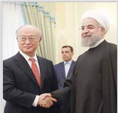
رئیس هیات مدیره سازمان امور مالیاتی با مدیرعامل شرکت...