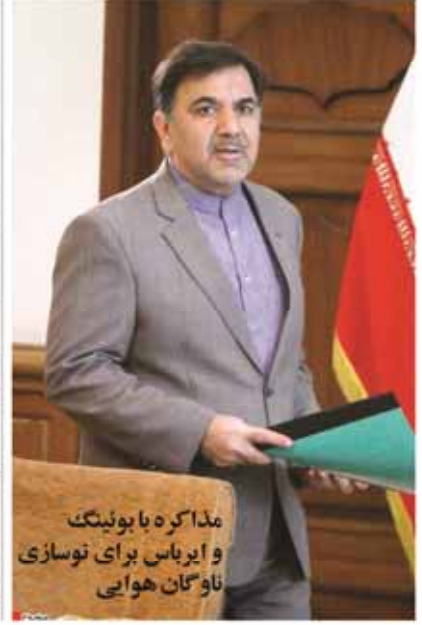
مذاکره با بونینگ و ایراس برای توسازی ناوگان هوایی

گروه ایوان رهبر معظم انقلاب صبح امروز و در آستانه هفته دفاع مقدس، به مدت ساعت و نیمه با جمعی از جانبازان قطع نطاع و جانبازان بسیاری عهده درنده که همزمان جشنشان و رنگ با در حضور بهار عروه را از دست داده اند و همچنین خانواده‌های آنان از نزدیک دیدار و در فضای صمیمی آنان را مورد عطف قرار دادند. حضرت آیت الله عهده این بند از دیدار با جانبازان و خانواده‌های آنان در سخنان گزارشی با اشاره به رنج ها و مشکلات جسمی جانبازان اجر آنان را سه دلی این انصاف است، نگاهت، نگاهت و رو به افراش مانند و خاطر نشان کرد: جانبازان باقر و صوری از دوران اسلام بزرگ مثل ایران در دوران فطاح مقدس هستند و حضور آنان در جامعه، در واقع پیمان طایفه تاریخی، سرخ، سبزی و این استانی است. ایشان با اشاره کردند: جانبازان از یک طرف گرسای عبادت قدرانی هستند که از صدام حیانت کردند و از طرف دیگر نشان عهده فلسفه و برگزاری نام راضی ایرا و انقلابی