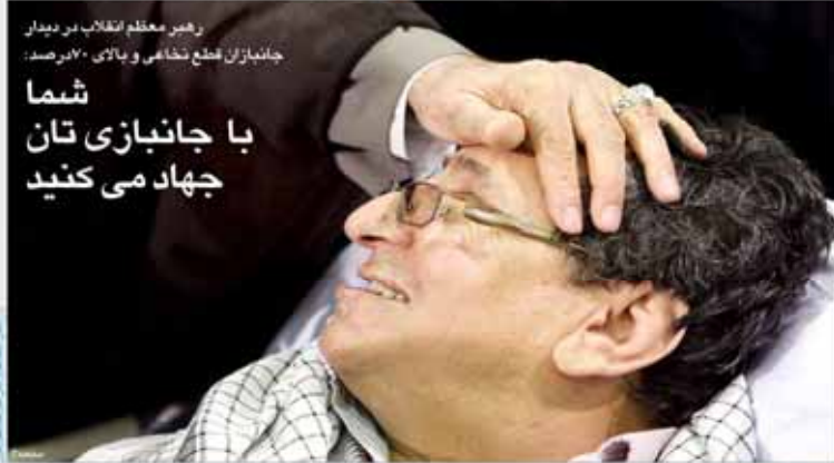
رهبر انقلاب در دیدار جانبازان قطع نخاع و بالای ۷۰ درصد: