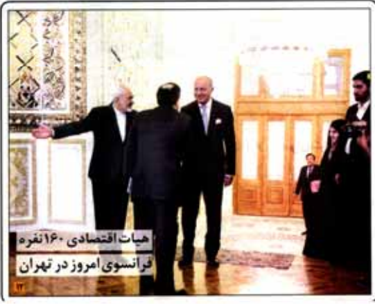
هیات اقتصادی ۱۶۰ نفره فرانسوی امروز در تهران

تعیین خارجی ها به سرمایه گذاری در فولاد و فلزات سنگین رئیس سازمان نظام مهندسی سخن از گزافه ها در سخن ها و بیانات در نشست های رسانه ای کرد. در این نشست ها و بیانات، سخن از گزافه ها و بیانات در نشست های رسانه ای کرد. در این نشست ها و بیانات، سخن از گزافه ها و بیانات در نشست های رسانه ای کرد.