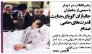
رهبر انقلاب در دیدار با جمعی از جانبازان... قدرت‌های حامی... صدام... رئیس‌جمهور فریبده‌ها... گویی حمایت قدرتمندی... سرم حیات گرفت... عده... ۳۰ شهریور ۱۳۹۴ - ۱۳۹۳ - ۲۰۱۳

در گفت‌وگویی اعلام شد وزیر ارتباطات فیلتر شکن ندارد