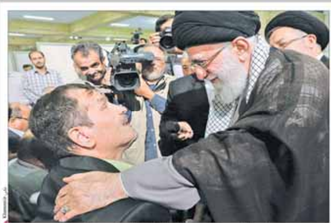
رهبر معظم انقلاب در دیدار جمعی از جانبازان قطع نخاعی و بالای ۷۰ درصد جانبازان نشاتگر عظمت انقلاب هستند