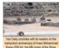
Iran Daily conducts with its readers on the martyrdom anniversary of Imam Muhammad Baqer (PBUH), the 5th Imam of the Shi'a.

Number 5171 • Monday September 21, 2015 • Shahrivar 30, 1394 • ZilHijjah 7, 1436 • Price 5,000 Rials • 12 Pages • www.irandailyonline.ir