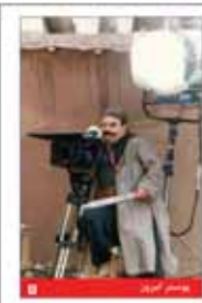
باز پیش سروال اعجاز بود از اقبال در شنبه سوم سپتامبر «آسمان من» پس از مدتها بلاکلیبی کنداکتور گرفت