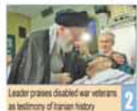
Leader passes disabled war veterans as testimony of Iranian history

"Under the deal, we will voluntarily carry out the additional protocol and we hope you have a fair observation on implementation of the deal," Rouhani told Amano. "The agency will have an effective role in implementation of the deal." The Iranian president also reiterated that Iran has no intention of developing a nuclear weapon. "Over the past years and during monitoring and snap inspections by the agency, it is persisted that Iran has had no diversion from its peaceful nuclear program," he said. "We do not seek any demand beyond the safeguards agreement between Iran and the agency," Iran's president added, referring to IAEA verification measures. He said the "legitimacy of Iran's peaceful nuclear activities had been