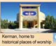
Kerman, home to historical places of worship