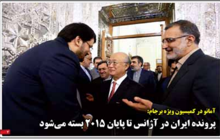
آمانو در کمیسیون ویژه برجام؛ پرونده ایران در آژانس تا پایان ۲۰۱۵ بسته می‌شود

هوای ابری یا احتمال بارش آسیدی مهداب چودکی، خراب‌ترین یوزپلنگ از دود لسان‌رنگی با بستر کثیف و آلوده می‌شود. تا حدود ۱۰۰ کیلوگرم سولفید کربن در هر لیتر آب باران می‌بارد. این باران به صورت اسید سولفیک شناخته می‌شود. این اسید به سرعت در دریاها و رودخانه‌ها حل می‌شود و به صورت اسید سولفیک دریا شناخته می‌شود. این اسید به سرعت در دریاها و رودخانه‌ها حل می‌شود و به صورت اسید سولفیک دریا شناخته می‌شود.