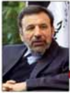
وزیر ارشیادات فیلتز ینگ تلگرام را امضا نمی‌کنم