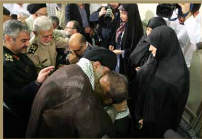
رئیس عظیم انقلاب اسلامی در دیدار جمعی از جانبازان قطع نخاعی و بالای ۷۰ درصد

روحانی خطاب به آیتابو در اجرای توافق برجام متصفانه نظارت داشته باشید خلاف تخیلی در اجرای پروتکل الحاقی نشده جدید آیتابو