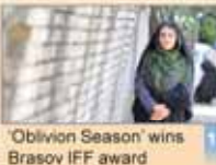
'Oblivion Season' wins Brasov IFF award