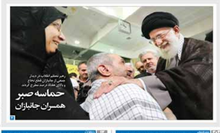
رهب معظم انقلاب در دیدار جمعی از جانبازان قطع نخاع و بالای هفتاد درصد مطرح کردند