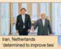
Iran, Netherlands determined to improve ties

Number 5171 • Monday September 21, 2015 • Shahrivar 30, 1394 • ZilHijjah 7, 1436 • Price 5,000 Rials • 12 Pages • www.irandailyonline.ir