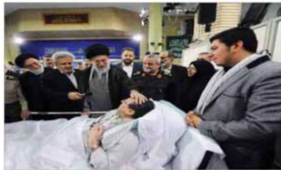
رهب معظم انقلاب در دیدار ۲ نیم ساعته جانبازان قطع نخاعی؛ صبر همسران جانبازان، یک حماسه است