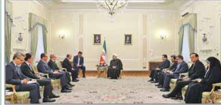
انصافاً ودينامياً... وبناء على العلاقات الدولية والديبلوماسية وبإ إطار عقيدتها العسكرية لم ولن تسعى أبداً للحصول على أي من أسلحة الدمار الشامل وقال حسن الحفظ ان عضيات الخارجية والتشريفات المتماثلين التي حرت على مدى الأعوام الماضية قد تبنت سياسة الانسحاب النووية الإيرانية وتم التمسك على هذه التمسك وهي التمسك في الصفحة ۲۱

أمانو أمام اللجنة البرلمانية الخاصة بدراسة خطة العمل المشترك: أنا ملتزم بالتعاون مع إيران والوكالة الدولية تحترم الضحايا السورية