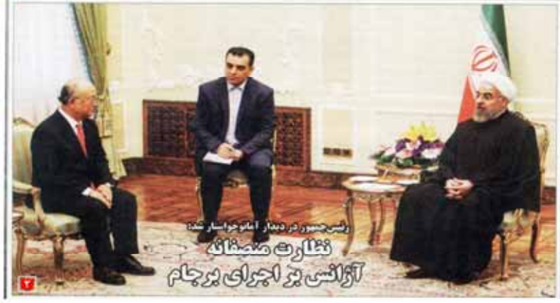
رئیس هیئت مدیره آمارچراپل شد

بازار ارز در حالی که در محدوده نوسان خود قرار دارد، شاهد تغییرات ناگهانی در نرخ ارز است.