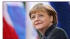
مرکز: باید از مزایای موج پناجویان استفاده کنیم صفحه آخر

احتمال انتقال اجساد جان باختگان منا از دوشنبه روحانی در فرودگاه جان آبدار گشت نیویورک عربستان برای امداد رسانی به زائران ایرانی همکاری کند تسلیمت کاخ سفید به خانواده های جانباختگان در عربستان صفحه ۲