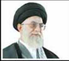
رهبر معظم انقلاب

دولت سعودی موظف است مسئولیت سنگین این حادثه تلخ را بپذیرد