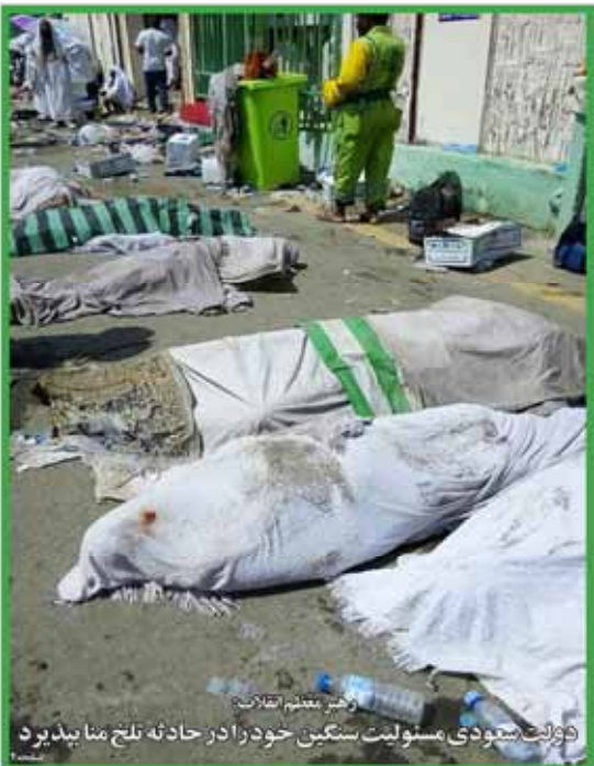
وکیل معتمد انقلاب دولت سعودی مسئولیت سنگین خود را در حادثه تلخ منا پذیرد

شماره ۴ مهر ۱۳۹۴ ۱۲ ذی‌الحجه ۱۴۳۶ ۲۶ سپتامبر ۲۰۱۵ سال چهارم، شماره ۲۶۶ ۱۲ صفحه ۱۰۰۰ تومان