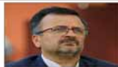
داوودزاد: ماندن یا رفتن گواچ بستگی به خروجی جلسه کارشناسی دارد صفحه ۷