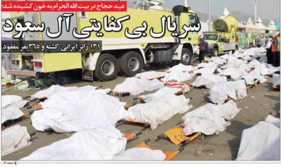
عید حجاج در بیت الله الحرام به خون کشیده شد؛