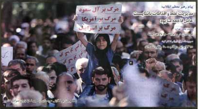
پیام رهبر معظم انقلاب: مدیریت غلط و اقدامات ناشایسته عامل فاجعه منا بود

وزیر اقتصاد با تشریح فضای جدید بین‌المللی پیش روی ایران گفت: در چند ماه آینده شاهد تحولات جدی در حوزه اقتصادی کشور خواهیم بود و همپای روزهای روشنی پیش رو است. طی طیب نیا در مجمع عمومی بانک سپه که به منظور آینده عملکرد و تعویب صورت‌های مالی سال ۹۳ این بانک تشکیل شده گفت: با گشایش‌هایی که حاصل می‌شود، افزایشی که در صادرات نفت خواهیم داشت و منابع مالی که از خارج از کشور برآمده می‌آید، به دست می‌آید.