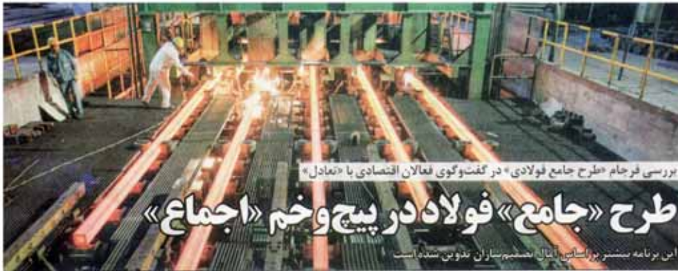
بررسی فرجام طرح جامع فولادی در گفت‌وگوی فعالان اقتصادی با «تعاون»