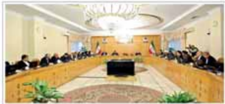
جلسه ویژه هیات دولت برای پیگیری حادثه منا

روز انقلاب در پی فاجعه مصیبت بار دگرگون فر ما امروز عراق صومالی اعلام کرده است مدیریت غلط و اقدامات ناشایسته‌ای که عامل این فاجعه بوده است نباید از نظر دور بماند