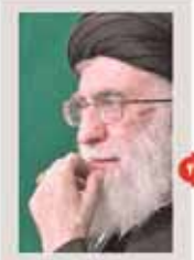
شیخ‌الاسلام آیت‌الله العظمی علیه‌السلام آیت‌الله محمد تقی مجلس خبری رهبر انقلاب، مدیریت لحاظ و اقدامات ناشایسته عامل این فاجعه بوده‌است

پاسخ آمانو به انتقادها درباره نمونه برداری از پارچین ول استارت‌یست ژاپن: نمونه برداری ایران از پارچین، دهکده سفلی، ایران از خودبود