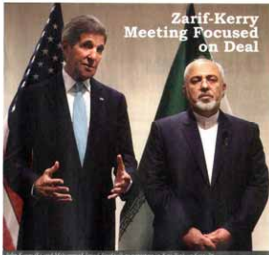
Zarif-Kerry Meeting Focused on Deal

The World Bank, with other development banks, coined the phrase "Billions to Trillions" to illustrate the challenge. Organization for Economic Cooperation and Development Secretary-General Angel Gurría said private sector participation