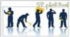
عصر تکام واحد پوشاک هاگوپیان صنایع روشایی تولید نور