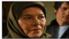
هما روستا در روز تولدش درگذشت صفحه ۲