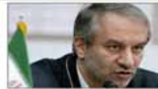
تاشپان، با یک شوخی می خواستند رابطه من و ناچ را خراب کنند صفحه ۱۱