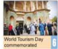
World Tourism Day commemorated 6

Number 5176 • Monday September 28, 2015 • Mehr 6, 1394 • Zilhijjah 14, 1436 • Price: 5,000 Rials • 12 Pages • www.irandailyonline.ir