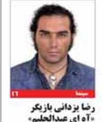
رضا یزدانی بازیگر «آه ای عبدالحلیم»