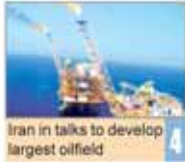
Iran in talks to develop largest oilfield 4