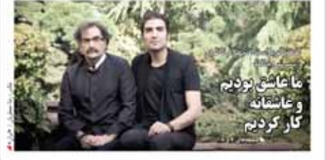
ما عاشق بودیم و عاشقانه کار کردیم

آمار قربانیان تا دیروز: ۱۶۹ کشته، ۴۸ مصدوم و ۳۰۷ مفقود