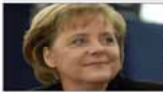
میکائیل ساختمان شورای امنیت باید اصلاح شود صفحه ۲

آغاز حملات هوایی فرانسه علیه داعش در سوریه صفحه ۲ اوکراین از احتمال تمدید یا تشدید تحریم ها علیه روسیه خبر داد صفحه ۲