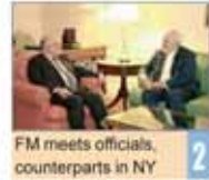
FM meets officials, counterparts in NY 2

Number: 5179 • Thursday October 1, 2015 • Mehr: 9, 1394 • Zilhijjah 17, 1436 • Price: 5,000 Rials • 12 Pages • www.irandailyonline.ir