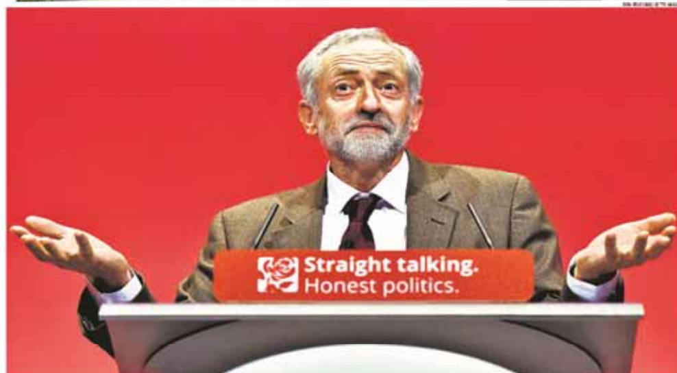
Jeremy Corbyn set out his policies at the Labour conference yesterday, but parts of his speech were taken from a draft rejected by five previous leaders of the party