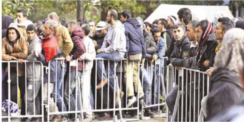
Kaum zu bewältigender Andrang: Jeden Tag kommen zwischen 8000 und 10 000 Flüchtlinge, die alle, wie hier in Berlin, registriert werden müssen

2,50 € D 2954A F.A.Z. im Internet: faz.net