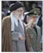
وزیر امور خارجه ایران در حال دیدار با مقامات روس است

لزوم تشکیل کمیته حقیقت یاب در خصوص حادثه منا