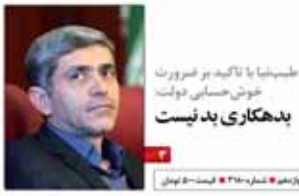
طیبه‌نیا با تاکید بر ضرورت خوش‌حسابی دولت، بدهکاری پد نیست

نماینده در جلسه خودرویی با مجلس: ۲ هزار میلیارد تومان خودروسازان را به زور از دولت می‌گیرم وزیر اقتصاد: خزانه دولت آبلاین می‌شود معاون حقوقی رئیس جمهور: حضور آمریکایی‌ها در اقتصاد ایران منع حقوقی ندارد