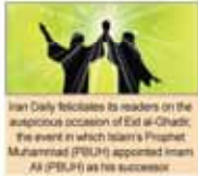
Iran Daily facilitates its readers on the auspicious occasion of Eid al-Ghadeer, the event in which Islam's Prophet Muhammad (PBUH) appointed Imam Ali (PBUH) as his successor.