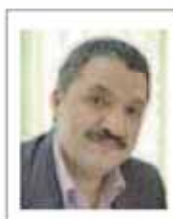
سعید صمدی رئیس کمیسیون معدن خانه اقتصاد ایران

چند سالی است که به دلیل افزایش چند برابری قیمت مواد اولیه معدنی، توسعه بخش معدن با توجه به ذخایر معدنی کشور مطرح شده و طبعاً در همین راستا، تب برگزاری نمایشگاه و همایش‌های معدنی بالا گرفته اما موضوع در این زمینه، کیفیت کنفرانس‌ها و