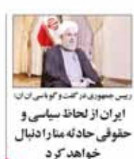
رئیس جمهوری در حکمت و کرمی از آن

با سازش و خوش و بش کردن مشکلات حل می‌شود؟