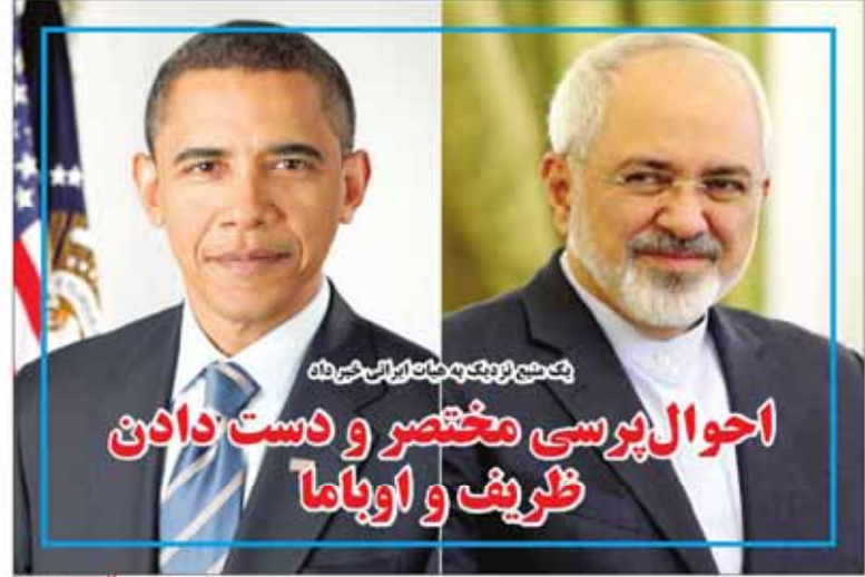
یک منبع نزدیک به خاتمه ایران خبر داد: احوال‌پرسی مختصر و دست دادن ظریف و اوباما

مدیر عامل دخانیات در گفت و گو با «راه مردم» مطرح کرد