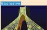
Light installation to debut in Tehran 12