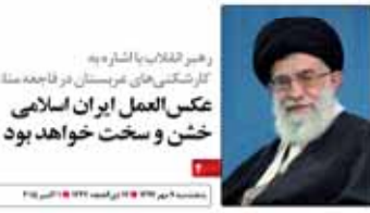
رهبر انقلاب با اشاره به کارشناسی‌های غیرمستند در قاجاده مملکت، عکس‌العمل ایران اسلامی خشن و سخت خواهد بود