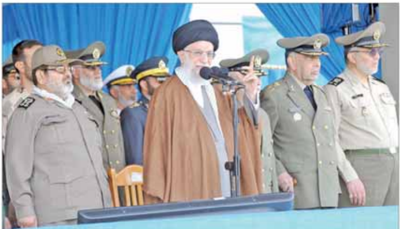
آیت‌الله خامنه‌ای در جریان دیدار با فرماندهان ارتش و سپاه پاسداران در تهران.