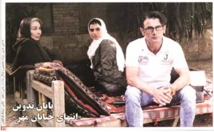
نایان تدوین «انتهای خیابان مهر»

فصل ما اهمیت بیشتری دارد نگاهی به حضور خوانندگان در سینما گروه سینمایی ایرانی، خانه سینمای ایران امروز نیاز به یک گروه جدید برای جذب مخاطب داشته باشد تا فقط از زمین بازی برآمده شده گذشته که پیش از این بازیگران و بازیگران سینما بودند، راهی برای جذب آن نیست. حضور خوانندگان در نقش خواننده در یکی دو نمونه فیلم به موفقیت سینما شده است اما تاکنون کمتر فیلمی ساخته شده که تنها به خاطر حضور یک خواننده فروش متفاوتی داشته باشد. خصوصاً آن که این روزها حضور تلویزیونی خوانندگان در سریال‌ها و فیلم‌ها بسیار رواج پیدا کرده و بسیاری از بازیگران که دیگر نمی‌توانند با آنها همپوشانی داشته باشند، راه کار برآمده از این شوم‌ترین سریال‌ها را در نمایش فیلم‌های رسمی برگزیده به همین دلیل است که مخاطبان امروز سینما به راحتی پس از حضور خوانندگان در فیلم‌ها جا باز دارند.