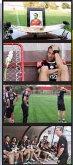
عکس‌های این سرمربی پرسپولیس بدون بودوری

گزارش خراسان از پرونده ۱۰۰ هزار دلاری کی‌روش