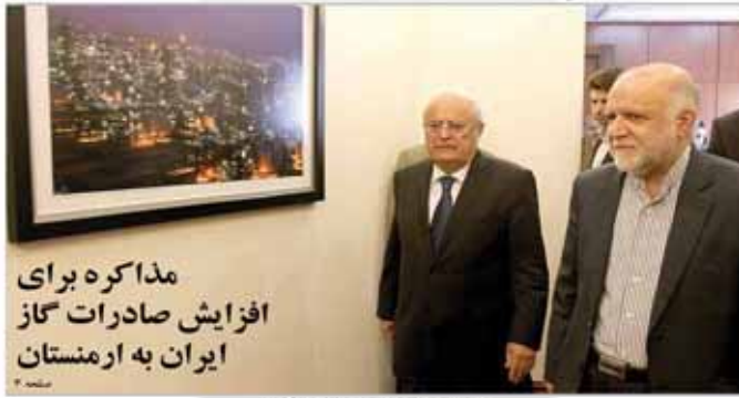
وزیرین سازمان سرمایه‌گذاری و رئیس هیئت مدیره سازمان سرمایه‌گذاری

وزیر جهادکشاورزی گفت: وزیر نفت از امکان گازرسانی به هر محدوده روستایی کشور تا پایان دولت پانزدهم خبر داده که این برای وزارت جهادکشاورزی خبر خوشی است. محمود حجتی در نشست اعضای کارگروه ملی رفاه با پایدارسازی و کاهش اثرات خشکسالی در این طرح ملی سازمان پانزدهمین و چهارمین بار شرکت کرد. او در فرصت‌های قبلی کشاورزی و پوشش گیاهی کشور، شبکه گاز و آلودگی و سلامت در قالب این طرح ملی شرکت کرده است. حجتی گفت: گازرسانی به ۸۵ درصد جمعیت روستایی کشور تا پایان دولت پانزدهم خبر خوشی است. وزیر جهادکشاورزی در این نشست افزود: وزیر نفت از امکان گازرسانی به هر محدوده روستایی کشور تا پایان دولت پانزدهم خبر داده که این برای وزارت جهادکشاورزی خبر خوشی است. محمود حجتی در نشست اعضای کارگروه ملی رفاه با پایدارسازی و کاهش اثرات خشکسالی در این طرح ملی سازمان پانزدهمین و چهارمین بار شرکت کرد. او در فرصت‌های قبلی کشاورزی و پوشش گیاهی کشور، شبکه گاز و آلودگی و سلامت در قالب این طرح ملی شرکت کرده است.