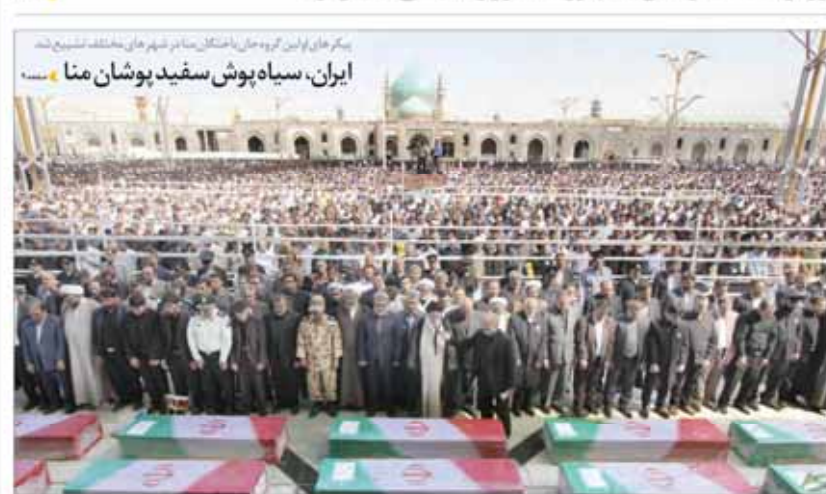
پیکرهای اولین گروه جان باختگان منا در شهر هان به‌عنوان تشییع شد

وزیر اقتصاد: رئیس جمهور دستور رسیدگی صادر کرد