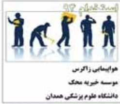
هوایمبای زاکری موسسه خبریه جنگ دانشگاه علوم پزشکی همدان