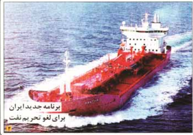
برنامه جدید ایران برای لغو تحریم نفت

انتقال آب به دریای اروپا کلید خورد. مشرف وزیر امور خارجه گفت: انتقال آب به دریای اروپا کلید خورد. مشرف وزیر امور خارجه گفت: انتقال آب به دریای اروپا کلید خورد. مشرف وزیر امور خارجه گفت: انتقال آب به دریای اروپا کلید خورد.