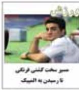
سرویسکت کنفی فرانکی تاریخین به المیک