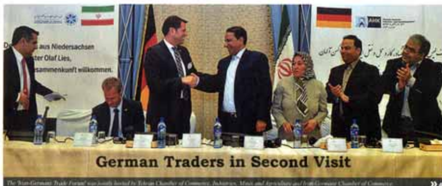
German Traders in Second Visit

Lifting of western sanctions on Iran will present an opportune time for India to start negotiations on inking a preferential trade pact with Tehran, which can fill up the demand gap for Indian exporters in many other economies, said the Associated Chambers of Commerce and Industry of India, also known as Assocham.