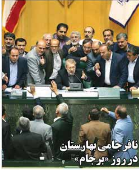
نافر جامی بهارستان در روز «برجام»

وزیران اقتصاد، صنعت، معدن و تجارت، کمر و روانه اجتماعی و دفاع نامهای مشترک به رئیس‌جمهور ارسال کردند. تسهیل فضای اشتغال رسانی دولت نامه مشترک این وزیران را به رئیس‌جمهور بابت کرد. به گزارش خبرگزاری صدا و سیما، چهار تن از وزیران کابینه بر نامه‌ای مشترک به رئیس‌جمهور با اشاره به رکود اقتصادی و واقعیت‌های موجود در شرایط صنایع مختلف در بورس اعلام کردند. امروز