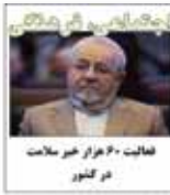
فعالیت ۶۰ هزار خبر سلامت فر کنور