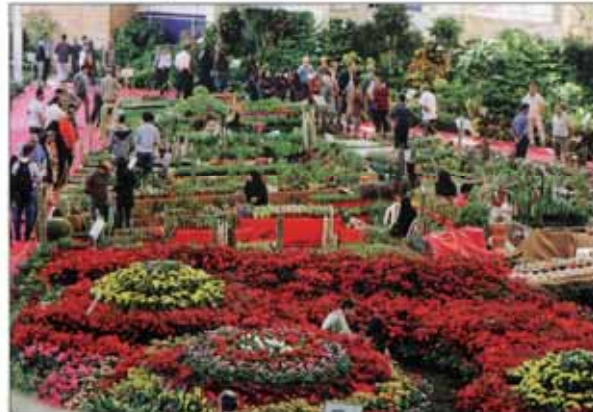
پاییز شهر با گل‌های رنگارنگ، بهاری شد هفتمین نمایشگاه گل‌های پاییزی تا چهارشنبه این هفته از ساعت ۱۰ صبح تا ۲۱ در بوستان گفتگو پذیرای علاقه‌مندان است

افزایش قیمت‌ها طبق قانون انجام نشد ملاک‌های شناسایی بر درآمدها اعلام نشد پارانه بخش تولید پرداخت نشد صرفه‌جویی با حذف پارانه تا پایان سال مقدور نیست