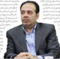
رئیس‌جمهور اعلام کرد:

رئیس‌جمهور اعلام کرد که دولت برای حل مشکلات اقتصادی نیازمند همکاری بخش خصوصی است. وی افزود که دولت در حال تدوین سیاست‌های جدیدی برای ۶ ماهه دوم است که در آن بخش خصوصی نقش مهمی خواهد داشت.