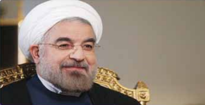
هیچ وقت مانع حضور سرمایه‌گذاران آمریکایی در ایران نبوده‌ایم