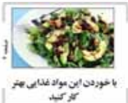
با خوردن این مواد غذایی بهتر کولر کنید

شماره ۱۹ مهر ۱۳۹۴ - ۲۲ | ۱۳۹۴ - ۱۳۹۳ | سال پنجم - شماره ۱۳۹۴ - ۱۳۹۳ | ۱۳۹۴ - ۱۳۹۳