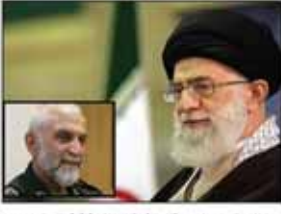
مهران -قارن-: اصغر قائد الثورة الاسلامية آية الله السيد علي الخامنئي ميتة حزن فيه باستشهاد العميد همداني في ضواحي مدينة حلب ب سوريا.

معزيا باستشهاد العيد همداني.. القائد: التطبيع بلغ امله في الجبهة الزاخرية بالفخر للدفاع عن حرم اهل البيت (ع)