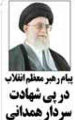
پیام رهبر معظم انقلاب در پی شهادت سردار همدانی