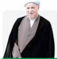
اصلاح رابطه ایران و عربستان کاملاً دشمنی است