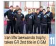
Iran lifts taekwondo trophy, takes GR 2nd title in CISM

Number 5187 • Sunday October 11, 2015 • Mehr, 19, 1394 • Zilhijjah 27, 1436 • Price 5,000 Rials • 12 Pages • www.irandailyonline.ir