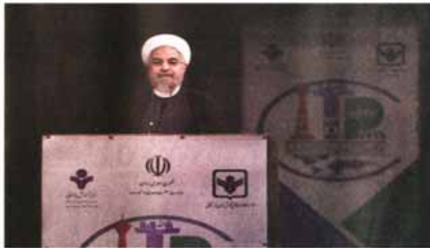
حجت الاسلام والمسلمین حسن روحانی در اولین همایش بین المللی سیاست های صنعتی و تجاری در تهران. در این مراسم، رئیس جمهور با بیان اینکه هیچ وقت مانع حضور سرمایه گذاران آمریکایی نبوده ایم، به بیان سیاست های دولت در جذب سرمایه گذاری خارجی پرداخت.

رئیس کمیسیون صنایع و معادن مجلس دولت و مجلس برای خروج اقتصاد از رکود باید اقدام کنند... (Text continues with details of the commission's report and the president's stance on foreign investment.)