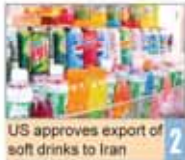
US approves export of soft drinks to Iran