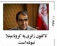
تاکون زاری به گروه مبتلا نبوده است