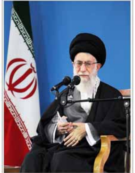
سردار همدانی؛ این روز منته قدیمی و صمیمی و پرتلاش به آرزوی خودنائل آمد

روزنامه روایت ملت ضمن عرض تسلیت و نهایت به خانواده شهید، بر گوار و ملت مسور و شهید بیروز ایران، در کمال تواضع و