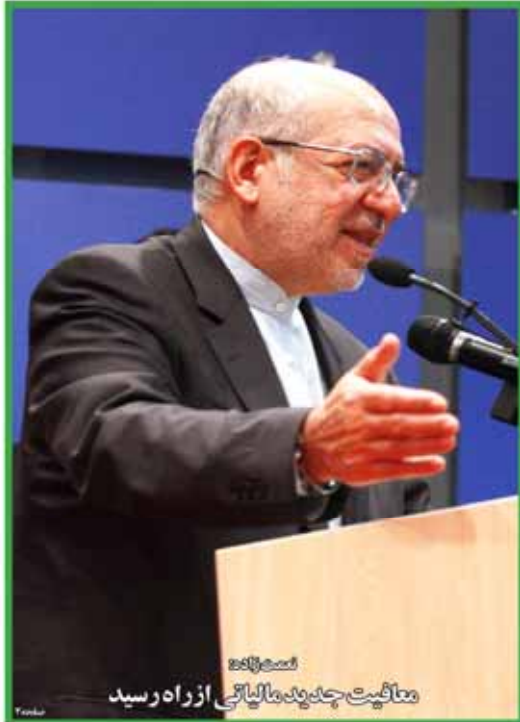
معافیت جدید مالیاتی از راه رسید