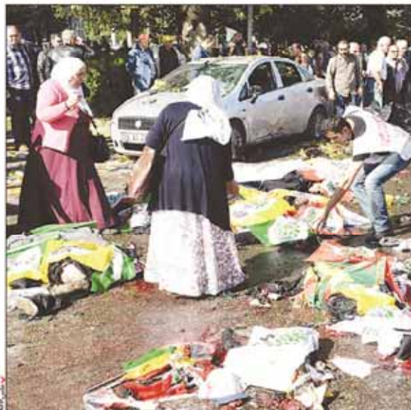
بمب گذاری در آنگارا، ۸۶ کشته به جا گذاشت

فاصله میان توافق هسته‌ای تا اجراء یاد شد