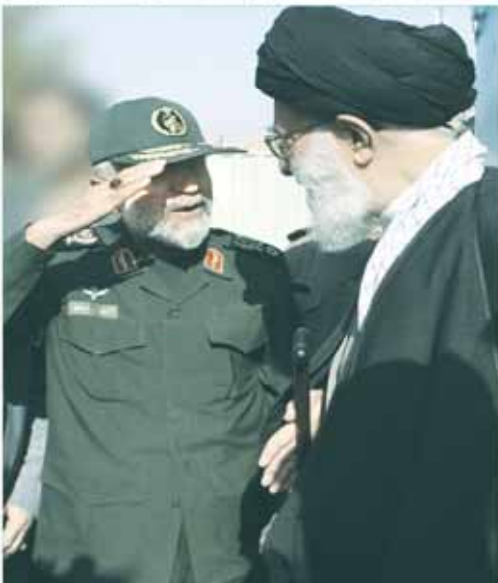
حضرت آیت الله العظمی امام خامنه‌ای رهبر معظم انقلاب اسلامی در پی شهادت سردار شهیدان محمد حسن مهدانی را تبریک و تسلیت می‌گردد.

شهادت سردار شهیدان آیت الله محمد حسن مهدانی را به خانواده‌اش گریه و بارمادگان و دوستان و هم‌راهانش و همه خصوصاً بر رهنمایان سپاه پاسداران انقلاب اسلامی تبریک و تسلیت می‌گردد. این زهدی قدسی و جسی و بر تالی، جوانی باه و نعت خود را در جهاد شرف و ارادت در دفاع از جهن استقامت و نظام حصار در استقامت گرانده