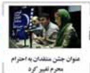
عنوان جشن منتقدان به احترام محرم تغییر کرد