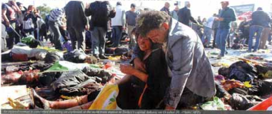
At least 86 people were killed when twin explosions hit a rally of pro-Kurdish and leftist activists outside Ankara's main train station on Saturday in what Turkish President Recep Tayyip Erdogan called a terrorist attack, weeks ahead of an election.