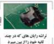
لرشنه رایان های که در چند کاتبه خود را از بین میبرد