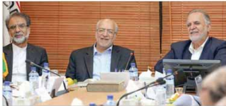
معدن و صنایع معدنی باید جایگاه مناسب‌تری برای ایمیدرو ترسیم شود

سرمایه‌گذاری معدنی به ۱۶۳۴ میلیارد تومان رسید