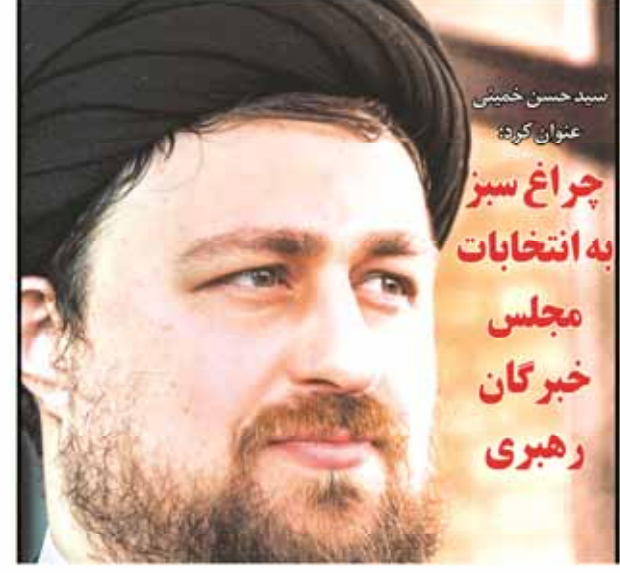
سید حسن خمینی عنوان کرده: چراغ سبز به انتخابات مجلس خبرگان رهبری

شنبه ۳۰ آبان ۱۳۹۴ • ۱۵ • شماره ۱۵۱ • صفحه ۱۵ • قیمت ۱۰۰۰ تومان