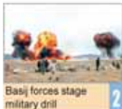
Basij forces stage military drill