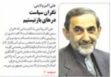
علی اکبر ولایتی نگران سیاست درهای باز نیستیم

شنبه ۳۰ آبان ۱۳۹۴ • ۱۵ • شماره ۱۵۱ • صفحه ۱۵ • قیمت ۱۰۰۰ تومان