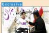
World's juggling record holder needs support