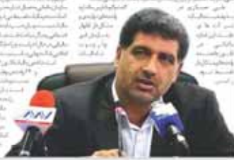
روزهای هیبت‌گازی جهان به تیران

رشد ۸ درصدی اقتصاد در پساتحریم، تقسیم مالیات واحدهای تولیدی مشکل دار است. کاروبی در این باره می‌گوید: «در حالی که ما در سال ۱۳۹۳ با رشد ۸ درصدی مواجه شدیم، اما در سال ۱۳۹۴ این رشد به ۷ درصد کاهش پیدا کرد. دلیل این امر، مشکلاتی در بخش مالیات و تعرفه است. ما نیاز داریم که سیستم مالیاتی را اصلاح کنیم تا بتوانیم بودجه را افزایش دهیم و هزینه‌های دولت را کاهش دهیم.»