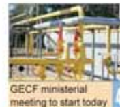
GECF ministerial meeting to start today

Number 5221 • Saturday November 21, 2015 • Aban 30, 1394 • Safar 9, 1437 • Price 5,000 Rials • 12 Pages • www.irandailyonline.ir