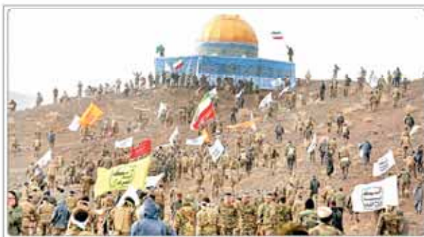
برگزاری مرحله دوم رزمایش بزرگ «الی بیت المقدس»

رئیس جمهوری روسیه در جریان دیدار خود با پوتین... مذاکرات ایران و روسیه درباره انرژی و آینده خاورمیانه