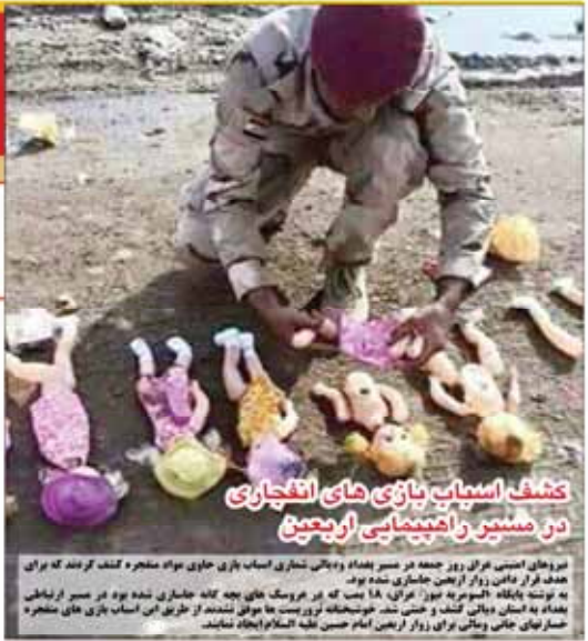
کشف اسباب بازی های انتحاری در مسیر راهپیمایی اربعین

روزنامه برابری صبح ایران WWW.EMTIAZDAILY.IR سند تحول در نظام آموزشی آماده اجرا پیشنهاد ایجاد تشکیلات وابسته به جی بی سی اف