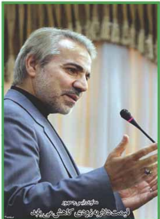
مهدی کاروبی قیمت دلار به زودی کاهش می‌یابد

شماره ۱۳۹۴ ۶ مهر ۱۳۹۴ ۲۱ آبان ۲۰۱۵ سال چهارم، شماره ۳۳۱ صفحه ۱۲ ۱۰۰۰ تومان