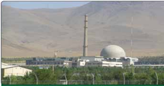
تکمیل امضای سند بازطراحی راکتور اراک توسط ۱+۵ و موگرینی

بلومبرگ تحریم های ایران تا ژانویه برداشته می شوند