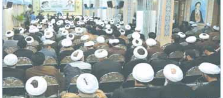
جلسه ۳ روزه مفسران در محل نشست. در این نشست ۳ روزه، مفسران و خادمین قرآن در محل نشست.

امروز - به همت مؤسسه پژوهشی فرهنگی فوج نشست «چالشهای بازخوانی حماسه عاشورا» برگزار می‌شود نشست «چالشهای بازخوانی حماسه عاشورا» ۳۰ آبان ماه در محل مؤسسه پژوهشی فرهنگی فوج برگزار می‌شود. این نشست با حضور اساتید و محققان در زمینه تاریخ و ادبیات برگزار می‌شود.