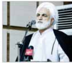
آیت‌الله آملی لاریجانی

شماره ۲۱۵ - ۲۱۵ - ۲۱۵ شماره ۲۱۵ - ۲۱۵ - ۲۱۵ شماره ۲۱۵ - ۲۱۵ - ۲۱۵