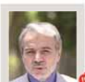
نوشته: نرخ ارز در بودجه ۹۵ هژانند مقاله گذشته است

کمالوندی: اجرایی شدن این سند منوط به بسته شدن پرونده است. ام دی است