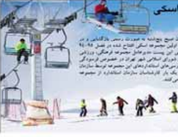
بازگشایی پیست اسکی بین المللی توجال