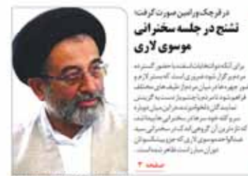
فرچک دوربین صورت گرفت شبح در جلسه سخنرانی موسوی لاری

پیست بین المللی اسکی توجال بعد از سه سال تعطیلی به صورت رسمی بازگشایی شد. این پیست یکی از بزرگترین پیست های اسکی در ایران است. بازگشایی این پیست می تواند به توسعه ورزش های زمستانی در ایران کمک کند.