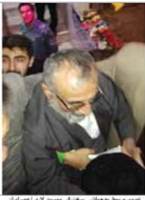
صورتی مربوط به حواشی سخنرانی موسوی لاری اصراریان

فرماندار فرچک در گفتگو با آفتاب بزداژ: مجمع کنشستگان معترض از شکرستان فرچک نبودند این افراد فقط چند نفر بودند که سازماندهی شده بودند مسئول برگزاری نشست در گفتگو با آفتاب بزداژ: مجمع کنشستگان وزیر کشور را تهدید می کند میتینگ قانونی است برای تمام دستگامها تعویق تکلیف کفایت؟