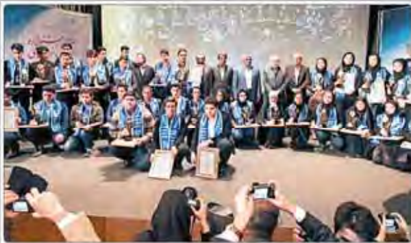
برگزیدگان هفدهمین جشنواره جوان خوارزمی معرفی شدند

شورای حکام آژانس بین‌المللی انرژی اتمی (IAEA) قطعنامه‌ای صادر کرد که در آن برنامه هسته‌ای ایران را «مطمئن» ارزیابی کرد. این قطعنامه در نشست روز سه‌شنبه شورای حکام در وین، اتریش، به تصویب رسید.