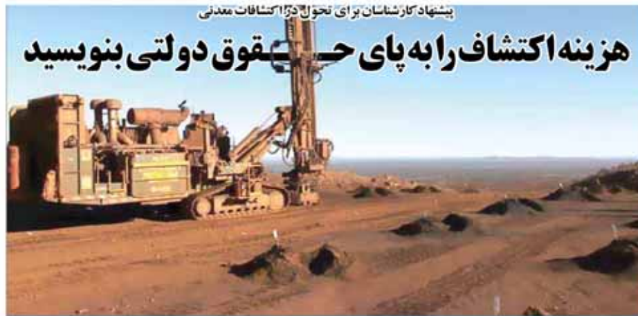
پیشنهاد کارشناسان برای تحول در اکتشافات معدنی